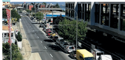
L'avenue des Portes-Rouges aujourd'hui.

La Ville va réaménager l'avenue des Portes-Rouges de façon à améliorer la mobilité pour tous les modes et la qualité des espaces publics. Ce projet, de même que la restructuration de la parcelle de la Coop (Plan spécial et permis construire), seront présentés au public jeudi 9 septembre à 19h30, dans l'aula du Collège du Mail, Bellevaux 52 (entrée au nord du bâtiment, rez-de-chaussée), en présence des responsables de la Ville et des concepteurs. En raison de la pandémie, il est obligatoire de s'inscrire d'ici le 6 septembre à urbanisme.neuchatel@ne.ch ou au 032 717 76 60 en indiquant le nom, prénom et numéro de téléphone de chaque participant-e. ●