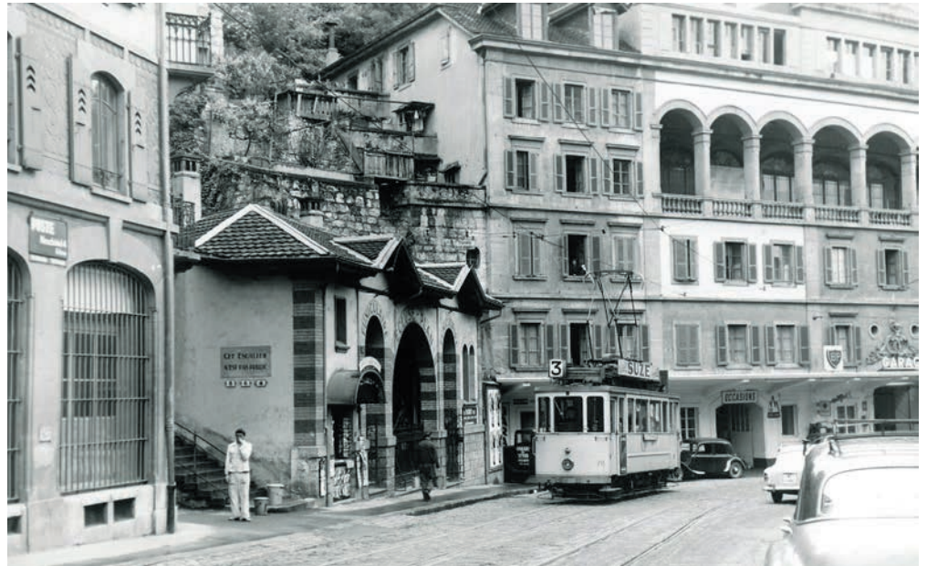
Le ciné-concert ravive notamment le souvenir de la ligne 3, qui reliait Neuchâtel aux villages de Peseux et Corcelles-Cormondrèche.

Le voyage se poursuit dans les années 1950, avec un court-métrage poétique d'Henry Brandt sur le bourg de Valangin et un film promotionnel sur le canton de Neuchâtel «qui en amusera plus d'un, avec les commentaires et la bande-son d'époque». Enfin, un montage de trois documentaires ravive le souvenir des tramways qui circulaient autrefois dans les quatre communes, dont le célèbre tram 3, fil rouge entre Neuchâtel et les villages de Peseux et Corcelles-Cormondrèche. Les moins jeunes d'entre nous s'en souviennent peut-être: c'est la dernière ligne à avoir été démantelée, à la fin des années 1970, pour être remplacée par des bus. Les films s'accompagnent d'une création musicale