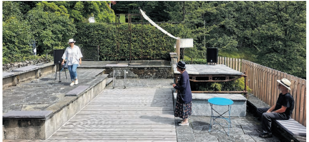
Les représentations se tiendront sur l'ancienne piscine de Dürrenmatt.

Programme et inscriptions : www.lessports.ch