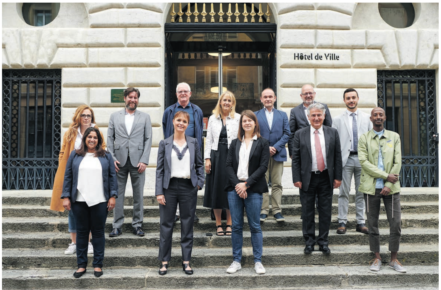
Le Conseil communal in corpore, les membres de la commission Culture, intégration et cohésion du Conseil général, les représentants des pétitionnaires et le chancelier de la Ville, à l'issue de la conférence de presse.

Enfin, la Ville envisage de réaménager d'ici dix ans la place Pury, afin de lui permettre de redevenir une vraie belle place publique. ●