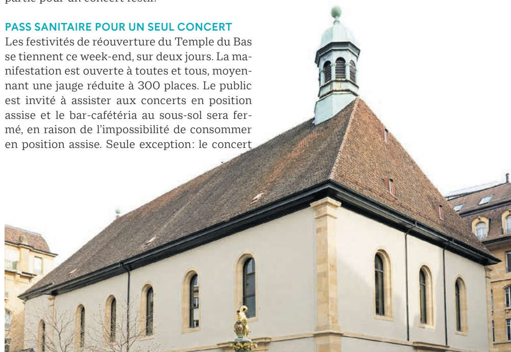
les travaux de rénovation se sont achevés au printemps.