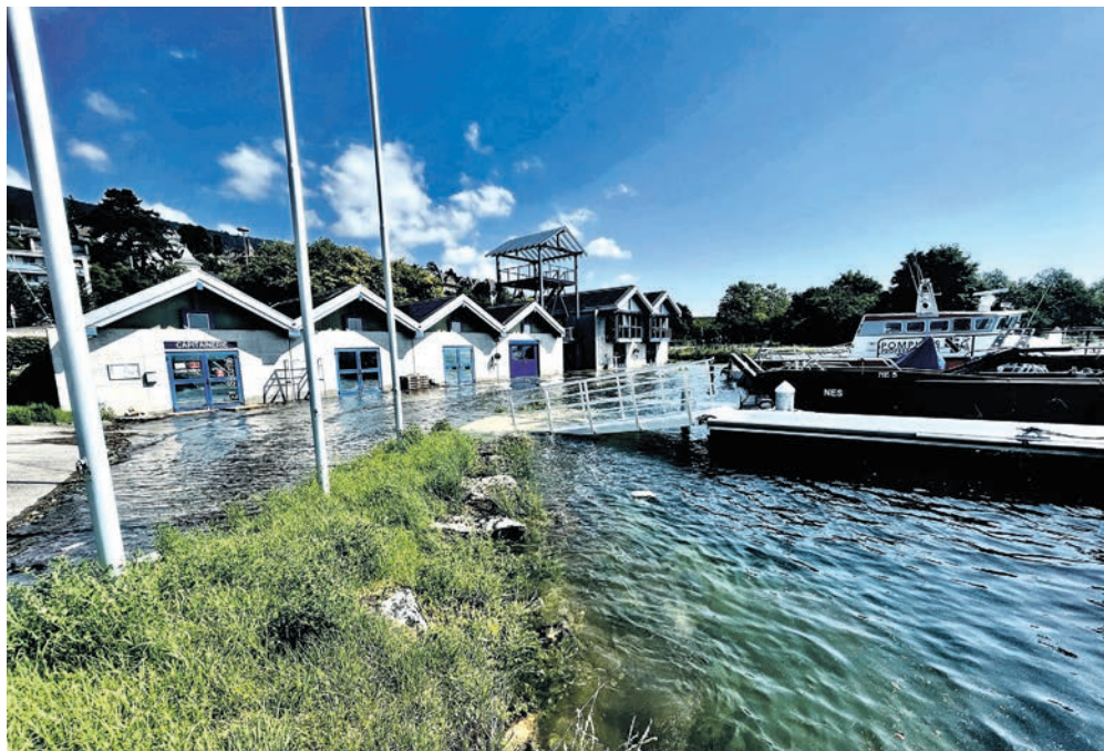
La capitainerie du Nid-du-Crô inondée, le 18 juillet, avec le bateau de sauvetage «L'Oriette» au ponton immergé.

17 juillet: Le ciel offre un répit bienvenu, mais les services ne relâchent pas l'effort. Il faut sécuriser