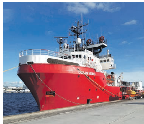
Le navire humanitaire Ocean Viking, ici à Marseille, peut embarquer jusqu'à 200 rescapé-e-s.