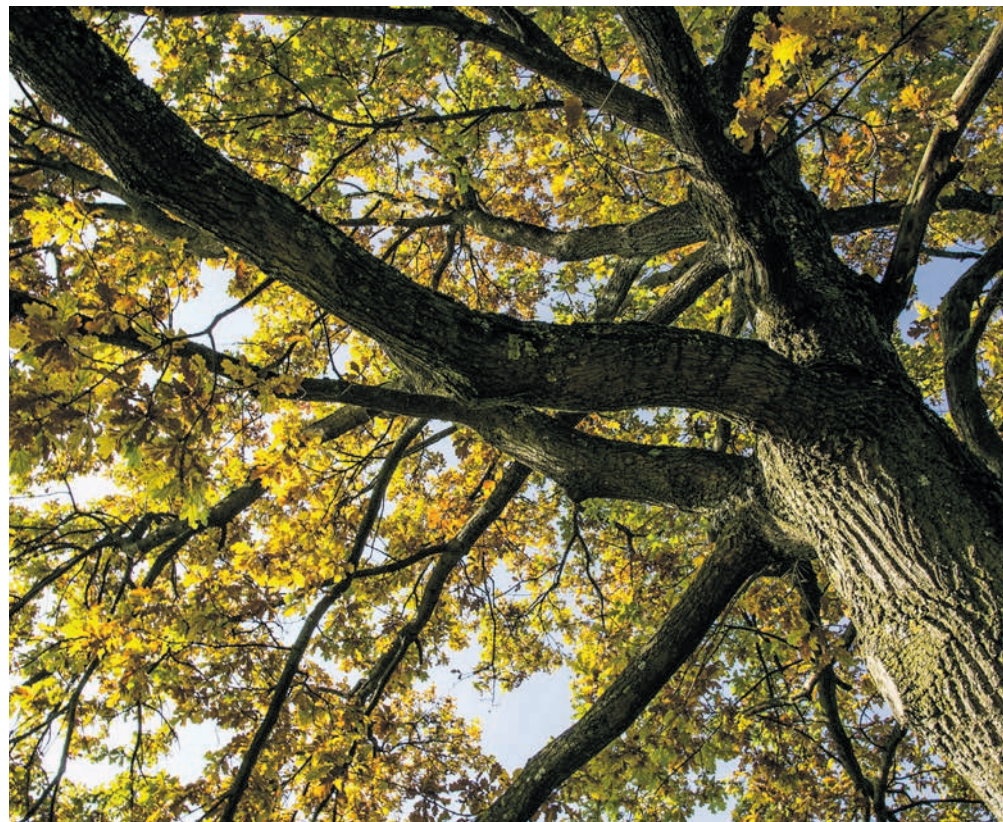
Symbole de force et de sagesse, le chêne suscite notre admiration depuis longtemps.

Chargé de symboles et d'histoire, cet arbre nous accompagne depuis des millénaires. Mais il est aussi l'un des plus grands protecteurs de la biodiversité, et il pourrait représenter l'avenir de nos forêts.