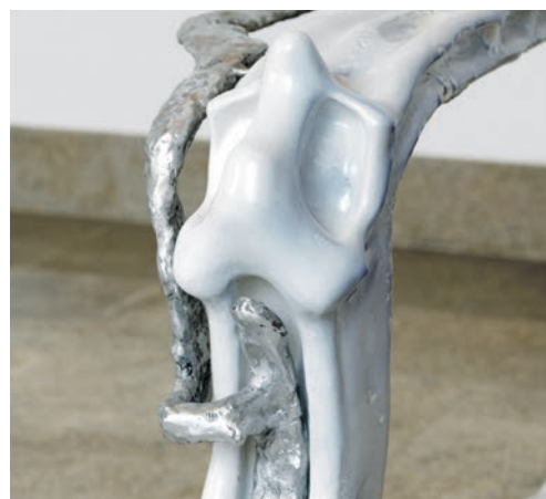
Les sculptures en céramique d'Isabelle Andriessen se transformeront durant l'exposition.

Le Centre d'art de Neuchâtel a inauguré deux nouvelles expositions. A découvrir jusqu'au 28 novembre !