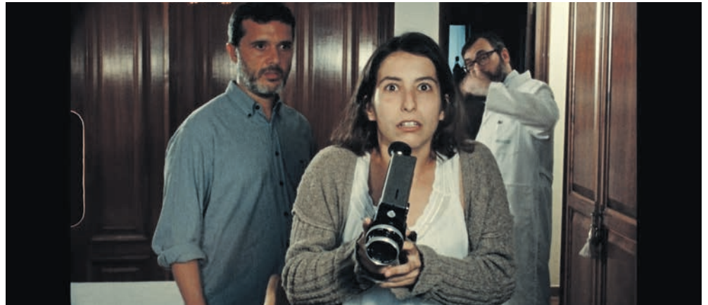
Lors de la dernière édition, le prix du jury était revenu à «Charo8», de Joaquin Asencio.

→ Peseux Sur le parking de la Maison de Commune Samedi 23 octobre, de 9h à midi