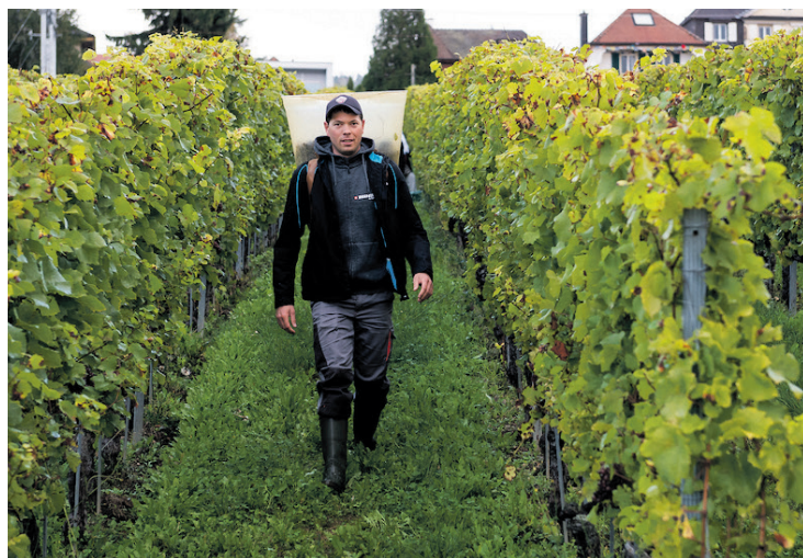
Dans cette vigne des hauts de Serrières, les vendanges étaient rythmées par les allers et retours des «brandards».