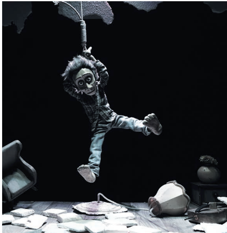
Les Berlinoises du Merlin Puppet Theatre invitent le public à découvrir leur univers sombre mais virtuose à la Case à chocs. MERLIN PUPPET THEATRE