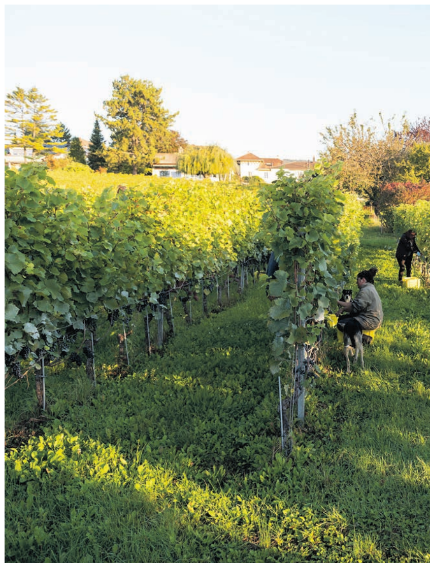
Plus tardives que de coutume ces dix dernières années, les vendanges ont débuté au