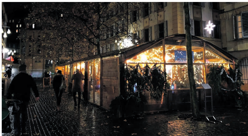
Des terrasses d'hiver, comme ici à la rue du Coq d'Inde l'hiver passé, pour dynamiser la cité.

Pour soutenir les établissements publics toujours durement touchés par la crise sanitaire, la Ville de Neuchâtel leur permet à nouveau d'installer dès à présent une terrasse à la saison froide, en renonçant à prélever la taxe d'utilisation du domaine public.