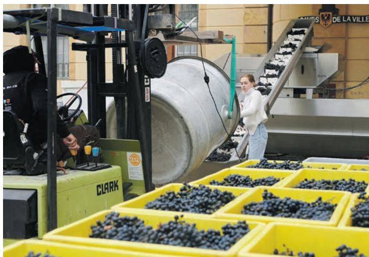
A la cave, les grappes récoltées sont acheminées dans la fouleuse à l'aide d'une «girafe», ou élévateur à raisins. DAVID MARCHON