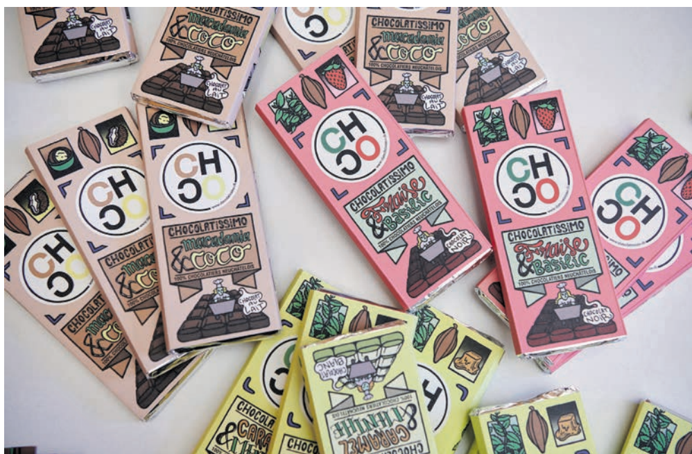
L'emballage des trois plaques spéciales Chocolatissimo et les visuels de promotion de l'événement ont été créés par l'illustrateur Alexandre Sangsue, alias Sparga.