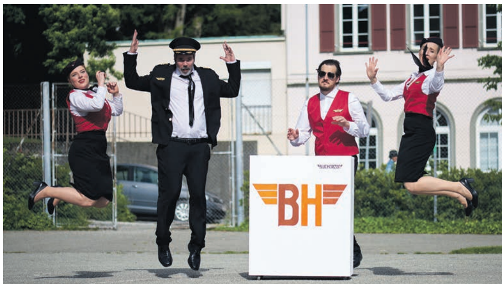
Hôtesse de l'air et commandant de bord accueilleront les passagers au « Pommier Airport », via le collège de la Promenade sud.