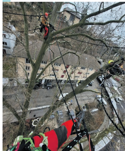
Les arboristes-grimpeurs des Parcs et promenades au chevet du platane de la rue de l'Ecluse.

C'est la saison des soins et des coupes d'arbres: les arboristes-grimpeurs des Parcs et promenades ont procédé la semaine dernière au renouvellement du système de haubannage du vénérable platane de la rue de l'Ecluse, vieux de 160 ans. Une mesure préventive — les haubans ont une durée de vie de 8 à 10 ans — qui permet de limiter les fortes oscillations de la ramure en cas de vent violent et qui s'ajoute à la taille de maintien effectuée tous les trois ans, ceci afin de limiter les risques au maximum. Ici une des photos, impressionnantes, prises par Cyril Grand-Guillaume, spécialiste en soins aux arbres. Bravo à lui et à son équipe! ●