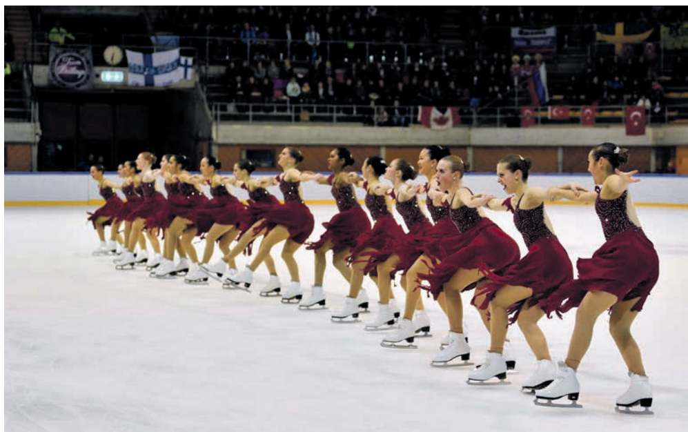
Par groupe de douze à seize patineuses, les concurrentes du Neuchâtel Trophy doivent faire preuve d'esprit d'équipe et de grâce.