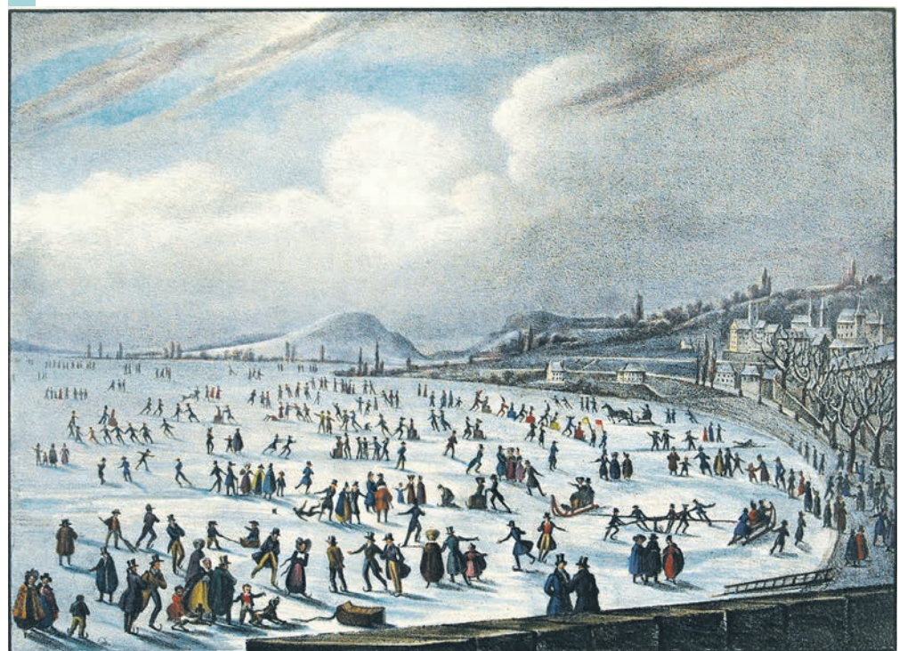
Neuchâtel en février 1830: des milliers de gens s'amuse dans la baie de l'Évole.

mètres par endroits. «Quatre carrousels, une foule de petit traîneaux portant des dames, quelques tables où on venait prendre des rafraîchissements, tout cela formait un spectacle unique, un enchantement qui n'attendait qu'un souffle de vent pour disparaître.» Plus de cent personnes ont, alors, tenté la traversée du lac à pied. Les autorités, pour éviter les noyades, avaient fait installer des cordes et des échelles auxquelles pouvaient s'accrocher les imprudents. Trois personnes y auraient malgré tout laissé leur vie. ●