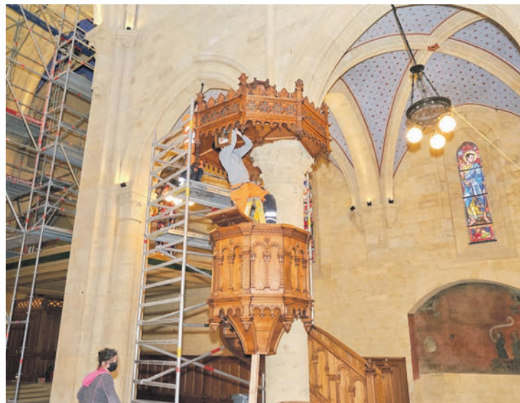
La chaire du XIX e siècle a été démontée pièce par pièce et remise en état.