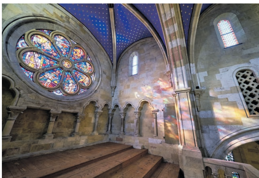
Jeux de lumière sur la galerie et son vitrail en rosace.

Quel contraste saisissant avec 2017, lorsque la Collégiale, aux murs sombres et au plancher grinçant, entamait sa cure de jouvence intérieure, séparée en deux par une paroi provisoire qui avait permis de poursuivre cultes et concerts. Ou en 2020, lorsque les fouilles archéologiques mettaient au jour une nécropole médiévale. En promenant aujourd'hui son regard sur la Collégiale, on ne peut qu'admirer, au plafond et sur les murs, le travail patient des restauratrices et restaurateurs de pierre et de peinture murale du consortium MJFZ (Muttner James Facchinetti Zuttion), ainsi que les boiseries restaurées par Christian Schouwey. Au sol, un audacieux terrazzo foncé parsemé de graviers du lac côtoie gracieusement les carreaux réutilisés de l'époque de Léo Chatelain. La Ville de Neuchâtel, propriétaire des lieux, aura consacré une enveloppe de 23 millions de francs pour restaurer l'extérieur et l'intérieur de cet édifice iconique du XII e siècle, à découvrir dès le 17 avril. ●