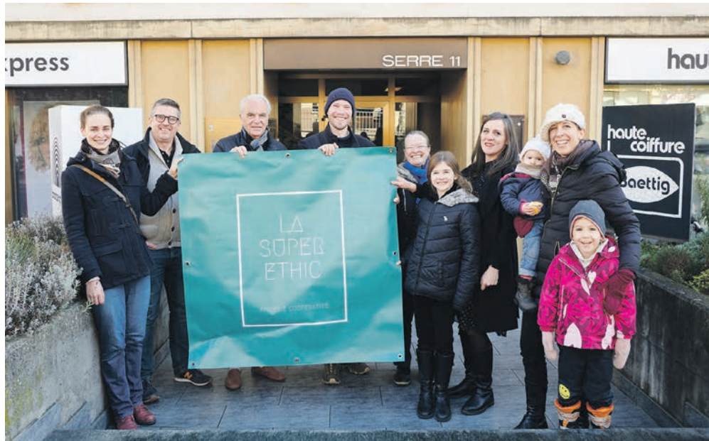
Une partie du comité de la Superethic pose devant les locaux de sa future épicerie coopérative.

La coopérative Superethic a trouvé de nouveaux locaux, sis au numéro 11 de la rue de la Serre, à proximité idéale du centre-ville. Encore à la recherche de membres coopérateurs, elle organise une visioconférence publique ainsi que deux séances d'information en petits groupes. L'ouverture du magasin est prévue pour le mois d'avril prochain.