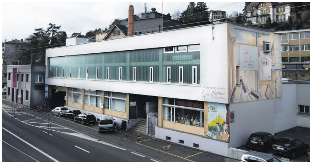
L'Académie de Meuron, Ton sur Ton et la Case à Chocs se dévoilent au public.

→ Temple du Bas Mercredi 9 février à 17h Dès 6 ans Réservations: www.esn-ne.ch/billetterie