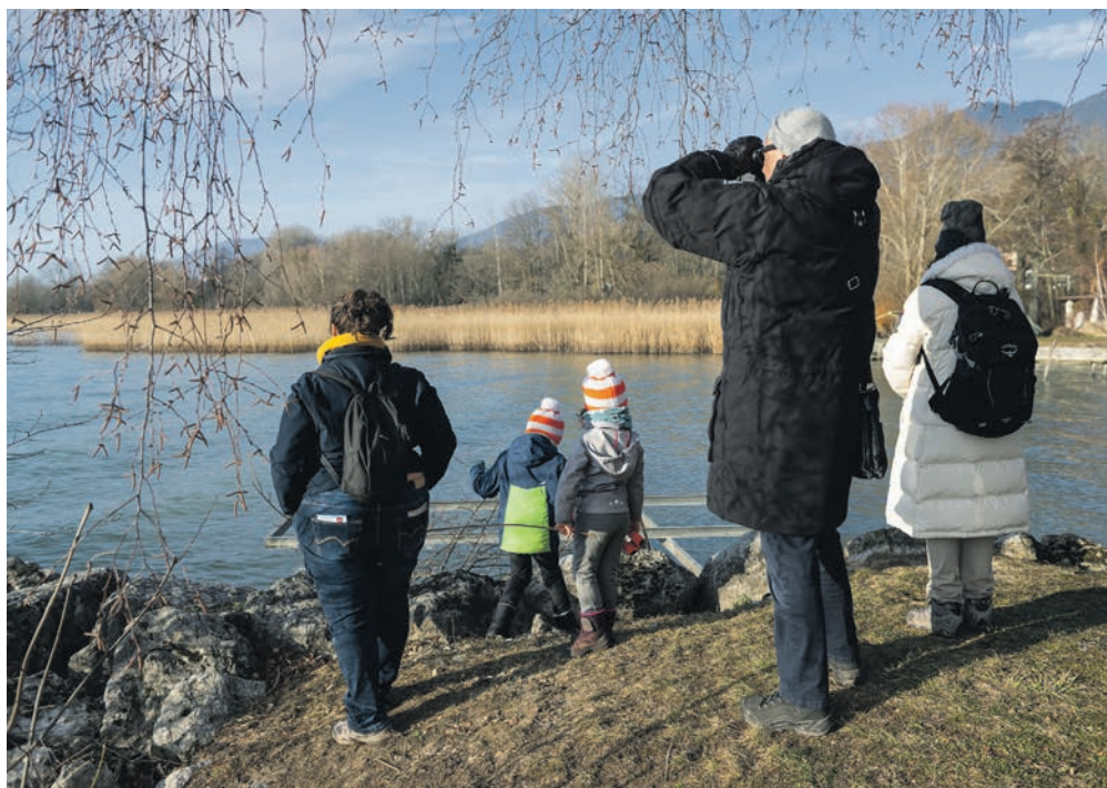
Le port de Bevaix, les roselières et ses alentours boisés, près du Moulin, se prêtent à de belles observations d'oiseaux d'eau et de toutes sortes d'autres espèces.