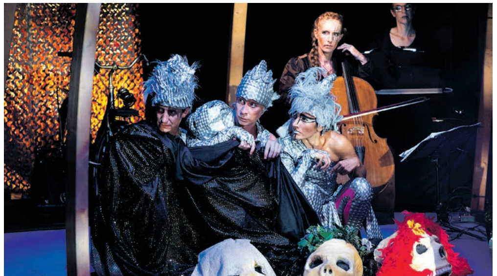
Un spectacle poétique, où le monde des hommes, des arbres et des dieux voisinent. FELIX IMHOF

Si la pièce souligne l'urgence climatique en dénonçant notamment l'hyper-consumérisme de notre société vouée au divertissement, elle le fait avec humour, légèreté et poésie, à la manière d'un conte.