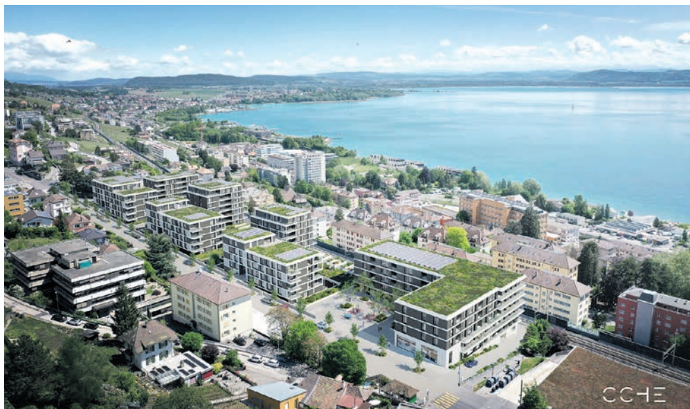
Le projet Bella Vista, à La Coudre, devrait accueillir ses premiers habitant-e-s à fin 2023. BELLA VISTA

Points communs de ces quartiers: ils misent sur la durabilité et la mixité sociale, avec la volonté de créer entre leurs futurs habitant-e-s un véritable lien social. Ils proposeront aussi des appartements avec encadrement, dont le besoin ira croissant dans le canton ces prochaines années. Et les différents bâtiments construits sur chaque parcelle auront des affectations différentes: propriété par étage, location classique, logements d'utilité publique, pour étudiants parfois ou même pour personnes à mobilité réduite. Avec des services partagés, des salles communes, des jardins potagers et un concept misant, souvent, sur la mobilité douce. A Beaugard-Dessus, comme à Tivoli-Sud, les développeurs conserveront des éléments construits existants: une maison deviendra un espace communautaire à Beaugard, et le bâtiment du café du Pont, à Serrières, trouvera une