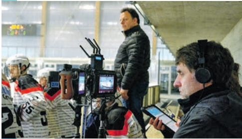
Le tournage du film «L'Échappée» aux patinoires du Littoral en début d'année.