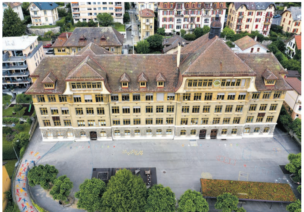
L'enveloppe budgétaire pour l'intervention artistique, en rapport avec les montants engagés dans la restauration et l'extension du collège des Parcs, s'élève à 285'000 francs. ARCHIVES

Un jury indépendant, composé de personnalités des milieux artistique, architectural, pédagogique, de la jeunesse et de l'association de quartier, aura pour mission de proposer au Conseil communal le projet le plus pertinent à l'issue de la seconde phase du concours où quatre à six dossiers auront été retenus, puis présentés au jury à l'automne 2022. Le délai de remise des dossiers est fixé au 30 mai. La marche à suivre pour postuler et le cahier des charges complet peuvent être obtenus auprès de culture.vdn@ne.ch . ●