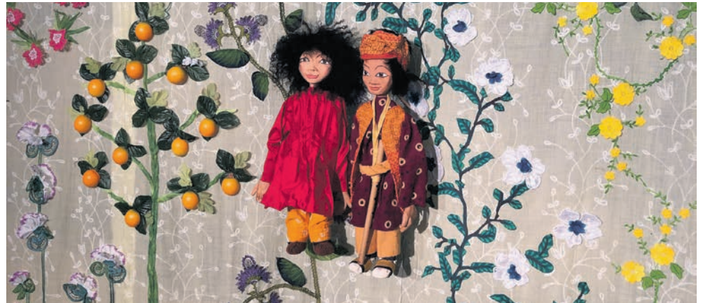
Dans le jardin magique de «Bagh Jadui», au profit de l'association Mail-Mali.

→ La Mezzanine Rue des Usines 17 Lundi 9 mai à 18h30 Inscription obligatoire: https://lamezzanine.ch/agenda