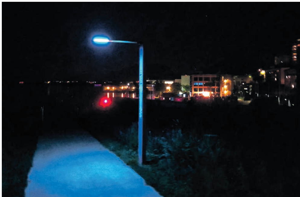
Le groupe VertsPopSol rappelle qu'une baisse de l'intensité lumineuse et un éclairage dynamique (détecteurs de présence) modéreront la pollution lumineuse.

L'éclairage privé sur l'espace public (vitrines, enseignes lumineuses, sites industriels...) devra aussi être modéré. Faute de base légale, cela passera dans un premier temps par le dialogue. Au