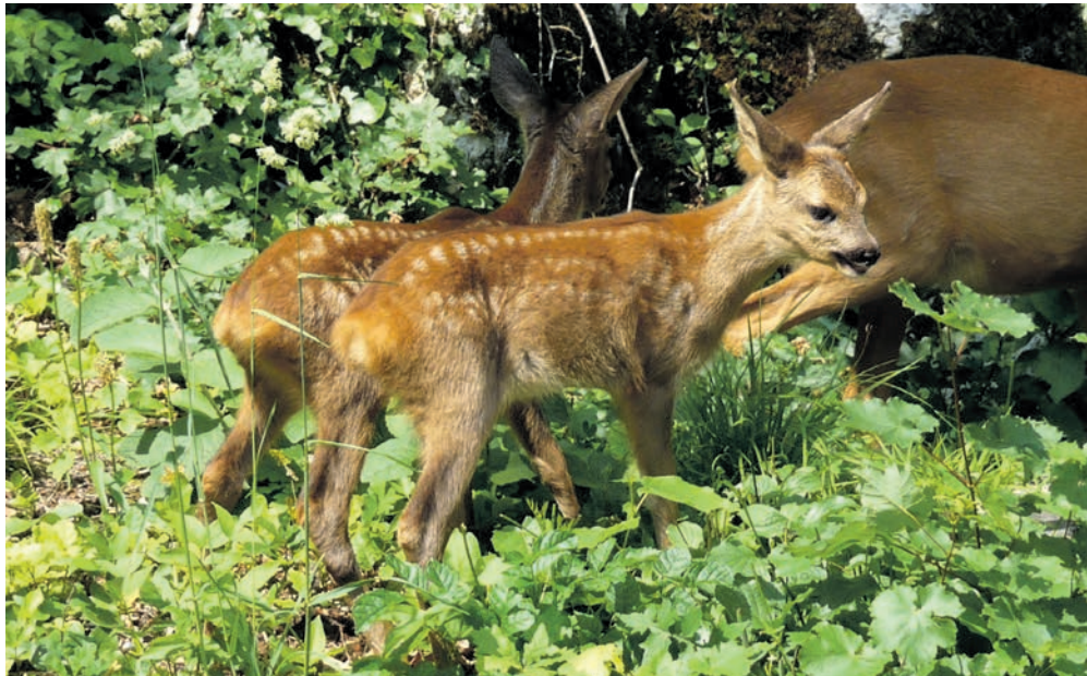
Frédéric Chiffelle a immortalisé les deux faons et leur mère qui avaient élu domicile dans son jardin. FRÉDÉRIC CHIFFELLE

Toujours plus prisée des promeneurs et des sportifs, la forêt qui domine Neuchâtel offre moins de tranquillité aux chevreuils. Certains trouvent refuge dans les jardins privés du vallon de l’Ermitage et des femelles vont jusqu’à y mettre au monde leurs petits.