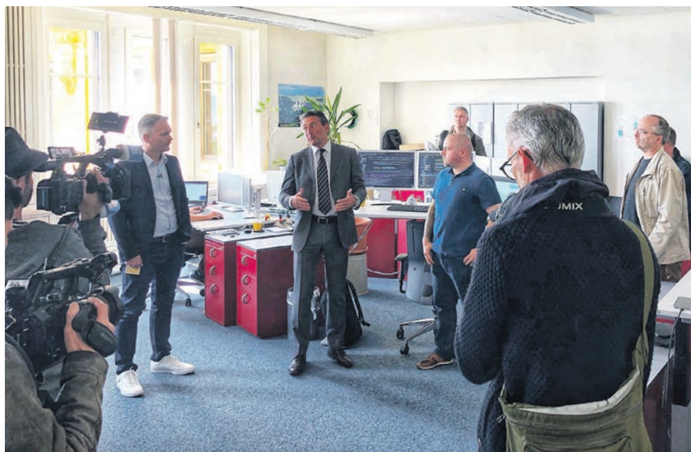
Le CEO de La Poste suisse (au centre) était à Neuchâtel la semaine dernière.

Le centre de compétences de Neuchâtel ne travaille pas uniquement sur nos futurs scrutins. Il emploie au total une cinquantaine d'ingénieurs de haut vol, pour la plupart recrutés localement, qui développent des applications informatiques pour l'ensemble de la Suisse. Le service IncaMail de chiffrement d'e-mails, permettant des envois sécurisés, est par exemple une solution développée à Neuchâtel. « Nous avons de très bons contacts avec les hautes écoles, avec qui nous collaborons régulièrement », se réjouit Baptiste Lanoix, responsable du site informatique de Neuchâtel. ●