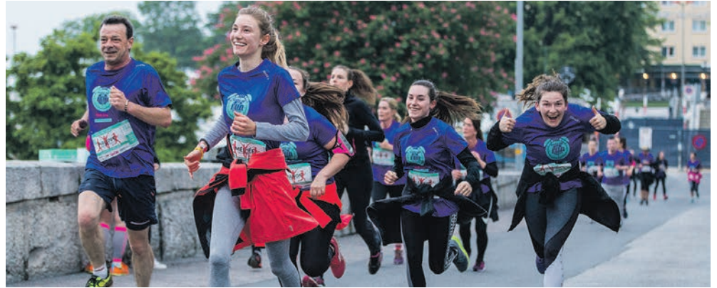
Près de 1500 athlètes sont attendus vendredi 20 mai dès 5h à la place du Port. DAMIEN SENGSTAG

→ Terrain de football du Chanet Dimanche 15 mai à 11h Informations: www.neuchatelknights.ch