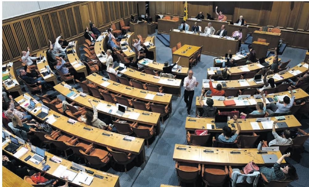
Le Conseil général a approuvé à l'unanimité la démarche du Conseil communal, visant à réduire fortement la pollution lumineuse émise sur l'ensemble du territoire.

Le Conseil général a pris acte à l'unanimité du rapport d'information du Conseil communal au sujet de la pollution lumineuse et du gaspillage énergétique dus à l'éclairage nocturne. Il a également classé deux motions y relatives.