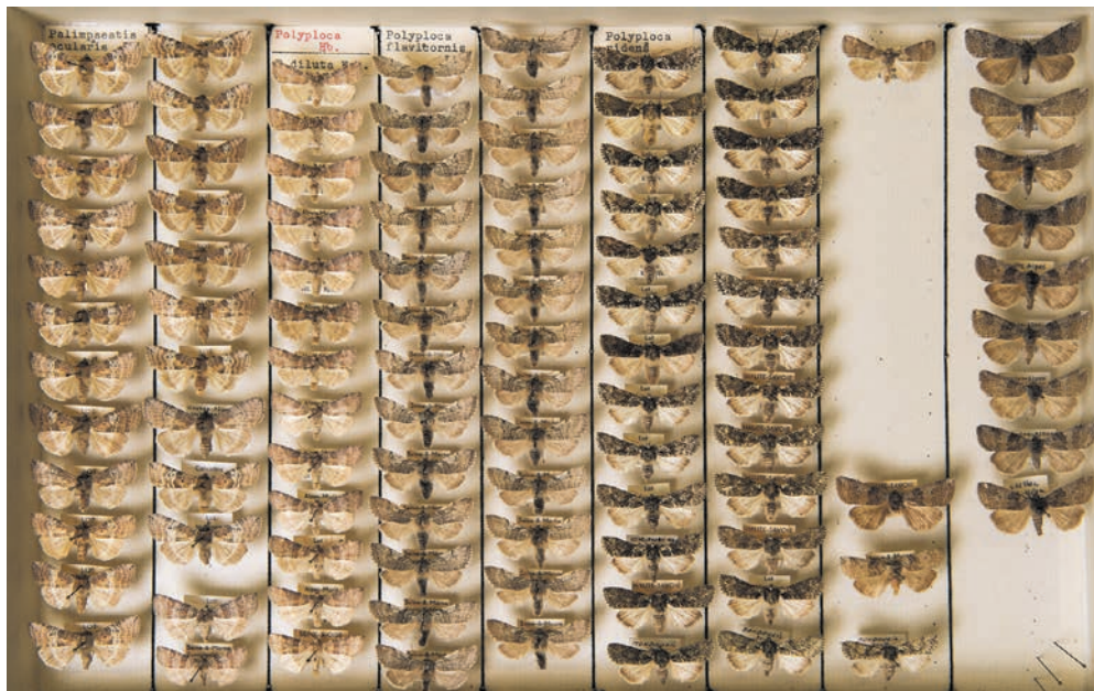
Le groupe PLR regrette que le Conseil général ait «succombé à la précipitation» à propos du crédit complémentaire du pôle de conservation.

Dans le but d'éviter de grever inutilement les finances de notre commune, le groupe PLR a amen-