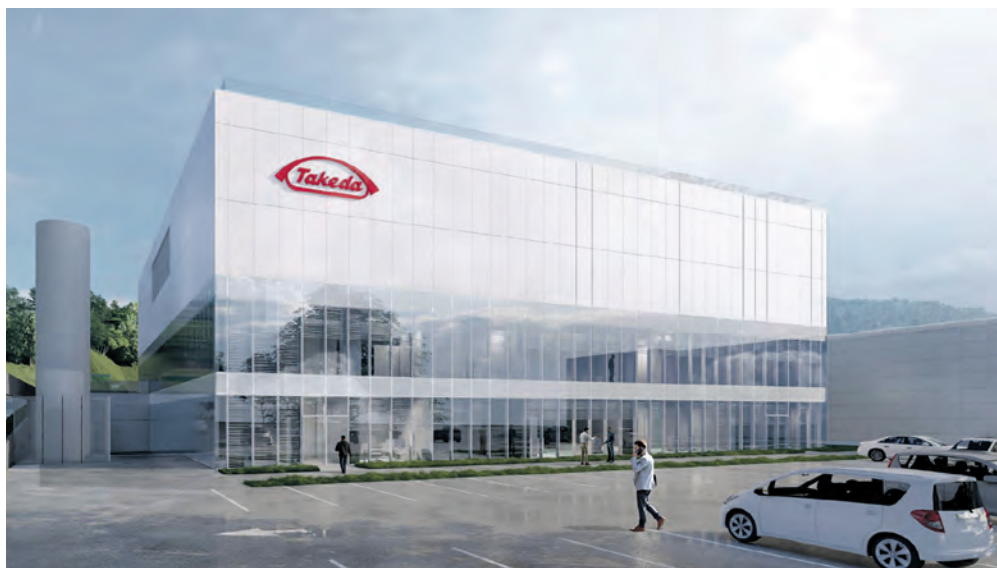
Le nouveau bâtiment accueillera une nouvelle ligne de remplissage aseptique. IMAGE SP