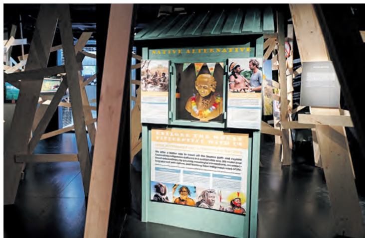
Jean-Jacques Rousseau présenté comme vendeur de voyages, uniques et authentiques, suscitant la réflexion sur l'appropriation culturelle.