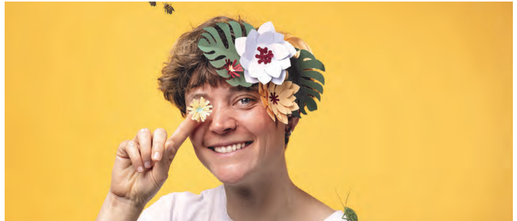
Trois jours de joyeux spectacles et de conférences inspirantes, pour célébrer le vivant. LUCAS VUITEL

→ Péristyle de l'Hôtel de Ville Samedi 25 juin, dès 9h. Entrée libre