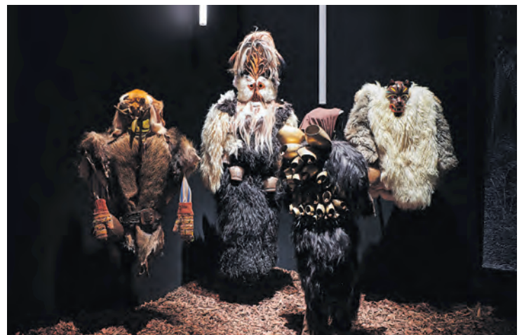
Plusieurs masques de carnaval, comme ceux que l'on peut voir défiler au Noirmont ou à Evolène, évoquent des figures sauvages.