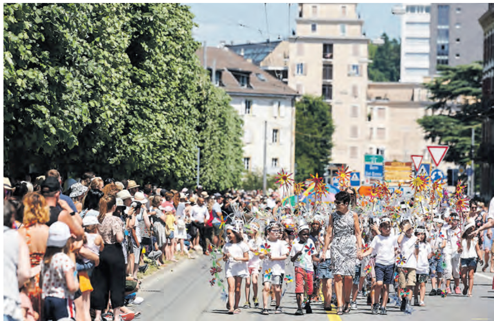
Rendez-vous le 1 er juillet pour le grand défilé (ici l'édition 2019).

Ces travaux seront aussi l'occasion d'adapter les arrêts de bus en fonction des normes LHand: la Ville s'apprête ainsi à achever la mise aux normes de la quasi-totalité des quais de transports publics sur son territoire d'ici fin 2023. En conséquence, l'arrêt «Boine» sera déplacé de quelques dizaines de mètres pour davantage de cohérence et pour faire jonction avec l'arrêt du funiculaire du Plan. La Ville prévoit également la création de surfaces perméables, végétalisées ou non, sur les côtés de la rue, afin de lutter contre les îlots de chaleur et dans le but de mieux intégrer la biodiversité au cœur des quartiers. A noter aussi le maintien de la plupart des places de stationnement public sur la rue, et surtout l'ajout de près de trente places pour les vélos. Les travaux devraient se finir en mai 2023. ●