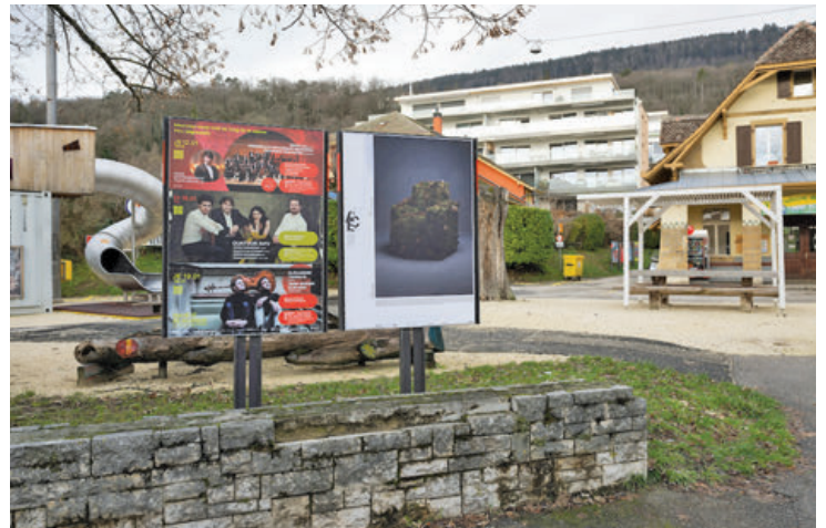
Avant de s'élever à 1000 mètres grâce au funi de Chaumont, on prendra d'abord un bol de culture à La Coudre!