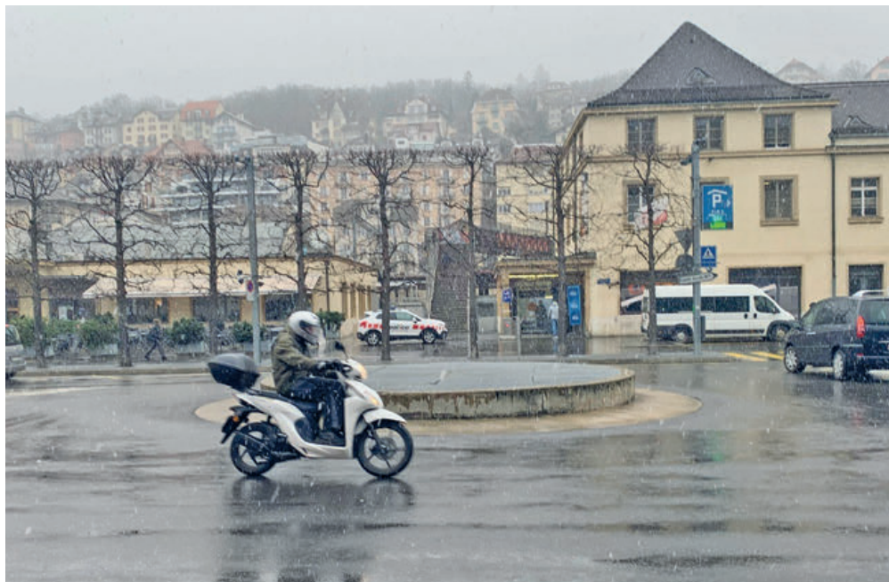
Les groupes ont débattu de l'accès au plateau de la gare, et notamment du sens de la circulation au Crêt-Taconnet.

Cependant, stop à un contre-sens cycliste à la descente et stop à la mise en place d'une zone de rencontre à Crêt-Taconnet!