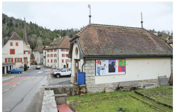
Et l'exposition continue sur la route de Boudevilliers, à deux pas du bourg de Valangin, connu comme l'un des plus beaux villages de Suisse.