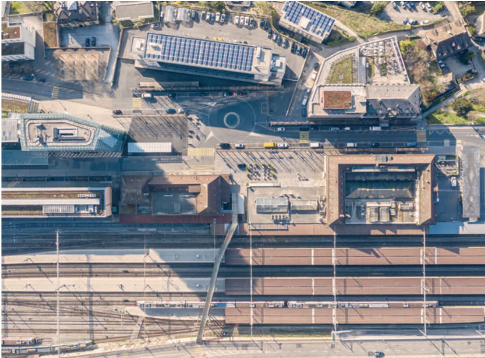
Le secteur de la gare de Neuchâtel, vu de drone en avril 2020, lors de la période de confinement.

Pour sa première séance de l'année 2023, le Conseil général s'est montré studieux. Désormais réunis avec une demi-heure d'avance, les élu-e-s ont traité une longue liste de rapports d'information, permettant ainsi de classer quantité d'objets. Le réaménagement du sud de la gare et de la rue du Crêt-Taconnet en zone de rencontre a été largement salué.