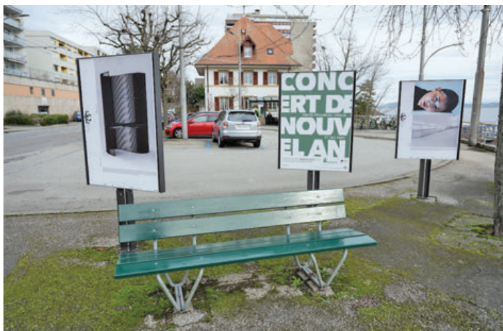
Au Clos-de-Serrières comme ailleurs, les œuvres seront renouvelées toutes les deux semaines.