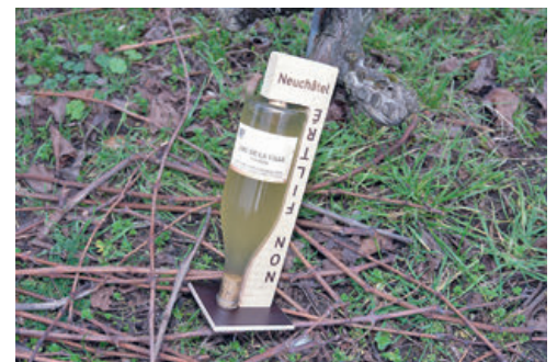
Collées à l'envers, les étiquettes rappellent l'importance de retourner la bouteille.

Car contrairement à une idée reçue, le non-filtré se garde bien plus longtemps que les quelques mois d'hiver. «La lie a un rôle conservateur dans le vin», note Patrick Sandoz. Envie de déguster ce nouveau millésime? Les traditionnelles présentations publiques organisées par Neuchâtel Vins et Terroirs se tiennent ce mercredi 17 janvier dès 17h chez Facchinetti Automobiles à Neuchâtel et le lendemain à La Chaux-de-Fonds. ● AB