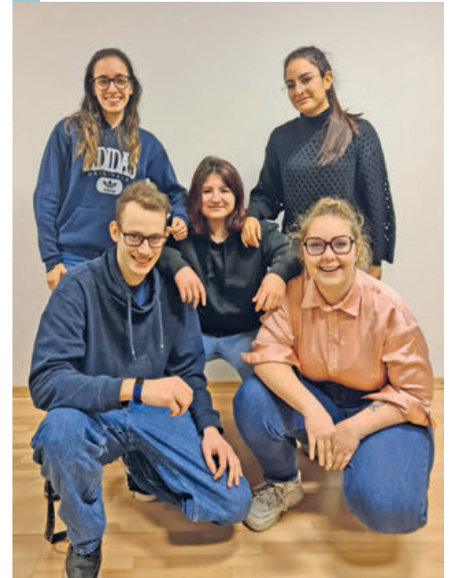
Le nouveau comité pour 2023.