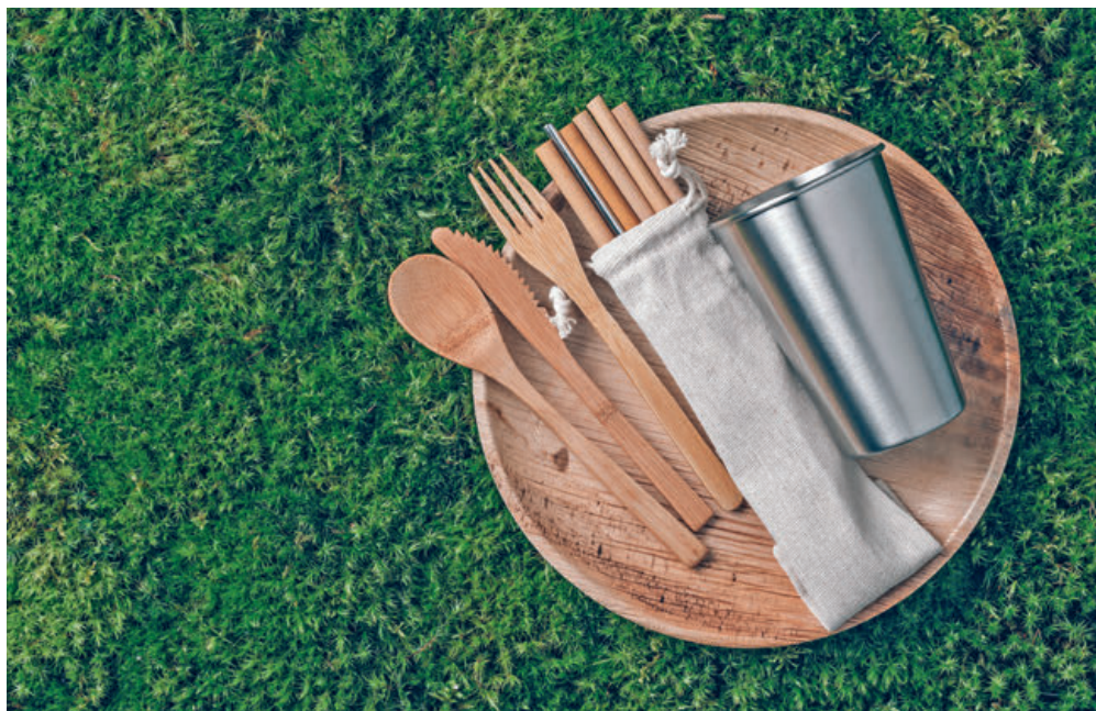
Le plastique réutilisable, le carton, le papier, le bois, le verre ou la céramique remplaceront l'ancienne vaisselle.

Le flyer répond aux questions «qui? quoi? comment? pourquoi? qui est concerné, de quelle