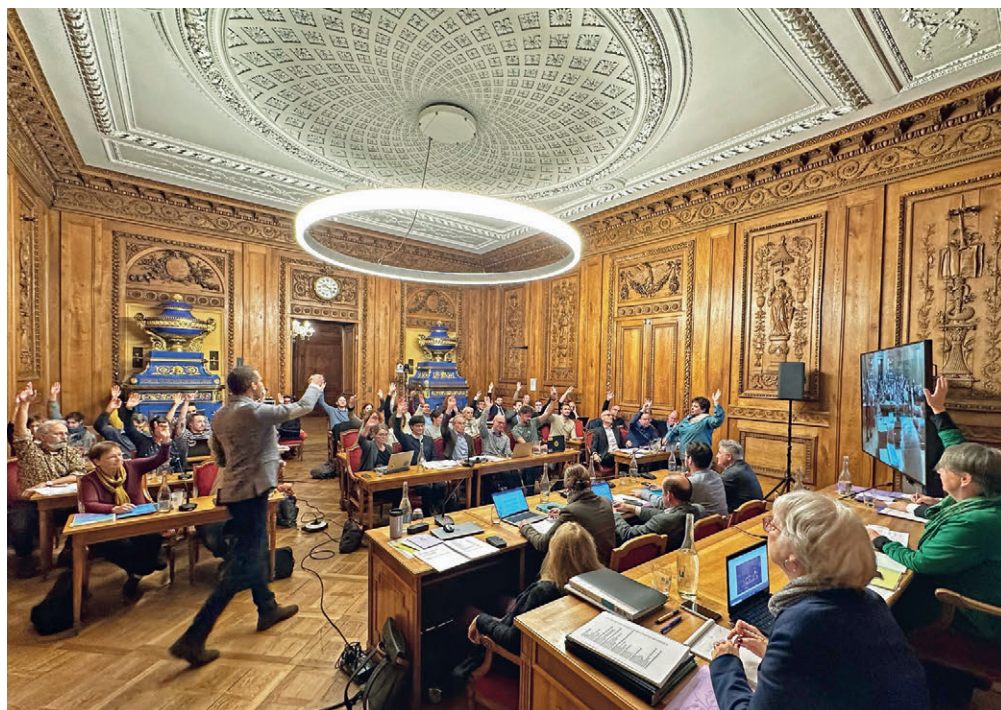
C'est à l'unanimité que le Conseil général a salué les efforts du Conseil communal pour assainir les finances de la Ville.

Avec un excédent de bénéfices de 9 millions de francs, le budget 2024 de la Ville de Neuchâtel est le plus solide de la législature en cours. Tandis que les charges s'élèvent à près de 334,2 millions de francs, les investissements prévus respectent le plafond établi à 50 millions. Le Conseil général l'a adopté lundi soir à l'unanimité.