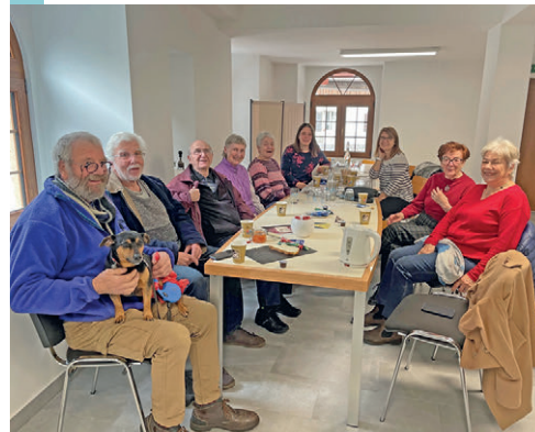
Comme à Valangin, Corcelles-Cormondrèche va accueillir ses aîné-e-s.