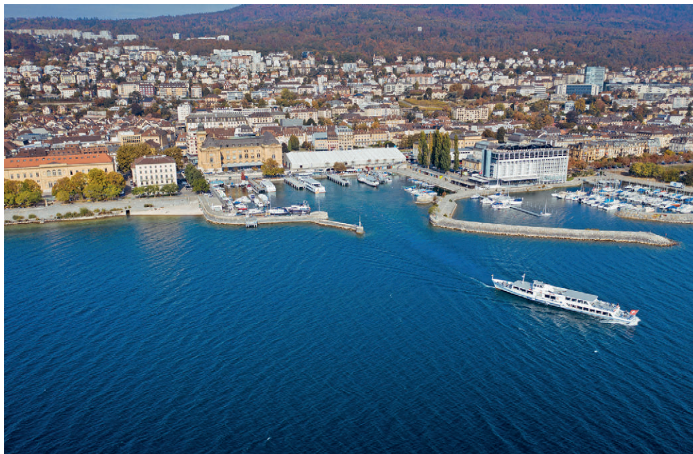
Le groupe Vert-e-s-Pop-Sol en est conscient: «Les années à venir n'auront rien d'une navigation en eaux calmes».

N ous pouvons lire dans les conclusions du rapport du Conseil communal sur le budget 2024: «Construire un budget peut parfois donner la sensation de naviguer sur un lac agité avec des vents passant rapidement de favorables à contraires». C'est une image très parlante pour notre paquebot communal qui a été mis à l'eau en 2021. Après les festivités de l'inauguration, la croisière n s'est pas amusée très longtemps car le Conseil communal a dû rapidement relayer des avis de tempêtes qui avaient pour noms: déficit structurel, aggravation de la dette, degré d'autofinancement devenu largement insuffisant, etc. Des mesures prises en 2022, visant notamment à limiter les investissements annuels à 50 millions de francs, ont déjà eu certains effets permettant de penser que la barre a commencé à être redressée vers un assainissement qui prendra encore une dizaine d'années. Un travail important a aussi été réalisé par l'administration pour terminer l'ouvrage de la fusion ou corriger des défauts de jeunesse. Le paquebot a-t-il maintenant atteint une vitesse de croisière durable et satisfaisante? Croire cela, ce serait oublier que la Ville va devoir faire face à des besoins multiples et urgents comme, par exemple, les adaptations aux perturbations climatiques, la nécessité d'as-