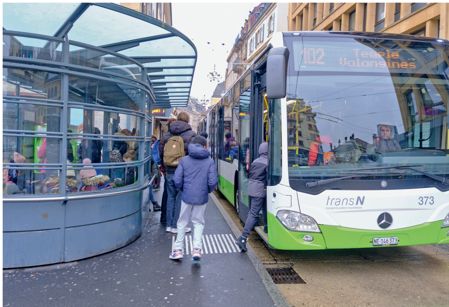
Comme au nord de la gare, le quai d'accès de l'arrêt de bus St-Honoré sera non seulement surélevé, mais également élargi.