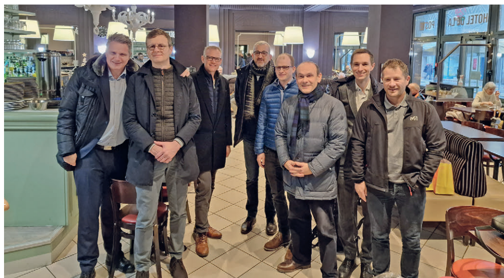
Les membres de la délégation à leur arrivée à Pontarlier.

→ Reportage complet sur www.nci.ch/voyage_inaugural_berne_neuchatel_paris