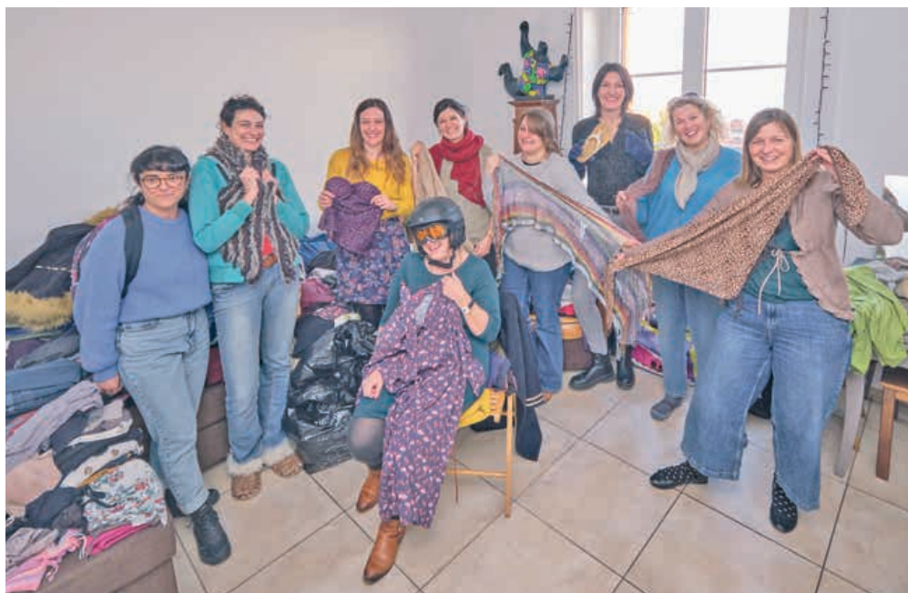
Réunies chez une participante, plus de 30 copines ont échangé habits, chaussures, sacs et livres.

«Le troc est un chouette moment à partager entre copines, bien mieux que les magasins. J'ai horreur de jeter, le troc me permet de transmettre mes habits et leur histoire», explique une participante. Et son amie d'ajouter: «je prends des habits d'un autre style, que je n'aurais pas forcément achetés par moi-même». Il y a parfois des a priori ou des barrières qui empêchent les gens de se lancer dans l'organisation de trocs. «Plusieurs participantes ont peur que leur taille ne corresponde pas aux autres et que leurs habits ne plaisent pas. Et pourtant, les échanges sont toujours très nombreux», insiste Sabine Brechbühl. La bande de copines s'est étoffée au fil des ans et chacune ramène d'autres copines pour faire circuler encore davantage les vêtements. Une idée à partager et à réutiliser! ● AK