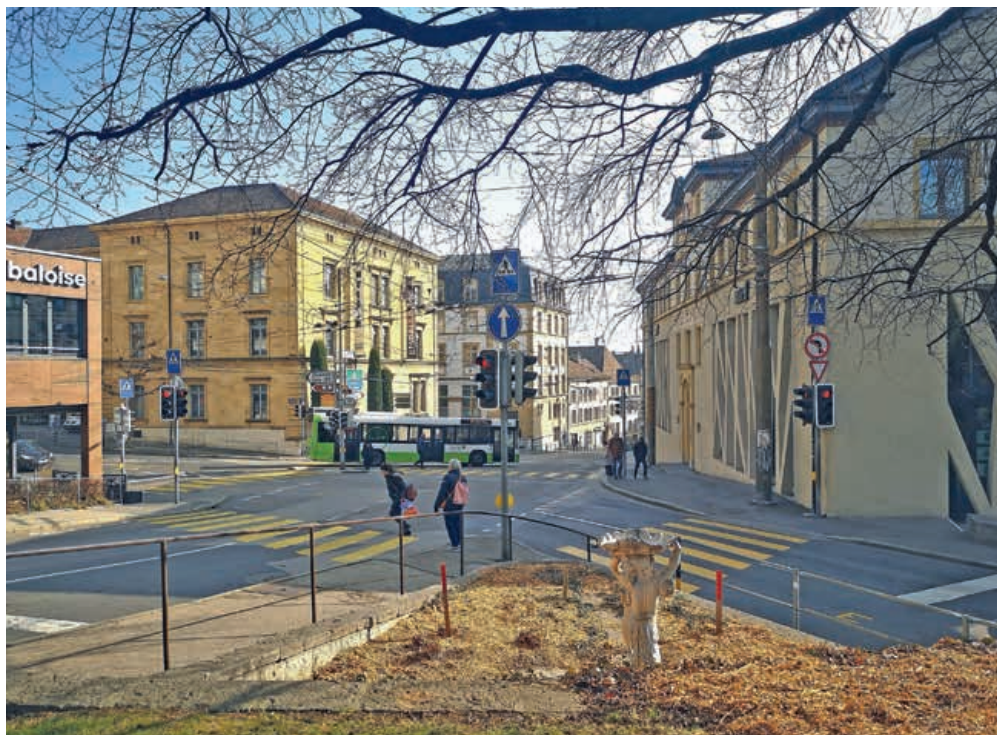
Les riverain-e-s recevront des informations détaillées par courrier.

Les transports publics vont profiter de l'ouverture de ce chantier pour renouveler l'aiguillage des lignes de contact des trolleybus sur ce carrefour. Du 13 mars au 6 avril, des travaux de jour et de nuit auront lieu en semaine, engendrant des nuisances sonores que TransN s'efforcera de limiter pour le bien-être des riverain-e-s.