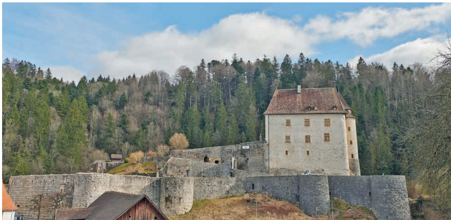
Le Château de Valangin sera l'un des trois points de départ de la Marche du 1 er -Mars et sera ouvert gratuitement toute la journée.

Le 1 er mars, les Neuchâtelois-e-s sont invité-e-s à se réunir à La Vue-des-Alpes pour célébrer les 175 ans de la République. Un lieu symbolique qu'il sera possible de rejoindre à pied depuis Valangin.