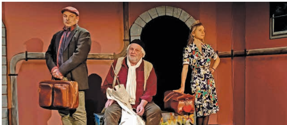
La compagnie C 543 joue Comédie sur un quai de gare de Samuel Benchetrit. SP

→ Cinéma des Arcades Samedi 18 février à 20h. Billetterie: www.timemachine-event.com