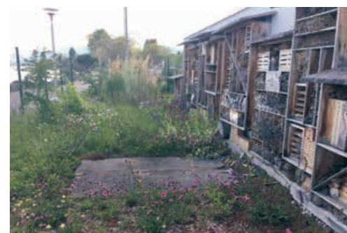
Fleurs, herbes aromatiques et étang font ici le bonheur des insectes.