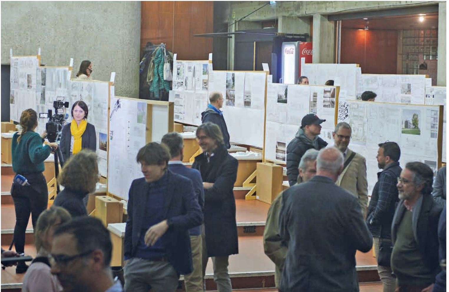
Les 53 projets du concours d'architecture ont été dévoilés lundi soir à la Cité des étudiants, devant une large assemblée. DAVID MARCHON

L'Etat, la Ville et l'Université de Neuchâtel ont dévoilé lundi soir les résultats du concours d'architecture pour le nouveau bâtiment universitaire qui verra le jour sur l'ancien site de Panespo à l'horizon 2028. Intitulé Univers, le projet lauréat a été conçu par le bureau d'architectes zurichois Berrel Kräutler.