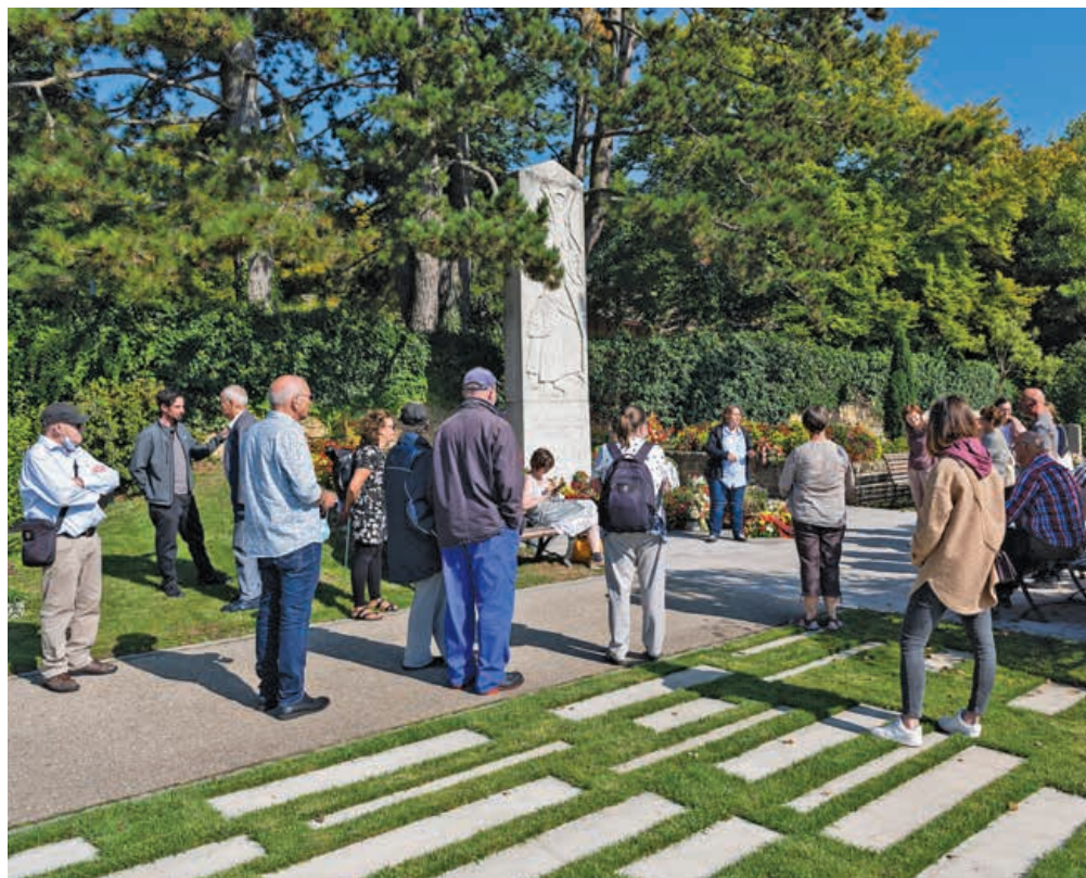
Ces visites sont l'occasion de poser toutes ses questions en lien avec la mort.