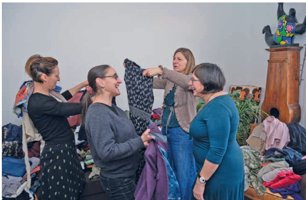
De larges piles de vêtements occupaient le salon, où les participantes cherchaient à dénicher des trésors. Rares sont celles revenues les mains vides!