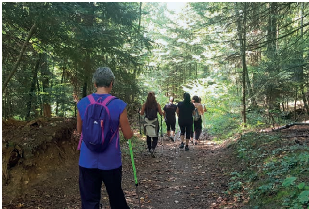
Il est possible de s'évader en forêt le temps d'une session de Midi Tonus.