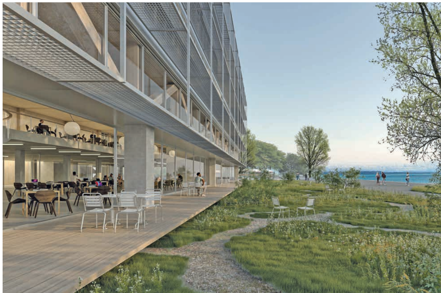
Le projet Univers prévoit la création d'un auditoire de 700 places, d'un learning center et d'une cafétéria à proximité des Jeunes-Rives. BERREL KRÄUTLER ARCHITECTEN AG

→ Exposition des 53 projets du concours: à voir jusqu'au 24 février à La Cité des étudiants, avenue Clos-Brochet 10. Lu au ve, de 16 h à 19 h et sa 18 février, de 14 h à 18 h. Entrée libre.