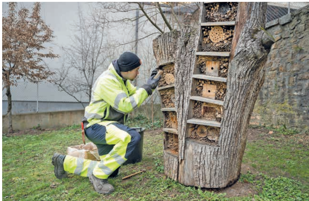
Un collaborateur de l'équipe des Parcs et Promenades installe de nouveaux fagots dans l'hôtel à insectes du jardin Russ à Serrières.

A l'approche du printemps, la nature sort doucement de sa torpeur hivernale. En quête de l'endroit idéal pour préparer leur nid douillet, insectes et petits mammifères vont bientôt se reproduire. Pour les aider, il est possible de fabriquer un hôtel à insectes dans son jardin ou même sur son balcon. Le bureau technique de l'Office des parcs et promenades partage quelques conseils.