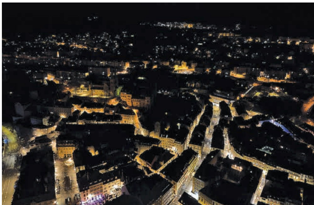
En zone piétonne, vie nocturne et sécurité nécessitent un éclairage sobre.

sensible à la lumière. Dans les quartiers et notamment en lisière de forêt ou à proximité de la Step, où nichent des chauve-souris et volètent de nombreux insectes, la Ville affinera progressivement l'éclairage de sorte à limiter son empreinte nocturne.