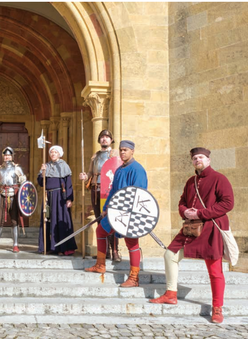
qui compte au total 25 membres.