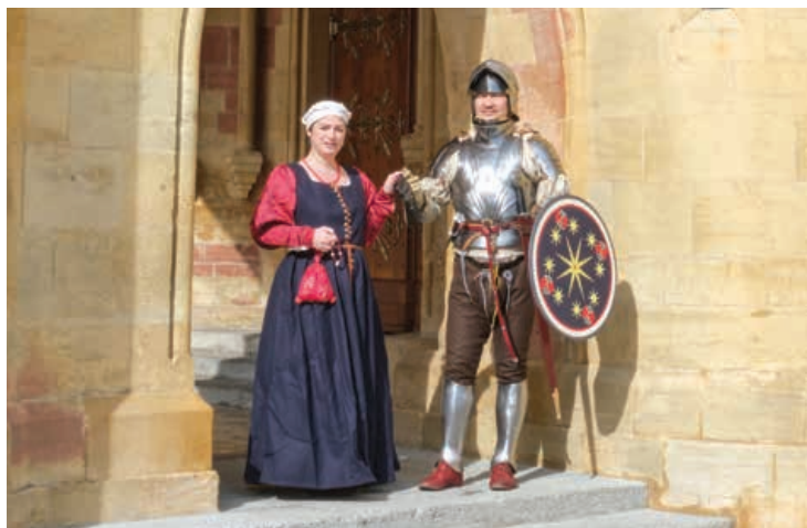
Les femmes n'hésitaient pas à se mêler aux combattants pour repousser un assaut, mais ne faisaient pas partie des soldats.