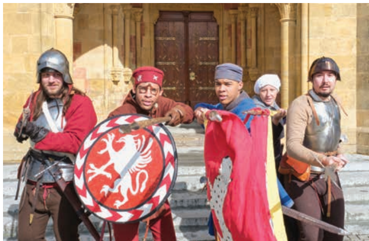
La compagnie des Maciliens représente une troupe de mercenaires des années 1470, juste avant les guerres de Bourgogne.