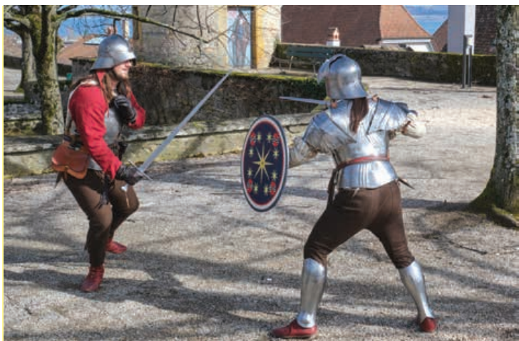
Contrairement aux idées reçues, les épées n'étaient pas si lourdes. Celles-ci pèsent 1,3kg. Pas de quoi effrayer les mercenaires !

L'association de la compagnie des Maciliens invite la population à revivre l'histoire du XV e siècle. Pour marquer ses 10 ans d'existence, elle organise la toute première fête médiévale de Neuchâtel, les samedi 15 et dimanche 16 avril sur l'esplanade de la Collégiale. Intitulée Médié-Neuch, elle proposera notamment des démonstrations de combat et de danses sur des rythmes d'antan. Métamorphosée en campement médiéval, l'esplanade de la Collégiale accueillera pour l'occasion plusieurs stands historiques et de nombreuses compagnies en costumes d'époque. Des artisans d'ici et d'ailleurs dévoileront leurs produits à proximité des lousps. Les plus téméraires auront la possibilité de s'essayer à l'épée, tandis que les plus petits découvriront l'arsenal et ses trésors. Une occasion unique de voir et toucher des pièces d'une grande valeur patrimoniale. « Nous participons chaque année à de nombreuses fêtes médiévales notamment en Gruyère et au château de Chillon ainsi que pour des engagements privés. Comme rien n'existait à Neuchâtel, on a eu envie de mettre en avant l'histoire médiévale ainsi que le site de la Collégiale », précise le président. Sur place, il sera aussi possible de goûter des mets et des breuvages, inspirés de recettes d'époque. Entrée libre et badges de soutien. Infos www.neuchatelmedieval.ch