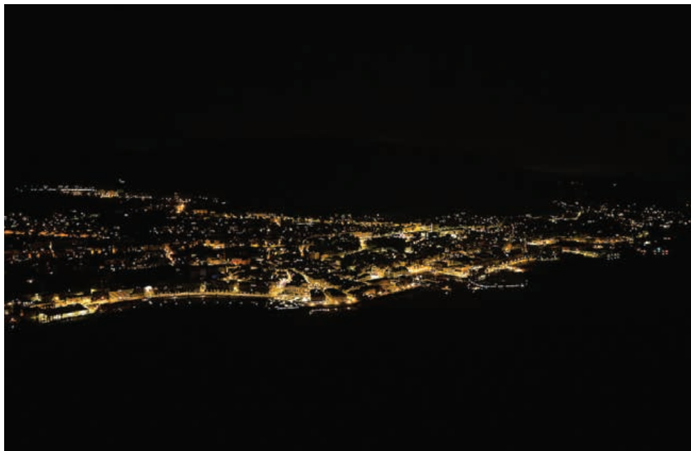
Centre-ville allumé, quartiers éteints: une vue de la ville à 1 heure, prise à 500 mètres d'altitude.

L'autre objectif affiché de toutes ces mesures, sur le long terme, c'est la préservation de la biodiversité, notamment la faune nocturne, très