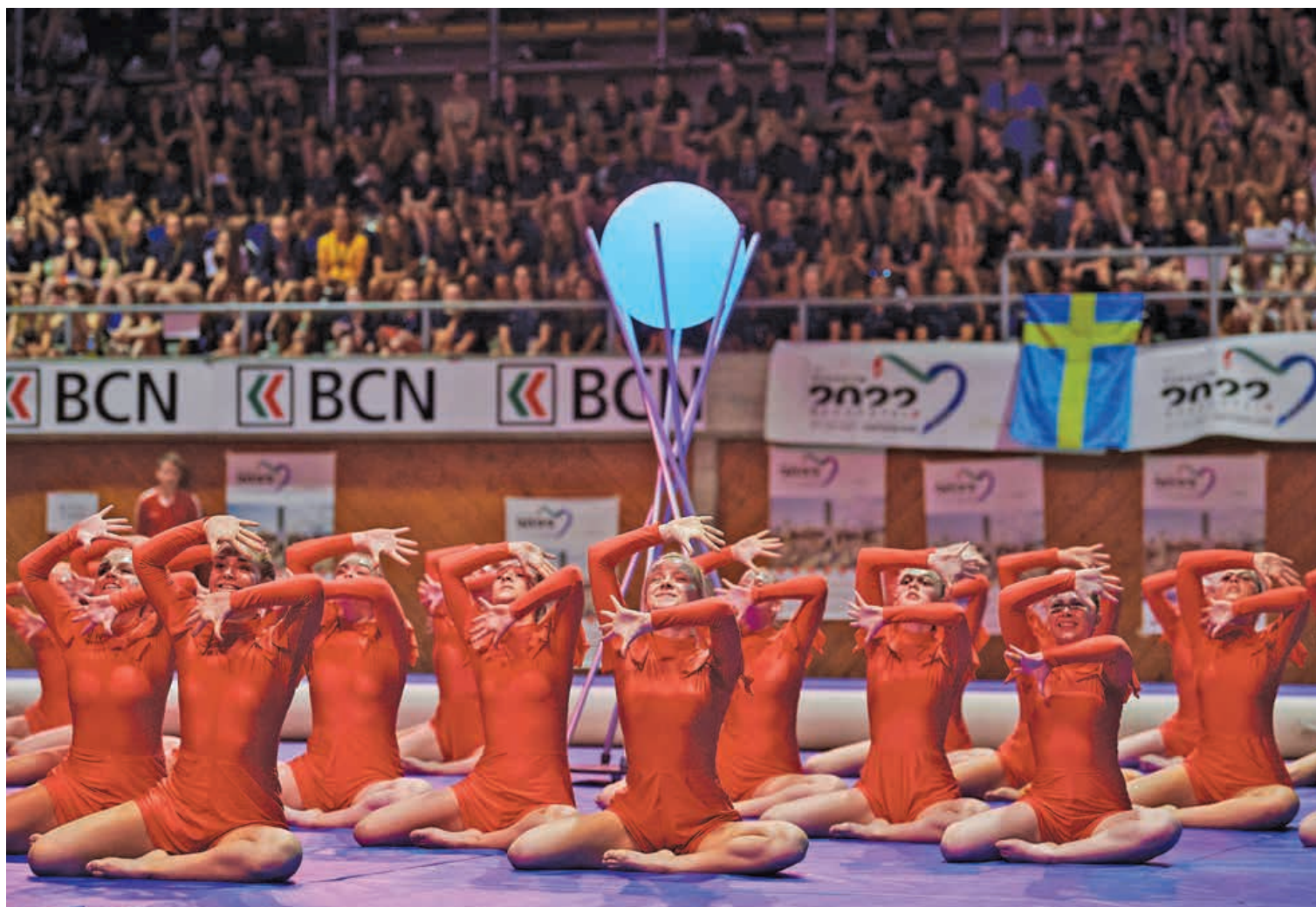
Tout au long de l’Eurogym, les 3000 gymnastes ont livré des performances de haut vol. Ici lors du gala de clôture aux patinoires du Littoral. DAVID MARCHON

Je connais davantage le dojo du club que la ville, mais j’ai toujours beaucoup apprécié le lac. Et j’aime m’y balader avec ma camarade de club Désirée Gabrielle. Je participerai d’ailleurs en septembre à un tournoi en équipe avec le club. ● AK