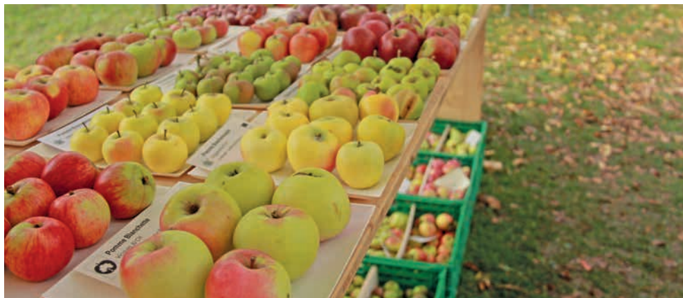
À la découverte des fruits d'antan au verger de Pierre-à-Bot.

→ Under Boc - Tous ensemble. Rue de la Promenade-Noire 3. Programme et billetterie: www.bocneuchatel.ch