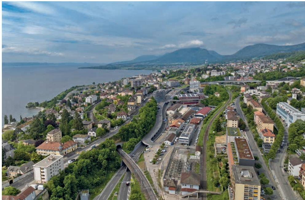
Le groupe PLR salue le projet de territoire mais émet quelques réserves, notamment en termes de mobilité.

Un magnifique projet de territoire, avec un grand Mais... Dans ce projet de territoire, la mobilité est un point crucial pour le développement économique et le soutien à la domiciliation, cependant, l'automobiliste sera pénalisé. Le développement des PME et des artisans est fortement soutenu à l'échelle de la ville qui n'a pourtant pas prévu de grandes zones de développement économique. Les déplacements des employés entraîneront également des flux importants de trafic qui auront des impacts sur le trafic déjà existant et les zones de stationnement. De plus, une connexion de transports publics aux P+R existants ou à venir doit être mise en place. Mais à nouveau le groupe PLR