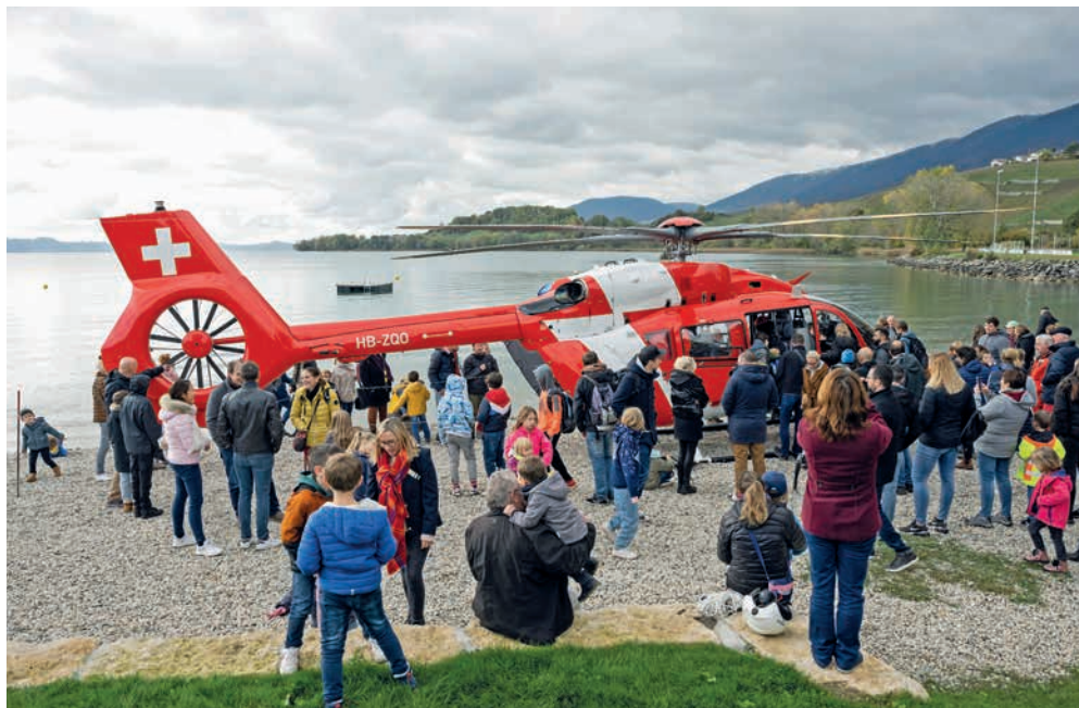
Entre ses missions de sauvetage, l'hélicoptère de la Rega viendra comme l'an dernier se poser à la plage du Petit-Cortailod. Un moment très attendu des petits et grands enfants!