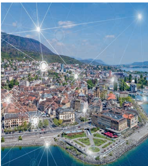
Plusieurs tables rondes sont au programme, sur le thème du numérique responsable.

L'écosystème suisse de l'innovation sera réuni le 31 octobre à Neuchâtel: la 10 e édition du Smart City Day permettra échanges, débats et tables rondes autour du thème «Ville agile, ville responsable».