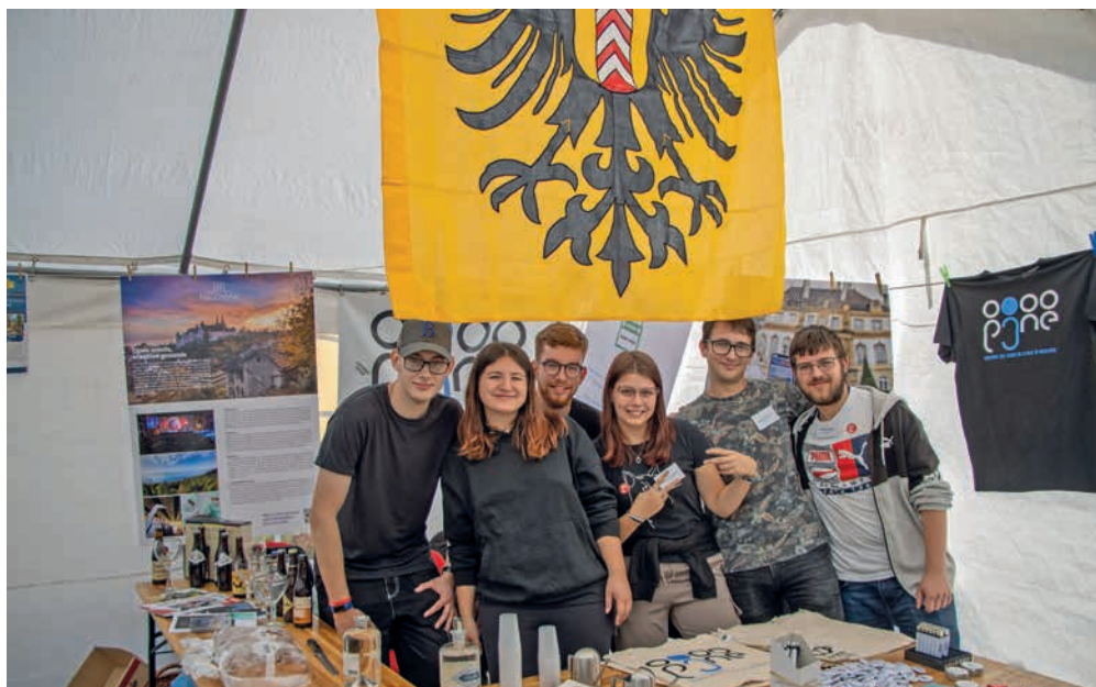
Les membres du Parlement des Jeunes présentent leurs activités sur le stand de la Ville de Neuchâtel, au marché du samedi ouvert au public.