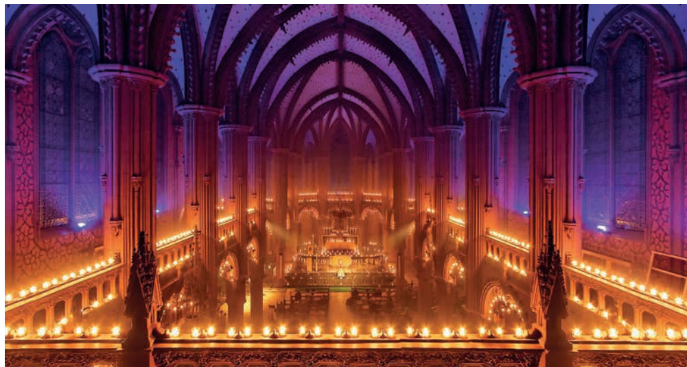
L'artiste Renato Häusler avait illuminé l'Eglise rouge pendant les festivités du millénaire.

A l'occasion de la Toussaint, mais aussi pour les 100 ans du crématoire de Beauregard, l'Office des cimetières de la Ville invite la population à un spectacle aux chandelles mis en scène par Renato Häusler. Rendez-vous par tous les temps devant la chapelle ce samedi dès 19 heures.