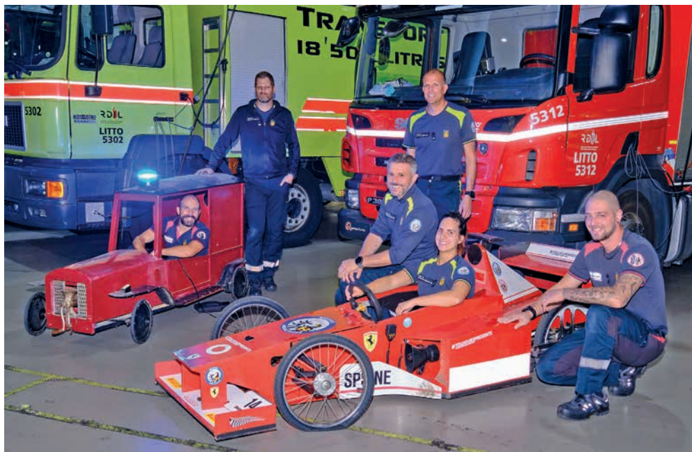
Des pompiers et ambulanciers du SPS au volant de leurs caisses à savon de compétition.

La Corta'Blue Race a pour but de sensibiliser la population à la santé masculine, dans le cadre de la campagne Movember. Et cette année, pour favoriser l'égalité, l'événement soutiendra également la campagne Octobre rose, qui lutte contre le cancer du sein chez les femmes. Les bénéfices de la course seront reversés en faveur des deux associations. Par ailleurs, l'association de prévention du cancer des testicules Having a Ball tiendra un stand et participera à la course pour faire connaître ses activités. L'association sera aussi au centre-ville samedi 4 novembre pour tenir un stand d'information près de la fontaine de la Justice. ● AK