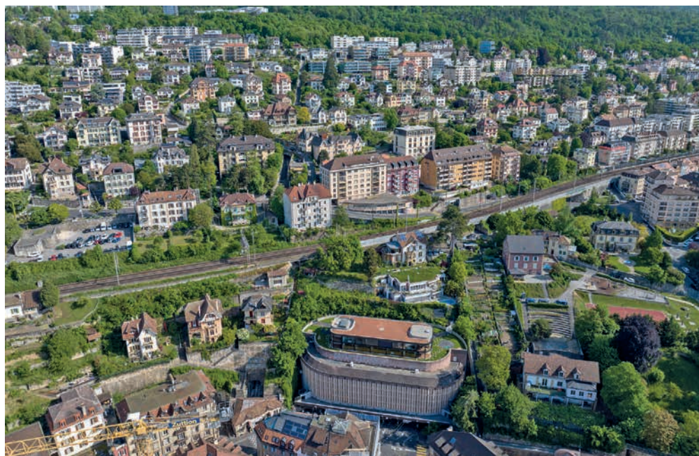
Avec son Projet de territoire, la Ville affiche ses ambitions pour les 20 prochaines années. VISTADRONE

C'est à un travail d'équilibre que s'est voué le Conseil communal pour présenter son Projet de territoire ! Approuvé par le Conseil général, il marque un signal politique fort dans la présente législature, sans effacer pour autant le travail déjà mené dans les anciennes communes de la fusion. La tâche était ardue, tous les services communaux ont été impliqués pour relever le défi.