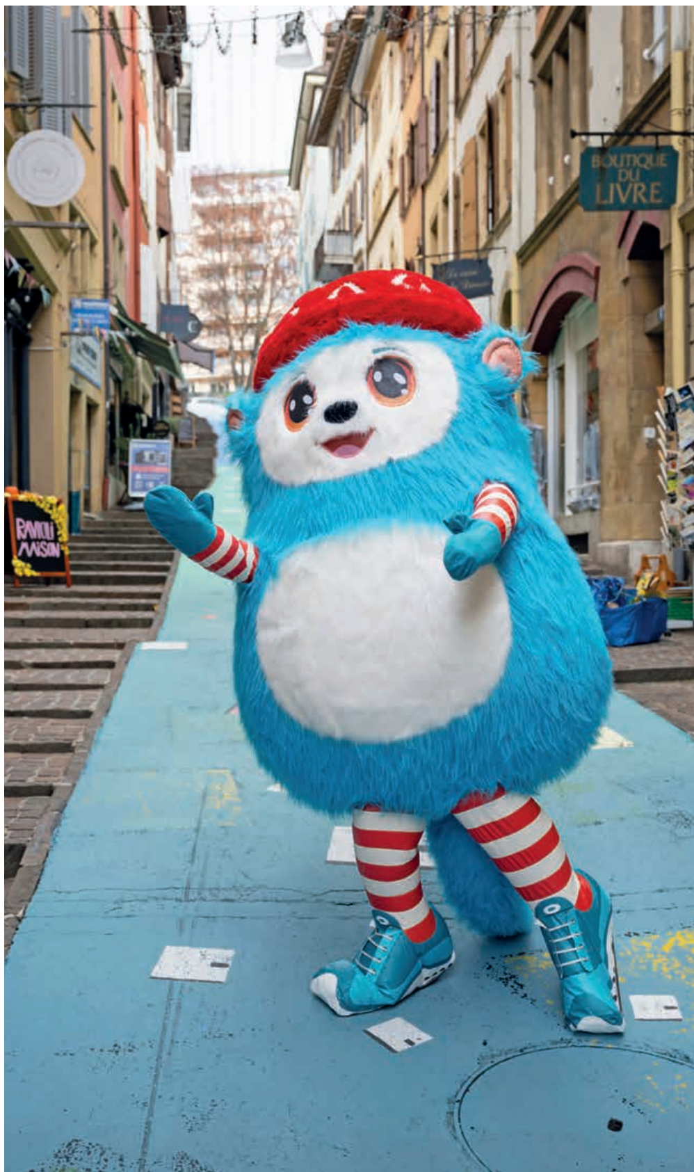
Dessinée par l'illustratrice neuchâteloise Céline Simoni, la mascotte de la Corrida Raffeisen prendra la pose et courra lors de la parade des Mères et Pères Noël. LUCAS VUITEL

→ Inscriptions sur www.corrida-raffeisen.ch et le jour même sur place dès 16 h.