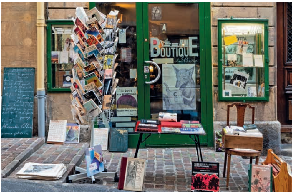
La Boutique du livre reste ouverte du lundi au vendredi de 10h à 18h et le samedi de 9h à 17h. DAVID PERRIARD