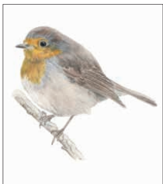
ILLUSTRATION: FABIENNE BERTSCHINGER

Les plantes sensibles au gel sont réunies dans l'orangerie qui prend un aspect luxuriant. Pour vous réchauffer, changer un peu d'air et admirer des plantes en pleine végétation, les serres et l'orangerie vous accueillent tous les jours de 12h à 16h. A bientôt au Jardin botanique! ●