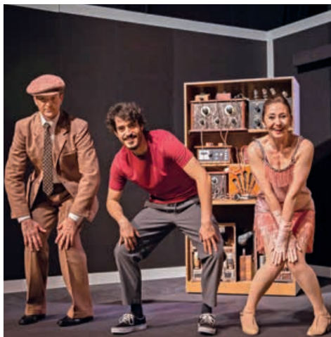
Une jeune dame de 100 ans à voir en tournée.

La RTS sillonne la Suisse romande avec son spectacle qui retrace avec humour et émotions les 100 ans de la radio en Suisse. Mise en scène par Mélisende Navarre, la pièce a été écrite par Christine Pompéi, autrice des romans pour enfants Les Enquêtes de Maëlys.