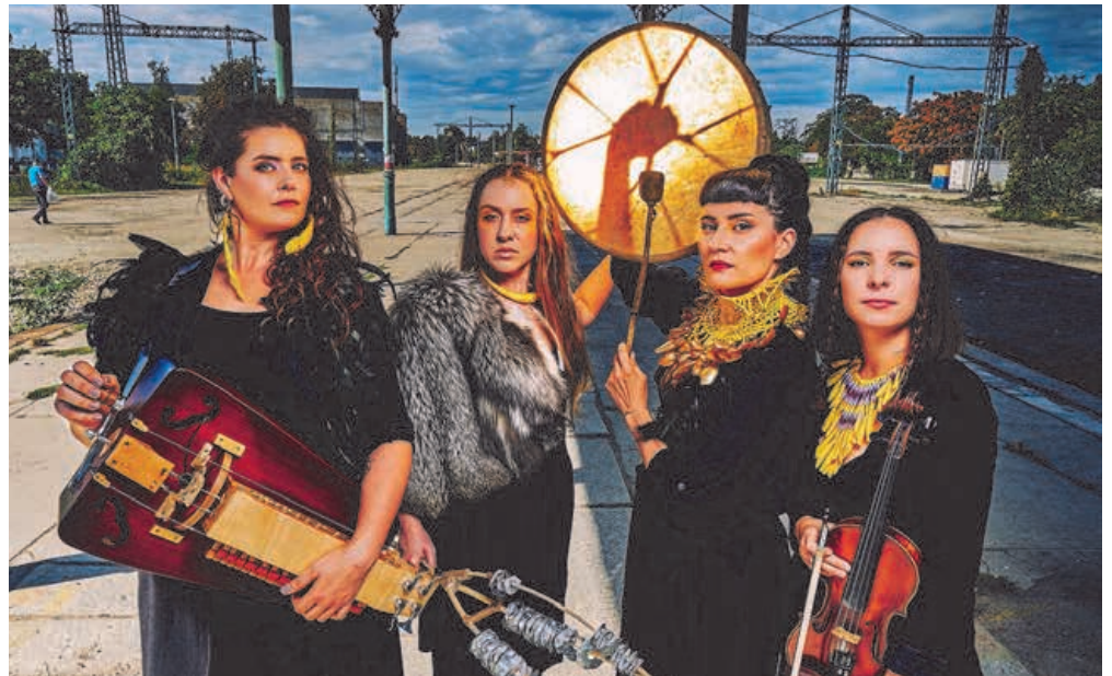
Kozy, quatre voix venues de Pologne qui revisitent les chants de leurs ancêtres.