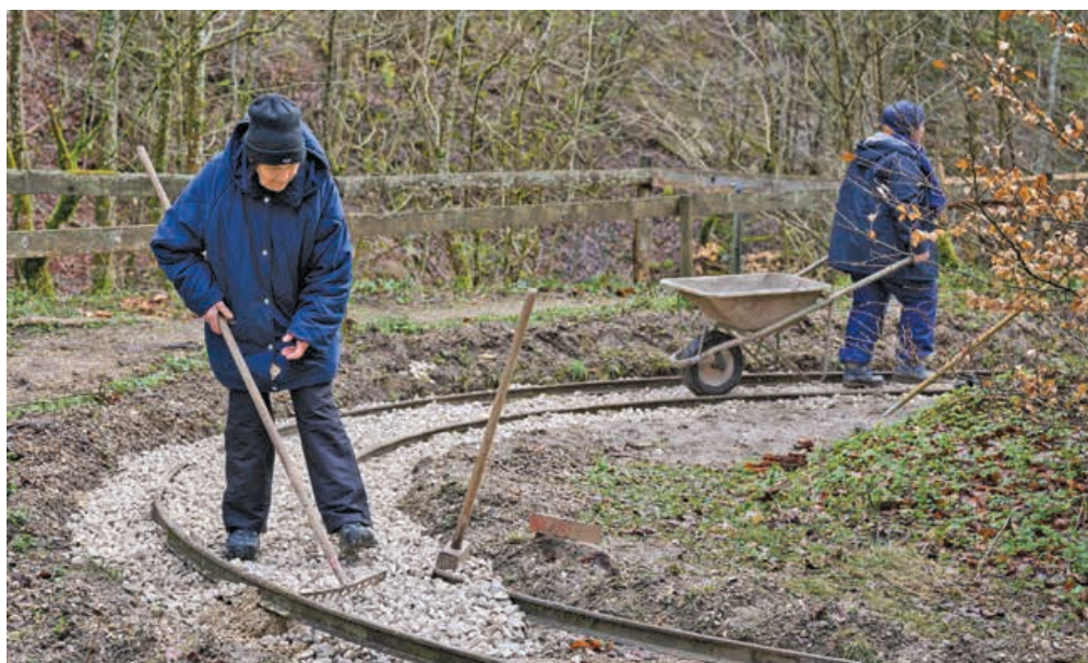
Malgré la forte pluie de samedi, les bénévoles du P'tit train n'ont pas ménagé leurs efforts pour aménager le circuit en vue de la chasse aux œufs.