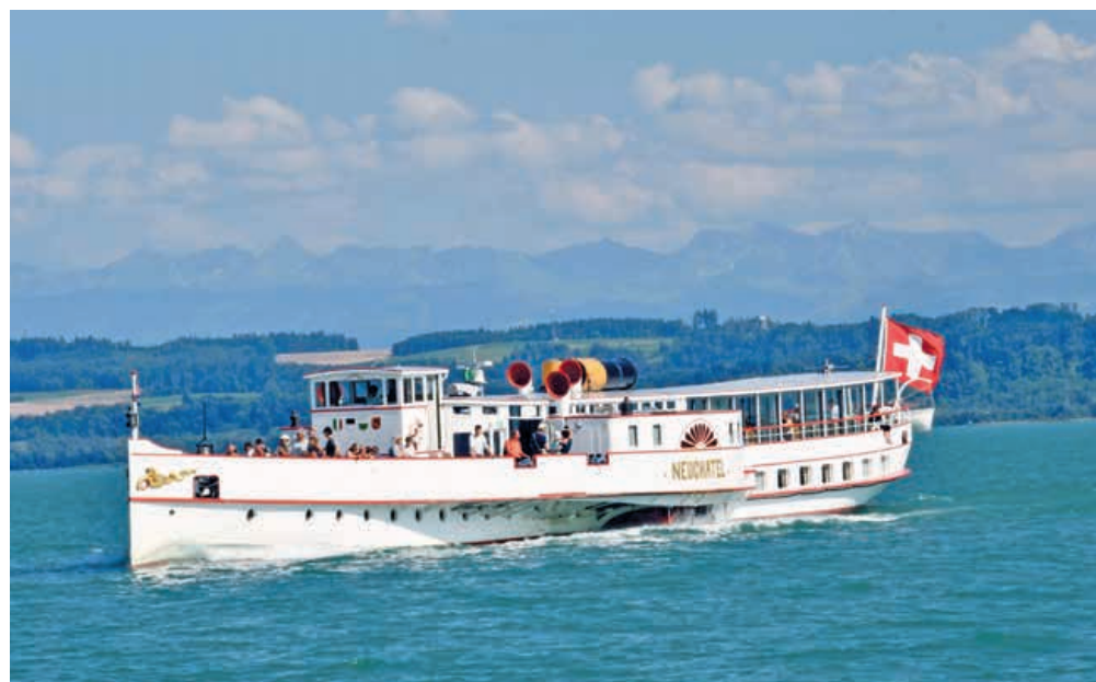
La navigation reprend dès vendredi mais il faudra patienter jusqu'à l'ouverture de la haute saison le 13 mai pour embarquer à bord de l'émblématique vapeur Neuchâtel . FRANÇOIS DUCOMMUN