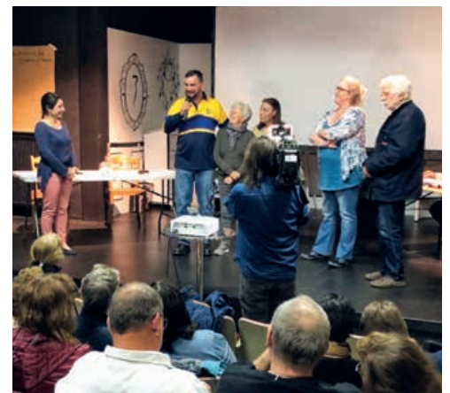
Les membres du bureau ont accepté leur mandat, à l'issue d'une assemblée très médiatisée.

Six assemblées citoyennes seront encore réunies en mai et en juin sur le territoire communal, également constitutives. Celle de Corcelles-Cormondrèche est agendée au 2 mai et celle de Peseux le 10 mai. Tous les habitant-e-s concernés recevront un courrier postal pour les informer des détails pratiques. A Valangin, la prochaine assemblée aura lieu le 6 septembre. ●