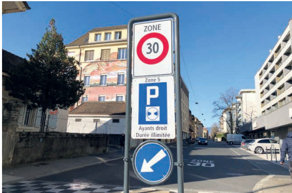
En 2023, plusieurs axes passeront à 30 km/h comme la rue des Parcs et le centre de Valangin.

Le Conseil général a approuvé lundi soir une enveloppe de 3,9 millions de francs pour le programme 2023 d'entretien et de renouvellement des infrastructures sur le domaine public communal. Compte tenu de la capacité d'autofinancement de la Ville, la mouture a été réduite au strict minimum.