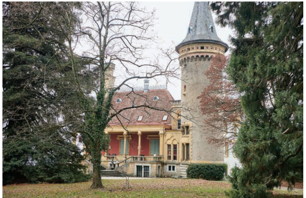
Une 10 e saison de concerts s'ouvre au Château de Cormondrèche.

→ Programme et réservations: www.chateau-cormondreche.ch