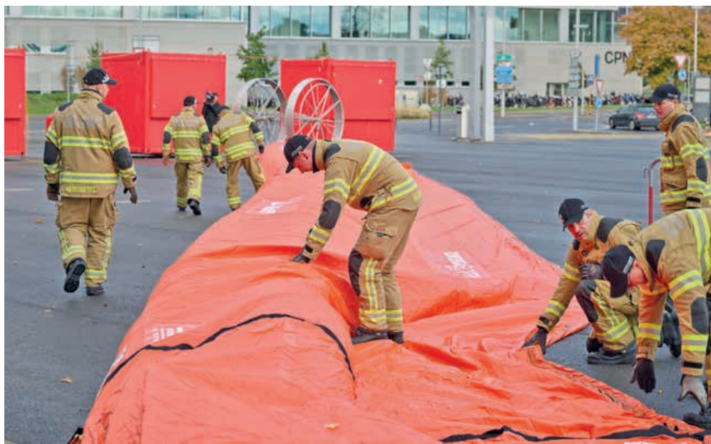
Les sapeurs-pompiers ont déployé et gonflé une partie de la bâche géante. L'opération n'a duré qu'une dizaine de minutes.

Neuchâtel fait partie des 15 villes de Suisse à être désormais dotée d'une digue mobile. Les lieux n'ont pas été choisis au hasard. Le Laboratoire Mobilière de recherche sur les risques naturels de l'Université de Berne a identifié les communes particulièrement exposées aux risques d'inondation et présentant un potentiel de dommages élevé. Le site https://potentiieldedommages.risquedecrues.ch donne à voir, dans tout le pays, les zones particulièrement exposées. ● EG