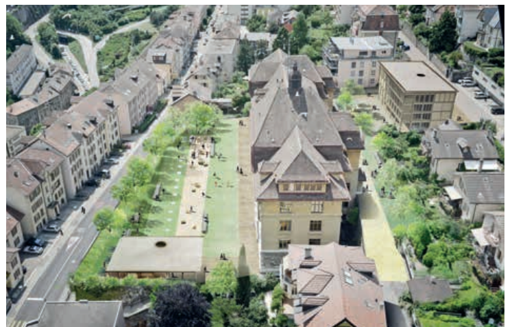
Une vue de synthèse du collège des Parcs avec sa future annexe et son préau végétalisé, conçue par Stoa architectes.