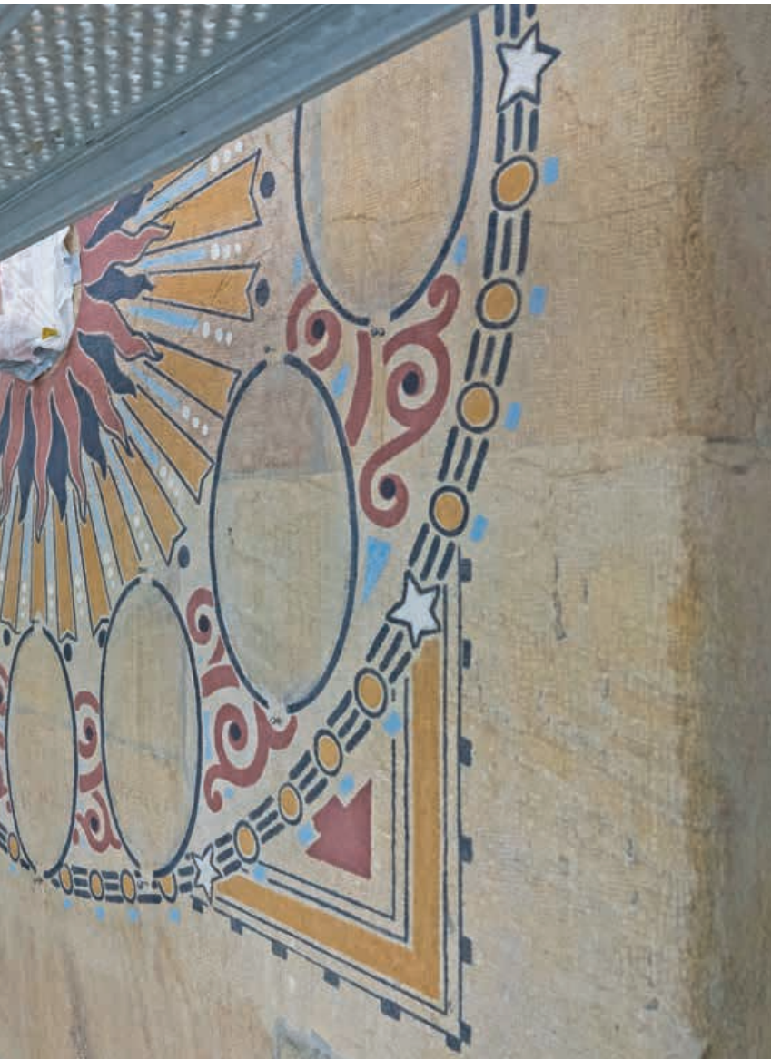
Peintures murales, qui ont été entièrement restaurées.