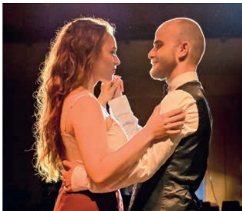
La troupe à l'origine du JukeBox jouera cette année une intrigue policière.

Des concerts, du stand-up, une battle de break, une pièce de théâtre et un conte musical pour les tout-petits: le JukeBox Café Festival se tient ce week-end à la salle de spectacle de Peseux.