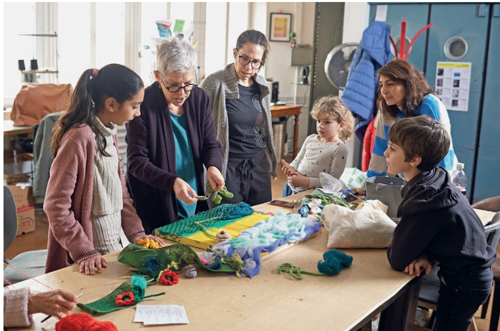
Atelier couture et tricot à Sens'Egaut pour deux familles du quartier de la Côte. DAVID MARCHON