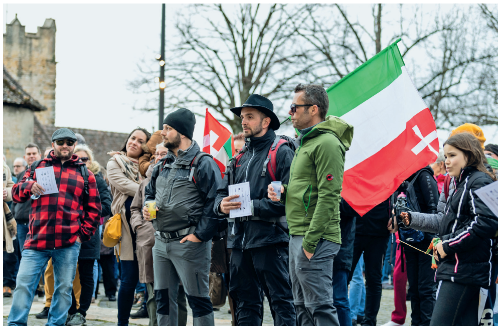
Rendez-vous vendredi 1 er mars dès 15h30 sur l'esplanade de la Collégiale pour fêter la République neuchâteloise!

Après le départ du Locle, se tiendront de nombreuses animations à La Chaux-de-Fonds avec une fanfare, notamment. «Le statut de commune