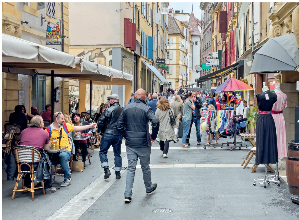
Les acteurs du centre-ville œuvrent pour animer le cœur de Neuchâtel.

Le Conseil général a approuvé l'introduction d'une nouvelle disposition qui modifie le règlement d'aménagement, anticipant la révision du futur Plan d'aménagement local (PAL). Il s'agit d'une obligation de valorisation des rez-de-chaussée au centre-ville, afin de soutenir activement les acteurs commerciaux.