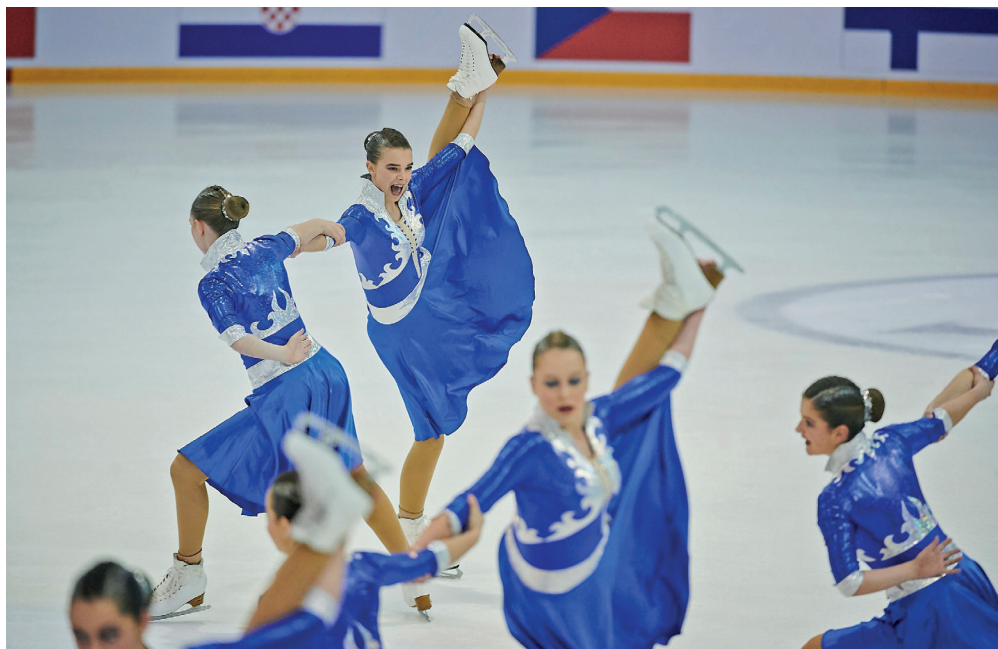
Comme en 2019, le Club des patineurs de Neuchâtel-Sports s'est vu attribuer l'organisation des Mondiaux juniors de patinage synchronisé.