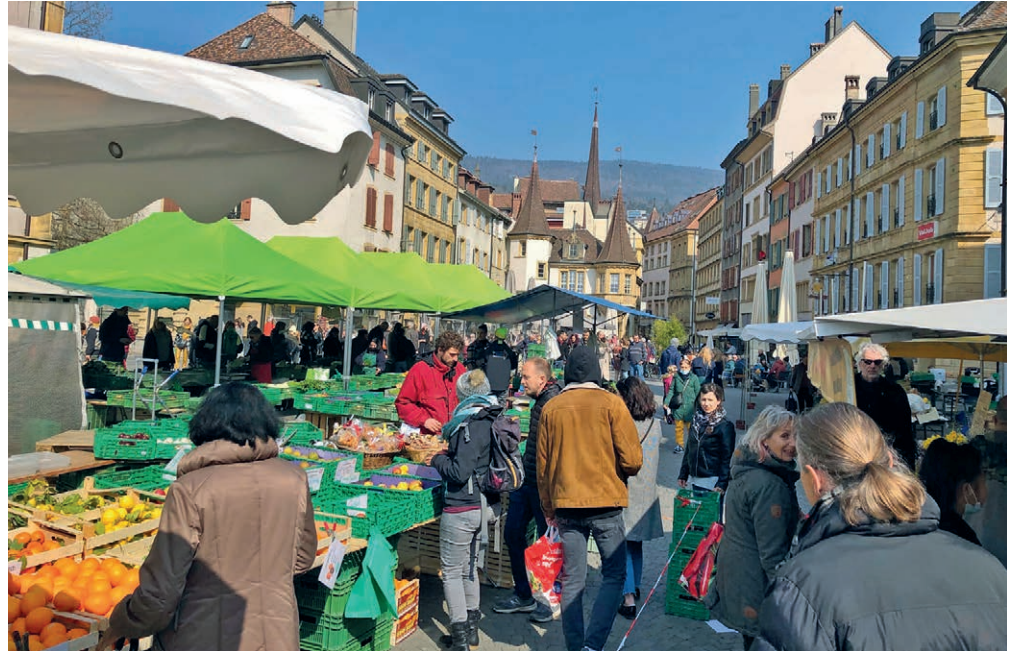
Le groupe PLR soutient des mesures telles que les Jeudis Oui, l'expansion des terrasses ou le développement des marchés.

L'innovation dans les centres-villes est considérée comme essentielle pour répondre aux nouveaux modes de consommation, en offrant une diversité de commerces et de services adaptés aux besoins des consommateurs actuels et futurs.