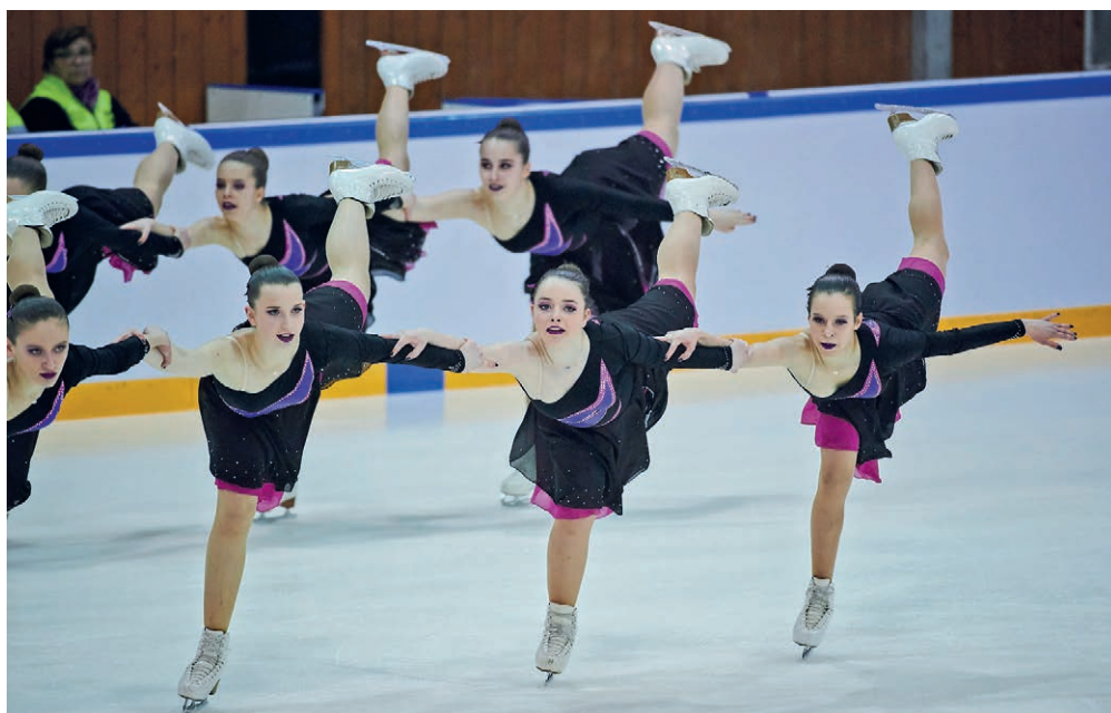
Plus de 500 patineuses déferleront sur la ville de Neuchâtel durant la semaine du 11 mars prochain.