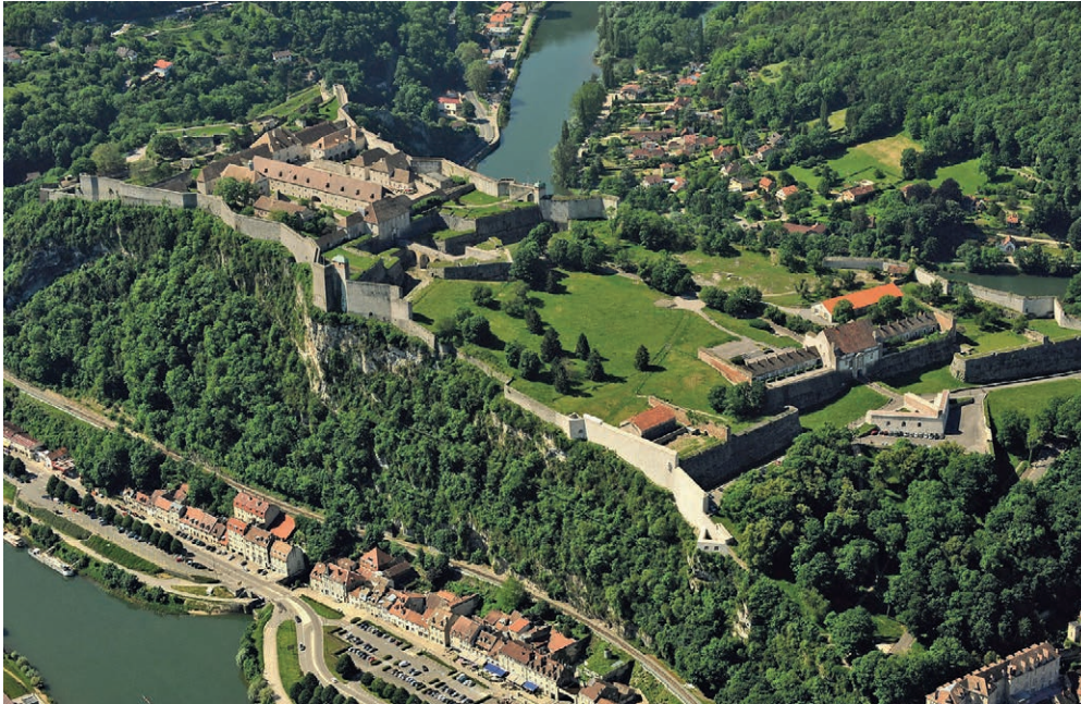
Musées, jardins et animaux ont remplacé la troupe sur les hauts de Besançon. DAVID LEFRANC

Le Petit prince peut-il nous enseigner à mieux préserver notre planète? Haut lieu de culture et de mémoire, la Citadelle de Besançon prépare une «exposition parcours» à partir du 13 avril prochain sur le thème Dessine-moi ta planète . L'entrée est gratuite pour les Neuchâtelois!