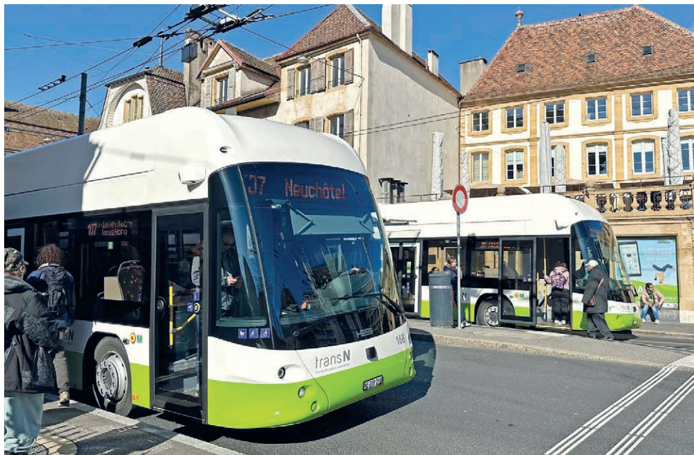
Pour le groupe socialiste, la gratuité des transports publics pour les seniors les plus vulnérables est un devoir.

Pour les 1257 personnes au bénéfice de prestations complémentaires (PC), il s'agit donc de déboursier près de 400 francs, une sacrée somme pour qui vit déjà au seuil de la pauvreté. Pourtant, l'impact financier d'une gratuité totale pour cette catégorie de la population serait supportable par la collectivité: entre 104'000 fr. et 280'000 fr. par an. C'est peu en regard du bénéfice social pour des personnes dont les revenus AVS/AI/2 e pilier ne suffisent pas à couvrir les besoins vitaux. Et parmi eux, évidemment, de nombreuses femmes. Inacceptable pour le PS! Nous maintenons que la gratuité pour cette catégorie de la population vulnérable est un devoir, et nous avons déposé un arrêté pour nous permettre d'introduire cette mesure dès 2025.