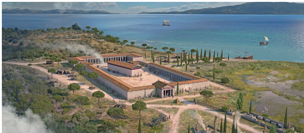
La découverte du temple d'Artémis a fait l'objet d'un documentaire passionnant. CLIMAGE

→ Centre d'art Neuchâtel , rue des Moulins 37. Vernissage ve 16 février à 18h. Jusqu'au 16 avril, de me à di de 11h à 18h.