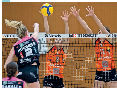
Le NUC affrontera Lugano en finale de Coupe de Suisse. LUCAS VUITEL