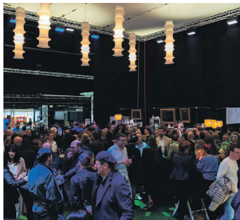
La «Place du village» accueille réunions et conférences.

Le Salon de l'immobilier neuchâtelois est de retour aux Patinoires du 17 au 21 avril. Une centaine de stands proposeront produits, services et conseils pour aménager son doux foyer.