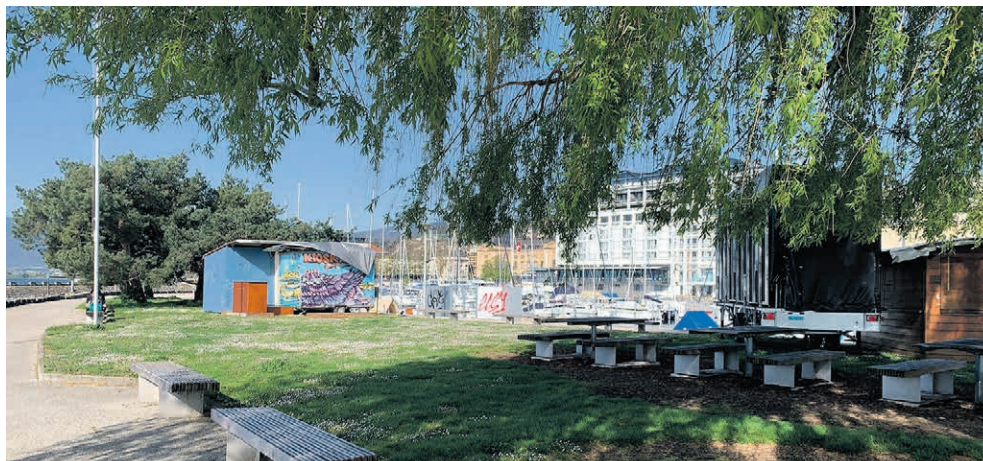
La scène du Kiosk-Art accueillera ses premiers concerts ce week-end.

→ Collégiale de Valangin Dimanche 21 avril à 17h Entrée libre, collecte