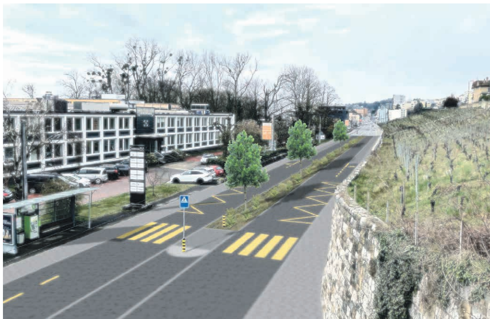
Une bande végétalisée et arborisée est prévue au milieu de la route. MAULIER SA

La redistribution du gabarit de la chaussée permettra notamment de sécuriser les chemins piétonniers sur l'ensemble du tracé par la création de trottoirs traversants à chaque dé-