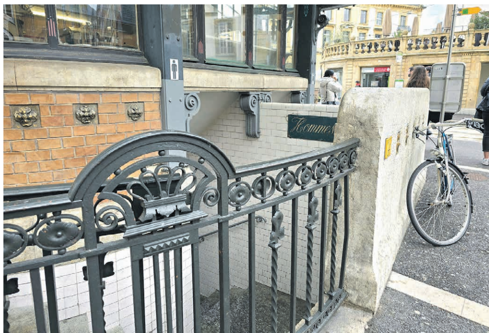
Les WC du kiosque de la place Pury seront prochainement rénovés. Ceux du sous-voie vers l'esplanade du Mont-Blanc l'ont déjà été.

«Tenir son chien en laisse du 15 avril au 30 juin en forêt est le seul moyen sûr d'empêcher les dérangements ou les dommages causés à la faune sauvage», poursuit le SFFN, qui invite donc les détenteurs à respecter cette règle simple inscrite dans la loi cantonale sur la faune sauvage. En restant sur les chemins et en tenant son chien en laisse, le détenteur limite les dérangements et participe ainsi à la conservation des espèces sur le long terme. ●