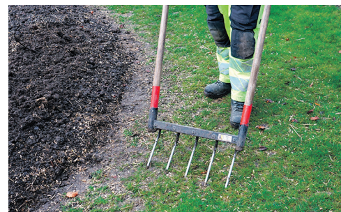
Les dents plantées dans la terre, la grelinette ameublir le sol en préservant l'équilibre du sol.