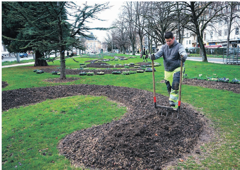
Au Jardin anglais, les équipes des Parcs et Promenades utilisent la grelinette pour rendre le sol propice à accueillir de nouvelles plantes.

Le printemps est de retour, et avec lui, les splendides massifs floraux aux couleurs vives qui ornent la ville. Pour préserver le sol et la vie sous terre, l'Office des parcs et promenades mise sur un entretien qui favorise la biodiversité. Les équipes préfèrent la grelinette au motoculteur.