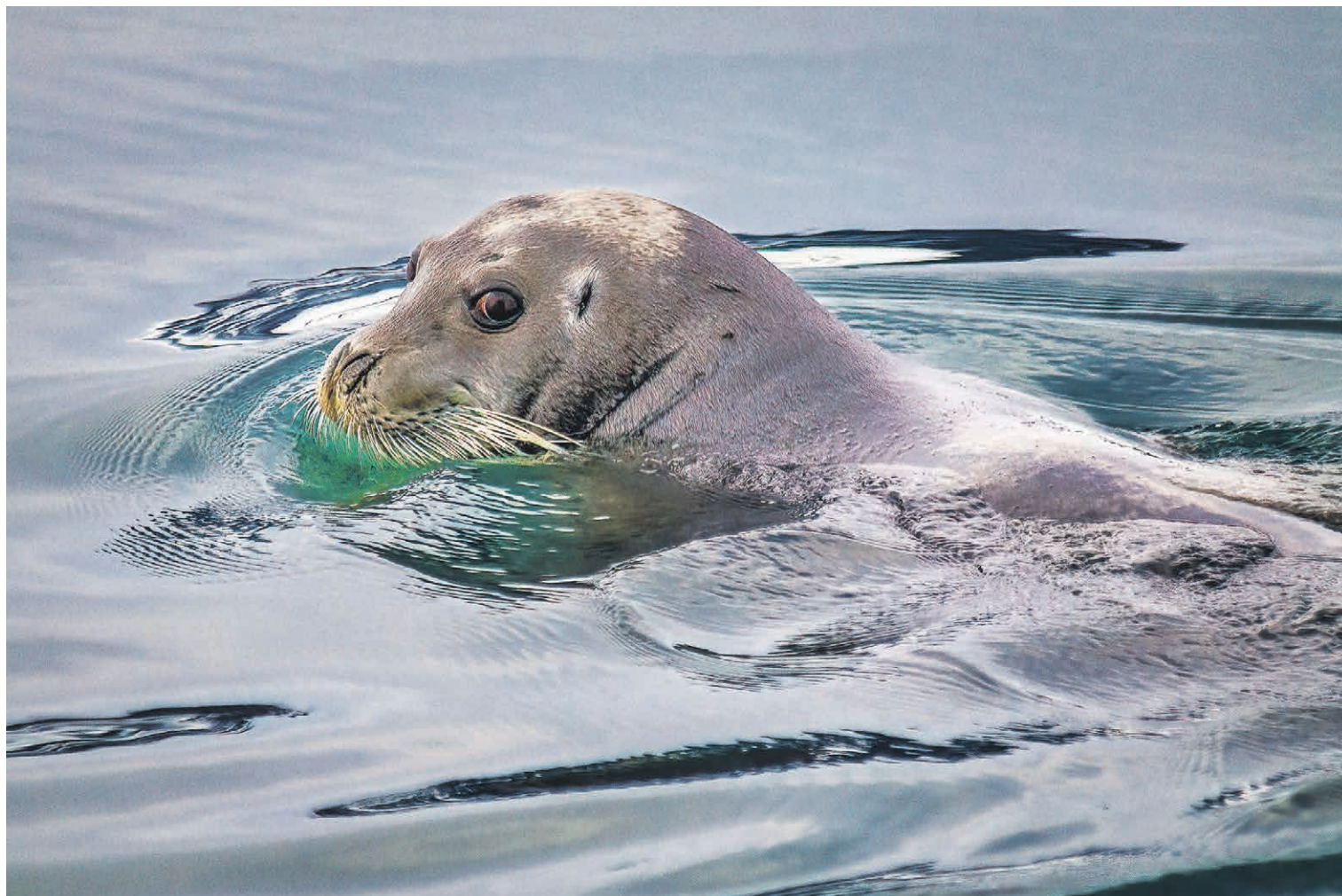
Un phoque barbu dans les eaux de l'archipel du Svalbard. Cette photo est à voir dans le cadre de l'exposition «L'Europe sauvage».