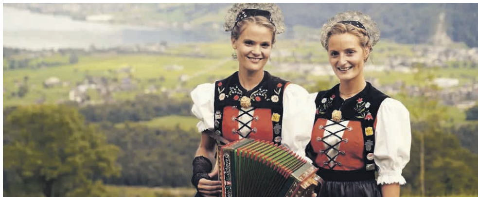
Parmi les 13 concerts à l'affiche, les sœurs Monney feront souffler un vent frais sur le yodel. ANJA KISER

→ Corcelles, salle des spectacles Dimanche 28 avril à 17h Entrée libre, collecte www.echoduvignoble.ch