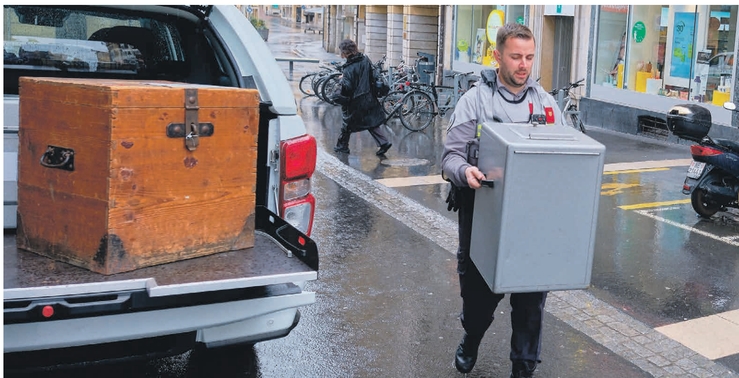
Le transport des urnes, dimanche en fin de matinée, provenant des bureaux de vote de Corcelles-Cormondrèche, Peseux et Valangin.

Les élections communales de ce dimanche ont dessiné le visage du Conseil général pour la législature 2024-2028. Il restera majoritairement à gauche. Au Conseil communal, aucun candidat n'ayant été élu au premier tour, c'est le 12 mai que les membres de l'exécutif seront connus. Huit candidat-e-s, sur quatre listes, sont désormais en lice. Une nouvelle campagne commence. Nos explications. → PAGES 2 À 5