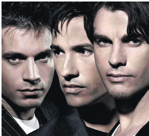
Les Worlds Apart seront à la Night.

Plus de 20 artistes des années 1980 à 2000 se produiront samedi 27 avril aux Patinoires du Littoral, à l'occasion de la Night, volume 3. Ambiance rétro, paillettes et un brin nostalgique au programme !