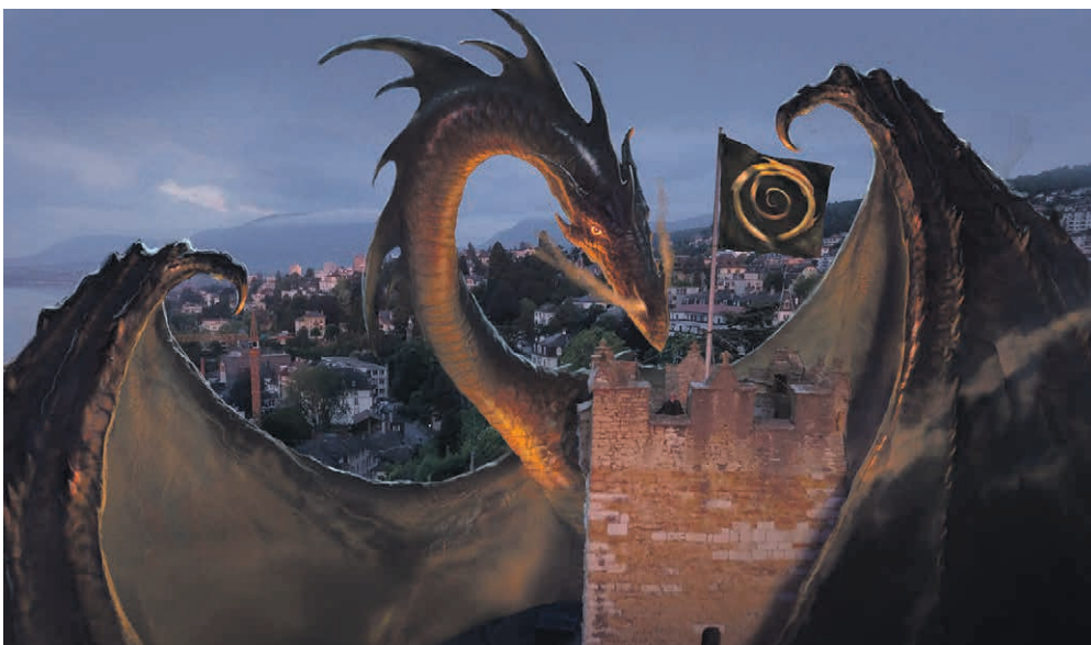
Le projet va de l'avant dans les anciennes prisons de la ville. VISUEL JOHN HOWE

Ainsi, vous bénéficierez d'un beau jardin et profiterez pleinement de vos grillades et torréfactions sans le désagrément des fumées pour vous et vos voisins. ●