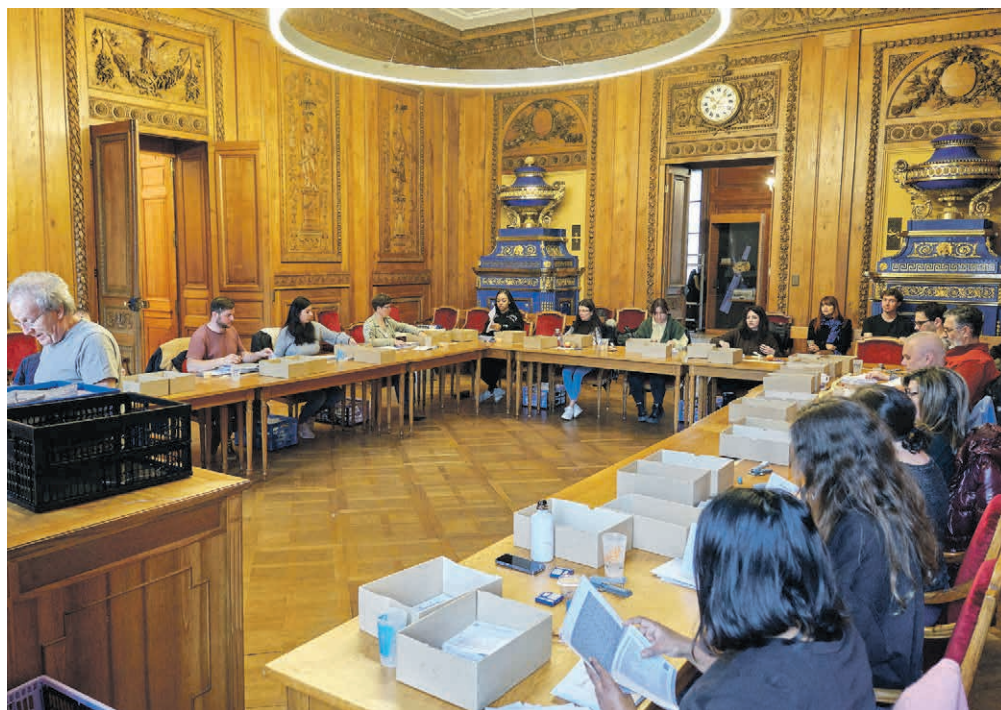
Ambiance lors du dépouillement des élections communales à l'Hôtel de Ville. BERNARD PYTHON

Les partis de gauche ont confirmé ce dimanche leur majorité au Conseil général pour la législature 2024-2028. A droite, l'UDC fait son retour, décrochant trois sièges sur les 41 fauteuils à pourvoir. Les nouveaux élu-e-s siégeront pour la première fois le 1 er juillet prochain.