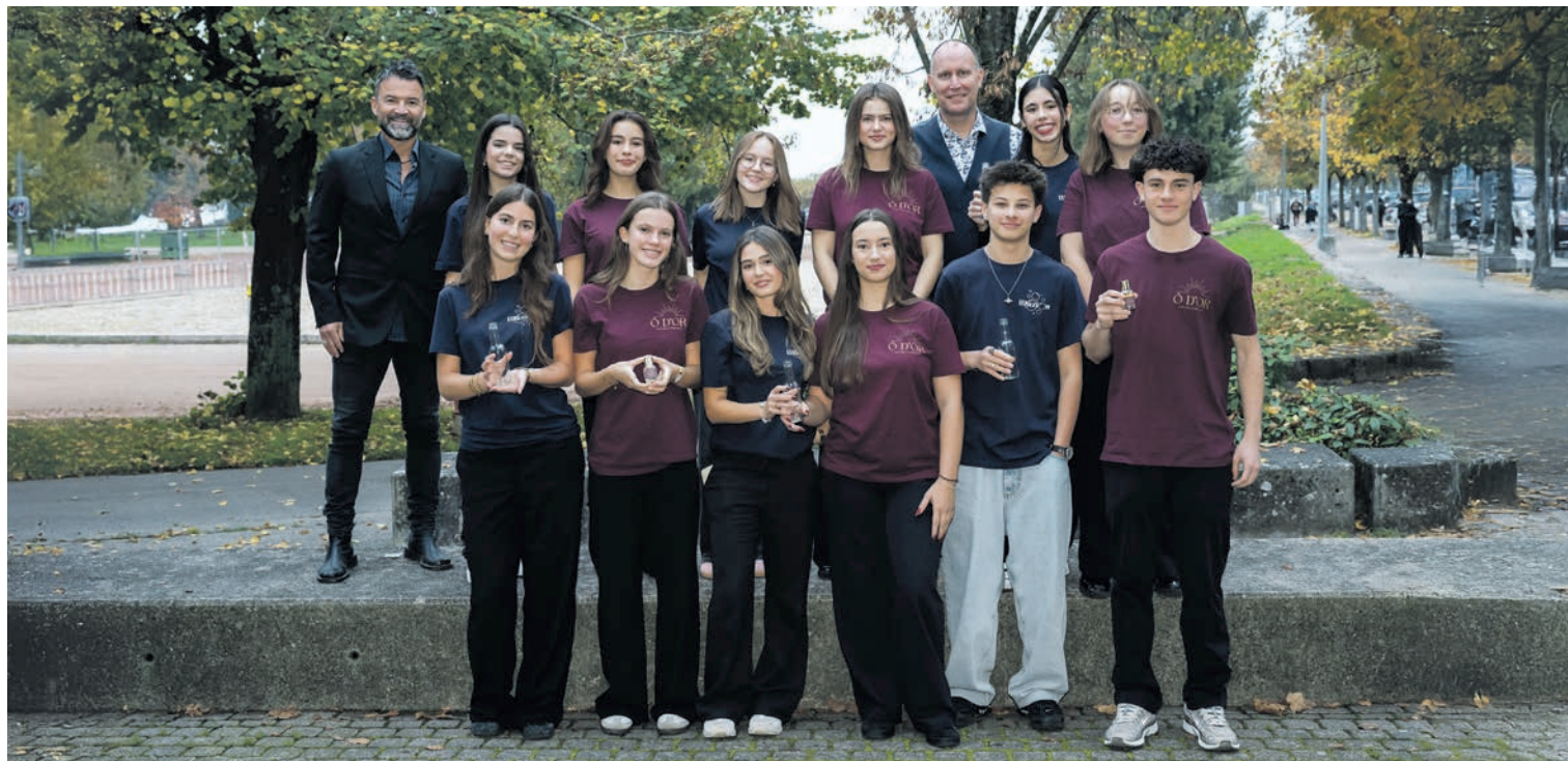
Coachées par Pascal Debély et Raphaël Perotti, les mini-entreprises Ô d'or et Illuzion proposent parfum d'ambiance et mocktails pétillants. LUCAS VUITEL

Créer une petite entreprise en guise de travail de maturité et se frotter à la concurrence en participant à un concours national : c'est le défi relevé une nouvelle fois par des élèves du lycée Jean-Piaget. Les produits imaginés par les deux équipes ? Des cocktails sans alcool qui pétillent et des parfums d'ambiance à la Fée verte.