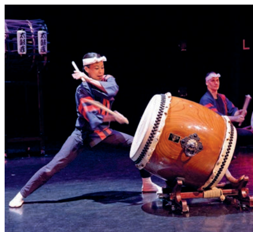
Taikoza fera résonner ses tambours le 1 er décembre.

Le groupe de percussions japonaises Taikoza fera vibrer Neuchâtel, dimanche 1 er décembre à 17h au Temple du Bas. Un concert qui met en avant des rythmes puissants dans une mise en scène qui fait penser aux arts martiaux.