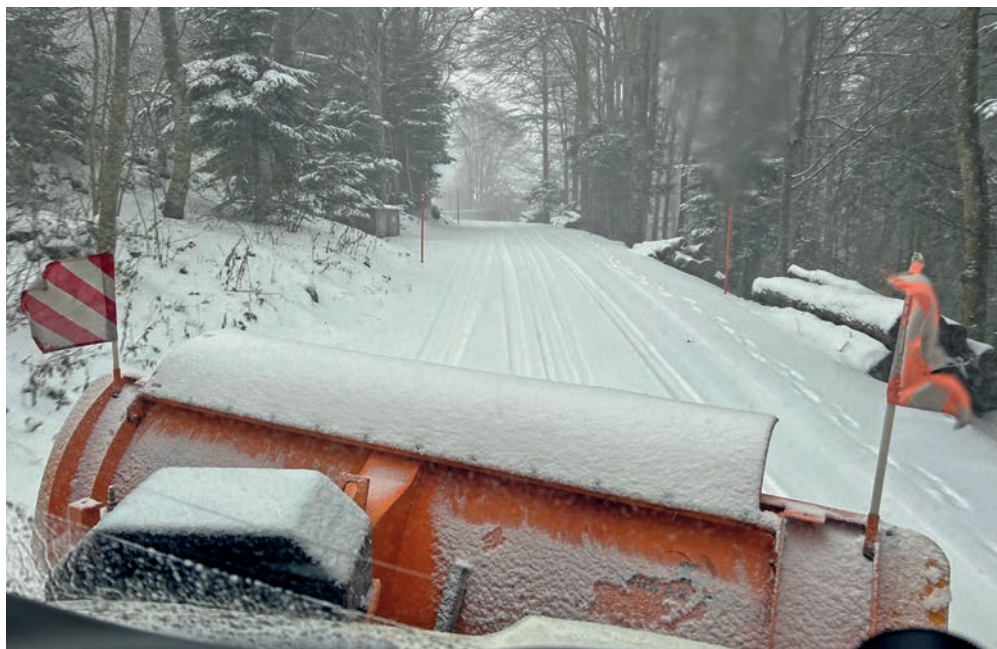
A quoi servent ces drapeaux? C'est un point de repère pour permettre au conducteur de situer le bord de la lame, large de 3,3 mètres.