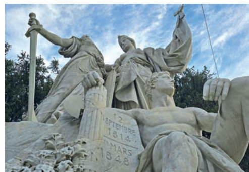
La sculpture de la place Alexis-Marie-Piaget.

Exposé aux quatre vents, le monument de la République a pris un agréable bain de jouvence. Et c'est toute la mémoire de la révolution neuchâteloise qui ressurgit.