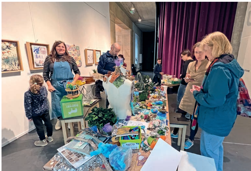
L'association Sens'Egax a animé un atelier en vue de créer une œuvre artistique, visible au Muséum, dans le cadre de la Bibliothèque vers un futur heureux. JEHISSON SANTACRUZ

Né à Zurich, le projet a fait étape à Vals dans les Grisons, avant de s'établir à Neuchâtel jusqu'au 1 er décembre. «Le projet a pour but de mener