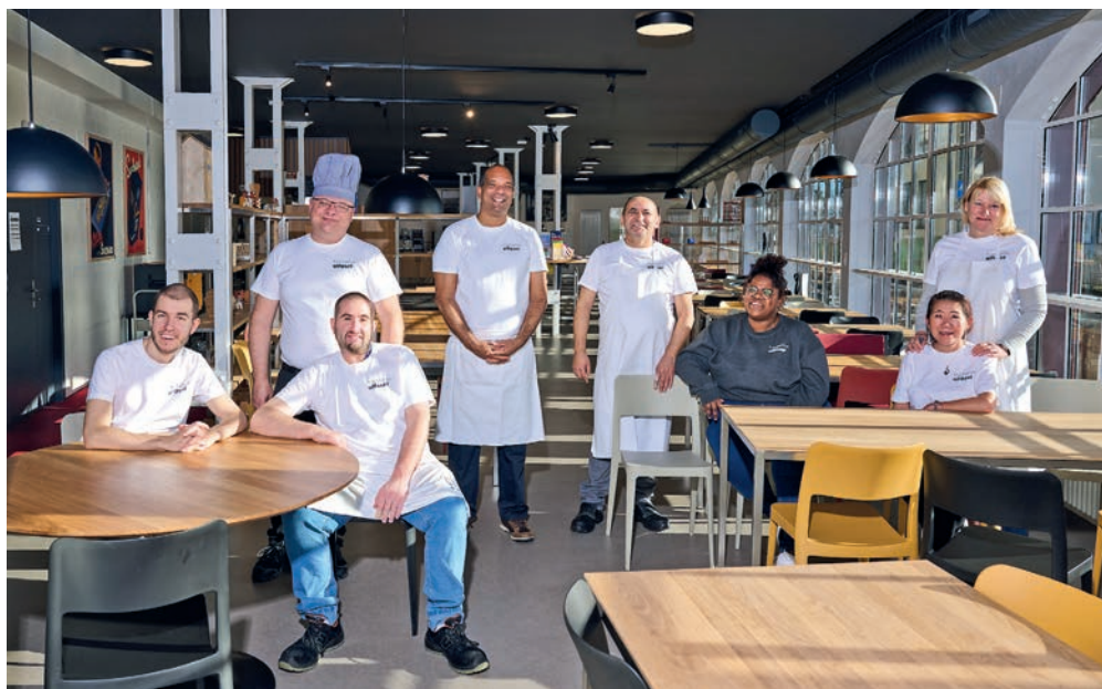
L'équipe de la fondation Alfaset vous attend dans sa cafétéria pour partager un café ou le repas de midi dans l'atmosphère si particulière de Serrières.

Depuis la fin août, 13 entités de l'administration cantonale neuchâteloise ont pris leurs quartiers dans de nouveaux espaces de travail à la rue de Tivoli 28. «Ce sont quelque 90'000 visites par an qui sont attendues», indique l'Etat. A proximité immédiate du nouveau pôle de l'administration cantonale, la cafétéria permet aux collaborateurs de l'Etat, qui ne rentrent pas forcément durant leur pause de midi, de manger un repas chaud et équilibré. «Nous collaborons avec l'administration cantonale, notamment pour leurs journées de formation, qui sont basées sur le site de Tivoli. Les participant-e-s prennent leur repas à la cafétéria». La fondation Alfaset propose également la cafèt à la location avec un service traiteur pour des événements, étendant son offre hors-murs, tant pour les entreprises que les particuliers. «Nous avons par ailleurs reçu les conseillers d'Etat, qui ont été servis par nos bénéficiaires. Un moment important pour eux». ● AK