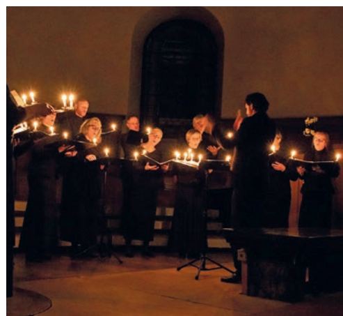
Le chœur Yaroslavl chante à la lueur vacillante des chandelles.

L'esprit de Noël s'invite à l'Eglise rouge. En cette période de l'Avent, le chœur Yaroslavl entonnera des œuvres de Noël à la lueur dansante des chandelles, puisant dans les riches répertoires des Balkans et du monde slave.