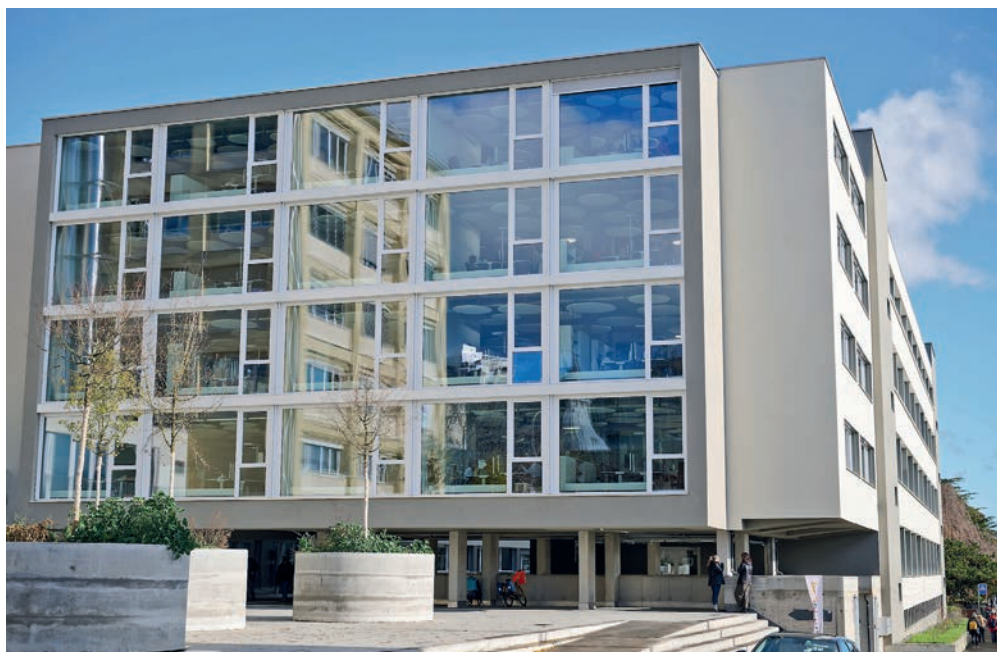
A proximité immédiate de la cafétéria se trouve le nouveau pôle de l'administration cantonale, qui accueille 13 entités dans de nouveaux espaces de travail.