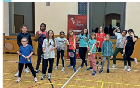
Une action sympa à Peseux.