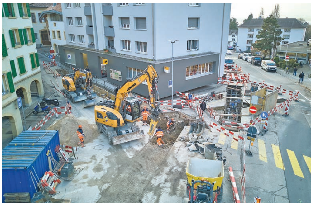
Des barrières rouges et blanches ceinturent le périmètre des travaux au centre de Peseux, vu de drone.

Le réaménagement du centre de Peseux repose sur le concept de ville éponge, c'est-à-dire avec des sols perméables, qui valorisent les eaux de pluie et limitent l'effet d'îlots de chaleur. Soixante arbres et arbustes seront plantés. ● AK