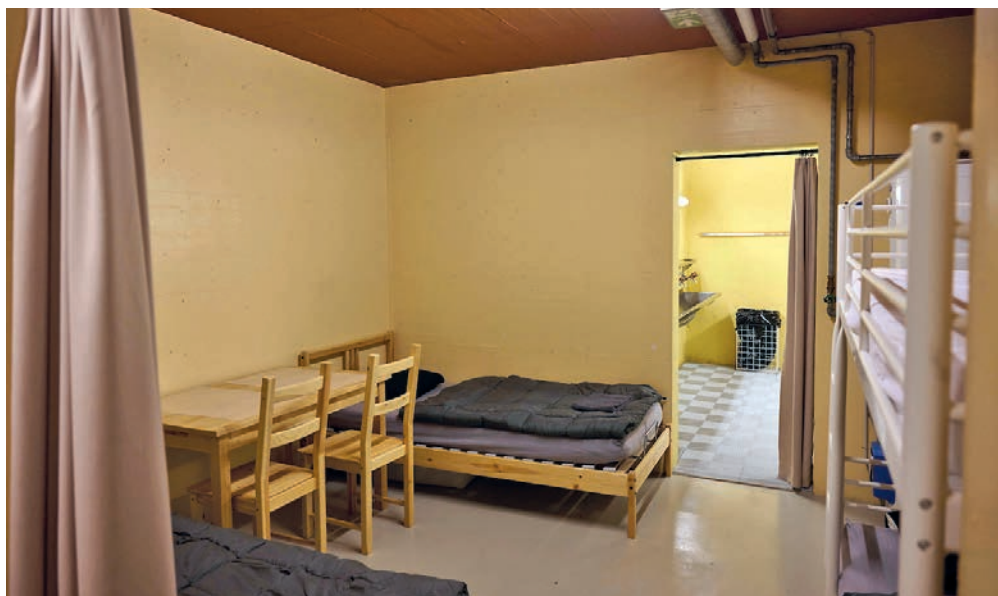
Pas de mixité au Sleep-in: les dortoirs sont séparés entre hommes et femmes, afin que tout le monde se sente à l'aise.