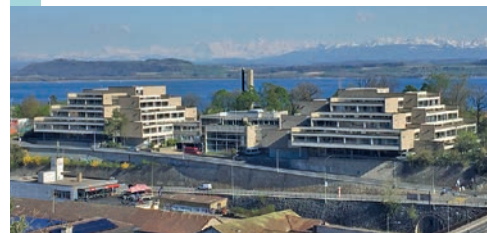
L'école a été construite entre 1967 et 1970.

Le Conseil d'Etat a mis sous protection le collège du Mail, a-t-il communiqué début février. Edifice moderne et précurseur, première œuvre d'envergure de l'architecte Alfred Habegger, l'école secondaire a été réalisée en 1967-1970. Selon les experts, elle constitue un ensemble de bâtiments unique à Neuchâtel. C'est le premier collège de la région issu de la réforme scolaire cantonale du cycle secondaire en 1963. Il se distingue par «sa volumétrie inhabituelle en forme de pyramide, traversée d'un puits de lumière autour duquel se succèdent, en un même mouvement ascensionnel et hélicoïdal, une série de plateaux reliés par des rampes», indique le communiqué. ●