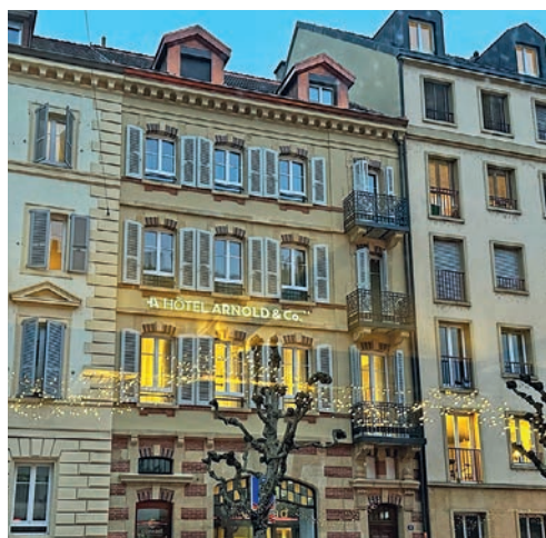
L'hôtel Arnold & Co sera ouvert début mars.

Avec ses 18 chambres et un enregistrement sans réception, l'hôtel Arnold & Co propose une offre inédite en ville de Neuchâtel. Il a été inauguré ce lundi.