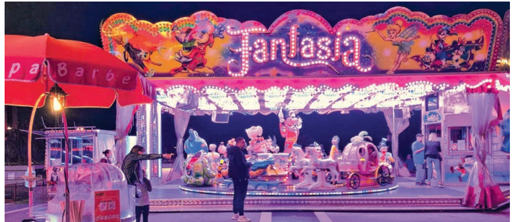
Les carrousels ouvrent ce vendredi dès 15h30 sur la place du Port.

→ Minigolf de Neuchâtel. Samedi 1 er mars. Infos: FB La Canebière - Minigolf et Events