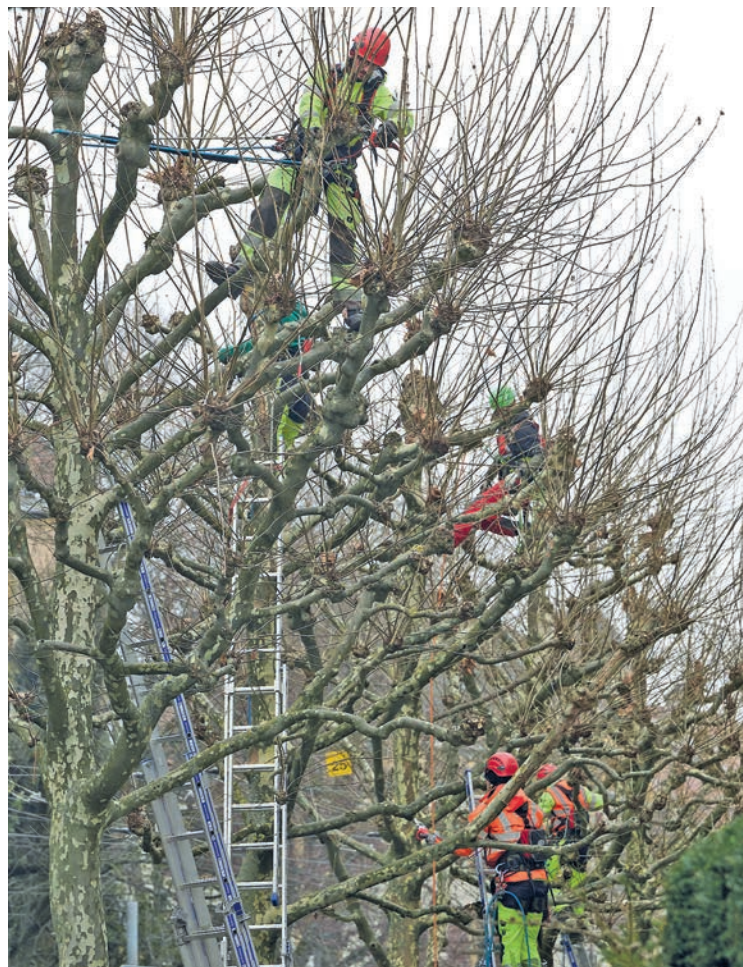
Opération coupe de saison pour les platanes de la rue de l'Évole et de la Promenade-Noire.

Les équipes de l'Office des parcs et promenades ne chôment pas durant la période hivernale : elles procèdent à bon nombre de tailles et de coupes sur le territoire communal. Lundi matin, les horticulteurs-paysagistes et arboristes-grimpeurs ont apporté un grand coup de sécateur aux platanes des rues de l'Évole et de la Promenade-Noire.