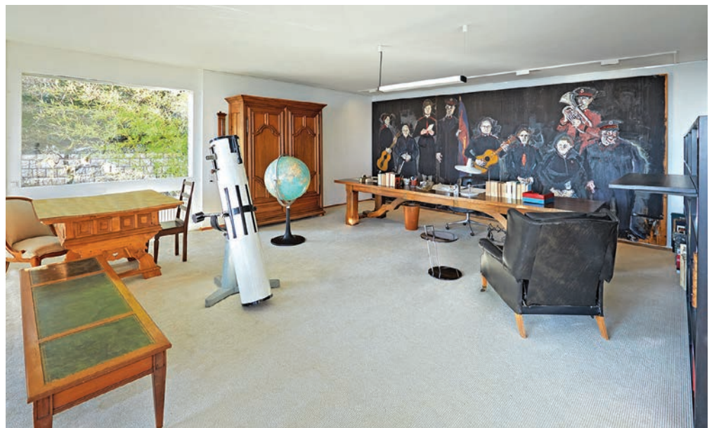
Il sera possible de visiter le bureau dans lequel travaillait Dürrenmatt tous les week-ends.