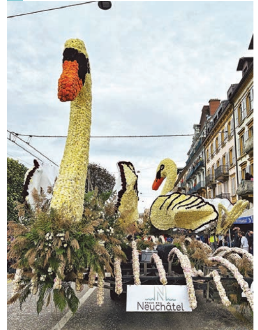
L'édition 2024 avait enchanté.