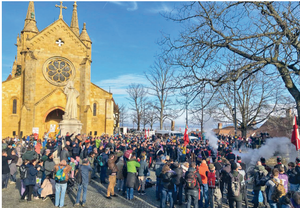
Au terme de la cérémonie officielle, un son et lumière illuminera la Collégiale.