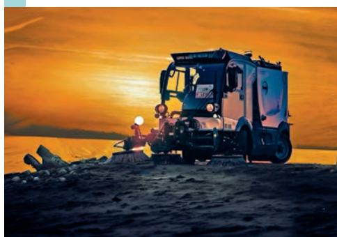
Lenora Rossi et sa balayeuse fétiche seront à l'honneur de la RTS. LENORA ROSSI

Employée de la Voirie, Lenora Rossi sera bientôt à l'honneur de la belle émission de la RTS Passe-moi les jumelles . Et pas seulement Lenora, mais aussi sa balayeuse, surnommée Leni, qui l'accompagne en tournée par tous les temps. Un outil de travail qu'elle aime aussi photographier, Lenora ayant aussi la passion de l'image. Leno & Leni , un reportage à ne pas manquer, vendredi 28 février à 20h10 sur la RTS! ●