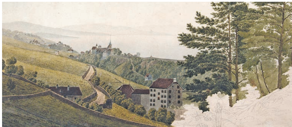
Une aquarelle de Louis Favre de 1825, montrant une vue du Château depuis Vauseyon. MAHN

→ Collégiale de Valangin. Dimanche 23 mars à 17h. Entrée libre, collecte.