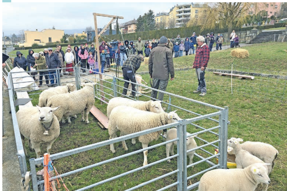
Les brebis, accompagnées de leurs agneaux, ont fait la joie des familles.

annonce les joies du printemps: ce sera bientôt notre tour d'enlever nos manteaux! Rappelons que le prochain agrandissement du cimetière de Peseux n'empêchera pas la présence de ces ovins de race Texel et nains du Cameroun, la parcelle au sud-est leur restant réservée: ils continueront donc à paître avec la plus belle vue sur le lac! ●