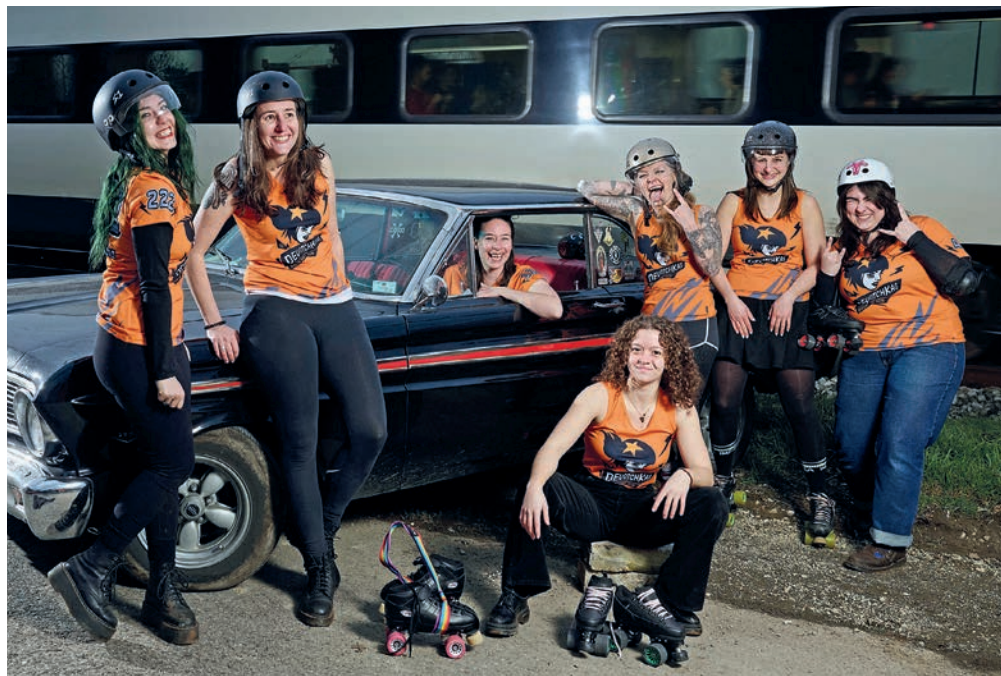
Une partie de l'équipe neuchâteloise de roller derby, les Devotchkas, affrontera Besançon, dimanche prochain au Mail. DAVID MARCHON

Saviez-vous que la ville de Neuchâtel comptait une équipe de roller derby? Baptisée les Devotchkas, elle réunit une quinzaine de personnes, âgées de 20 à 50 ans. Pour mettre en avant sa discipline encore méconnue du grand public, l'équipe neuchâteloise organise un événement dimanche 23 mars à la salle de gymnastique du collège du Mail.