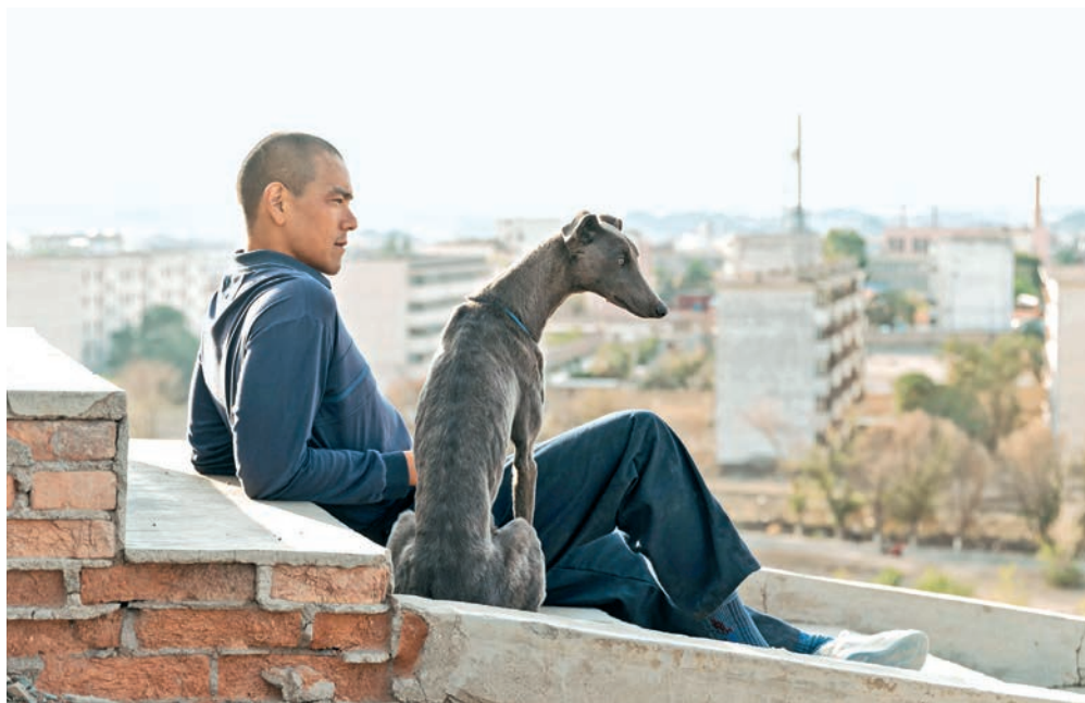
A l'affiche figure notamment Black Dog , un film noir venu de Chine à l'humour chaplinesque.

P oursuivant sa mise en valeur d'un cinéma différent, la programmation de cette nouvelle édition fera à nouveau voyager aux quatre coins du globe en proposant 16 longs-métrages aux thématiques variées, dont de nombreuses avant-premières. Parmi celles-ci, Black Dog du cinéaste chinois Guan-Hu, une allégorie «mêlant film noir, réalisme social et humour chaplinesque» sur le devenir d'un système faisant fi de toute humanité, La Cocina , une comédie mexicaine «cauchemardesque» dévoilant tout ce que les Etats-Unis doivent à leurs working poor clandestins, ou encore le tout premier film somalien sélectionné à Cannes, The village next to paradise , un «émouvant récit choral où l'espoir demeure, envers et contre tout».