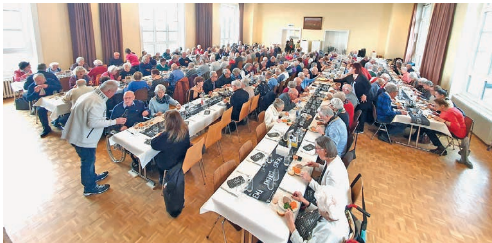
Quelque 170 personnes étaient présentes pour cette première édition.