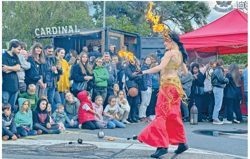
Jeudi-Oui attire toutes les générations autour d'événements culturels et festifs. Ici à Peseux.

Dix fois par an, l'équipe de Jeudi-Oui anime les quartiers de la ville. L'occasion de les découvrir selon différentes facettes, en fonction des saisons. « Lorsque l'on revient dans un quartier, on essaie de changer de période pour explorer d'autres spécificités. En septembre, juste avant la Fête des vendanges, nous nous rendons à Peseux. Avec les travaux en cours sur la place de la Fontaine, nous n'aurons d'autre choix que de nous réinventer ».