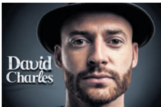
David Charles chantera ses nouvelles compositions à l'occasion d'un show live qui se tiendra samedi 2 novembre à la Maison du Concert.

L'artiste David Haeberli, de son nom de scène David Charles, donnera un concert en live samedi 2 novembre à 20h45 à la Maison du Concert. Accompagné sur scène par cinq musiciens, il interprétera ses nouvelles compositions dans un style groovy et dansant. La soirée se prolongera par une after party animée par DJ Mister X.