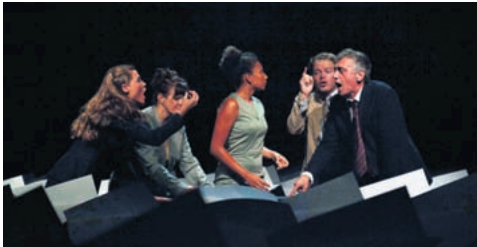
Dans « Sandra qui? », les acteurs déclament sur un rythme soutenu le texte comme ils joueraient une partition de musique.

Des bribes de vie que la metteuse en scène a voulu questionner suite à deux événements marquants: d'une part, l'écoute d'une émission qui traitait de la mémoire collective et du risque d'oubli de la Shoah, une fois que tous ses rescapés auront disparu; d'autre part, le diagnostic chez sa maman de la maladie d'Alzheimer,