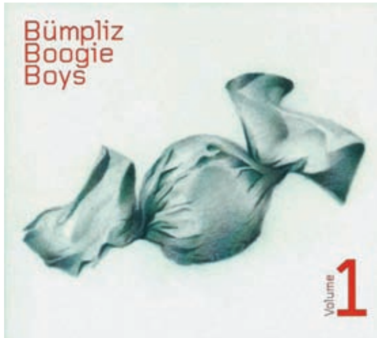
Volume 1 des Bümpliz Boogie Boys, une gâterie à consommer sans modération.