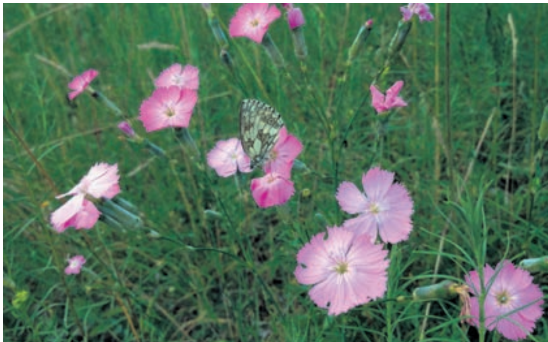
Un papillon «demi-deuil» butine une fleur de pipolet.

A lui seul, le titre de l'exposition est déjà une énigme pour beaucoup de personnes. Si certains neuchâtelois se souviennent encore que les pipolets sont des œillettes sauvages, la majorité de la population ignore totalement que ces plantes poussent dans la région, bien loin des bacs de leur fleuriste préféré. A l'origine, le pipolet, c'est la petite pipe en bois munie d'un long manche. La ressemblance est frappante avec l'œillet des rochers lorsque celui-ci est en bouton.