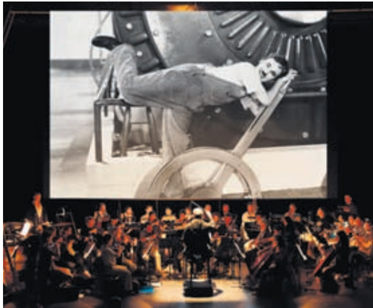
L'Orchestre des Jardins musicaux présente les 21, 22, 24 et 25 décembre au Passage «Les Temps Modernes» de Charles Chaplin. • Photo: Pierre-William Henry

« Cinquante musiciens se produiront en direct pendant la diffusion sur écran géant du film "Les Temps modernes" de Charles Chaplin »