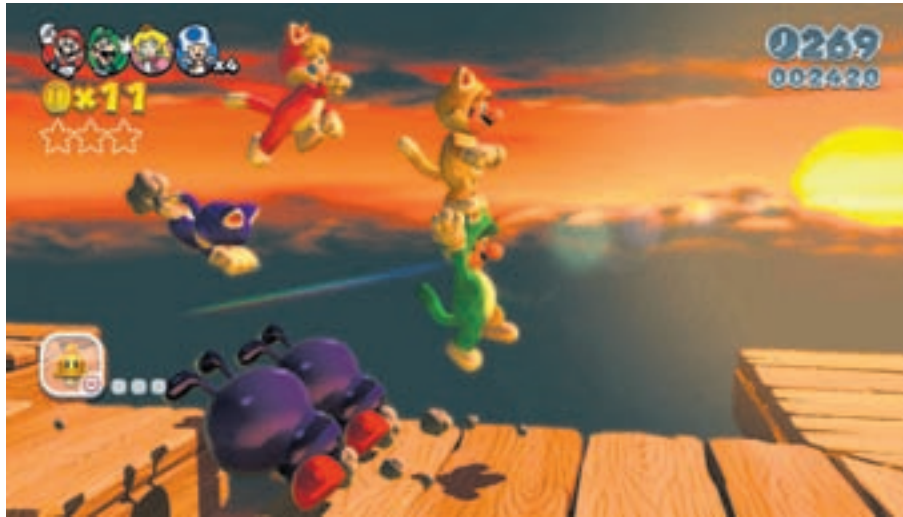
Miaouss, la Guerre! • Photo: sp

L'ennemi juré Bowser a capturé des fées dans un monde parallèle, ni une, ni deux, Mario, Luigi, Peach (pas besoin de la sauver ce coup-ci) et Toad plongent dans ce nouvel univers afin de les secourir. Derrière ce scénario extrêmement travaillé, se cache un jeu avec du concentré de Mario, du vrai! Il n'y a que les idiots qui ne changent pas d'avis. Nos premières impressions sur ce énième Mario, notamment lors de la GamesCom, ne présageaient rien de bon. Et le voilà qui débarque, avec son nouveau costume de chat, tout mimi et comme ces perfides félins, il a su nous attendrir à coup de ronronnements. Cependant, avant d'aller plus loin, nous tenons à maintenir l'un de