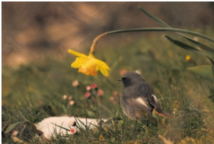
Ramoneur et olive jaune. En parler neuchâtelois, ces deux mots désignent le rouge-queue noir et la jonquille.

Sur plus de 250 pages, vingt auteurs présentent dix-sept articles originaux traitant le plus souvent d'organismes méconnus tels que les amibes, les diatomées, les lichens ou