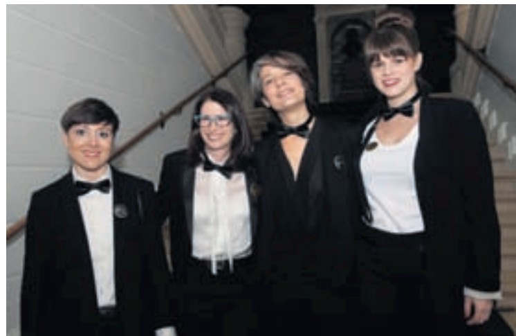
... Argent, Jeux, Enjeux