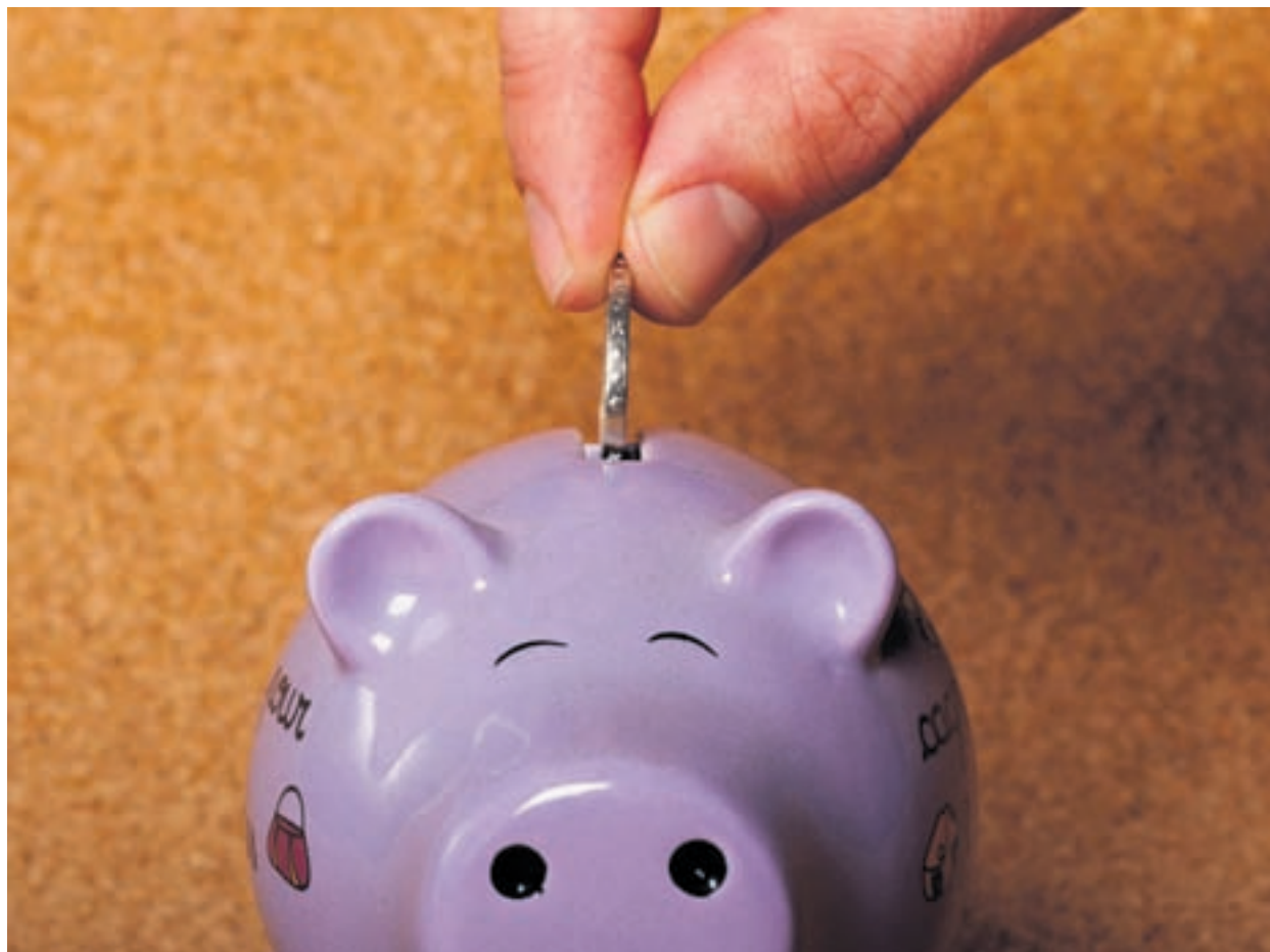
La baisse du coefficient fiscal sera débattue lors de la séance du Conseil général de janvier prochain.

Bonnes fêtes de fin d'année à toutes et tous! Elles ne sont pas faciles pour tout le monde, mais notre groupe espère que toute la population de Neuchâtel aura l'occasion d'un moment agréable, peut-être avant, lors d'une visite aux stands des produits du