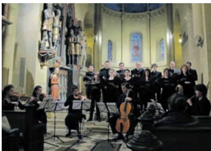
L'Ensemble vocal de la Collégiale retrouve l'Ensemble Intercomunicazione de Neuchâtel à l'occasion de ces deux concerts dédiés à Bach.

Deux trios de cantates composées en 1723 par Johann Sebastian Bach seront proposés. Nommé directeur artistique du Chœur de l'église Saint-Thomas de Leipzig en mai de cette même année, l'Allemand travailla sans relâche jusqu'à l'Avent.