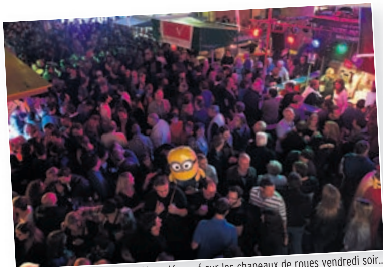
Fièvre du vendredi soir: La fête a démarré sur les chapeaux de roues vendredi soir... A vrai dire, pour les plus impatients, dès la sortie des bureaux... La soirée dite des Neuchâtelois a rassemblé une foule avide de moments partagés en toute convivialité.