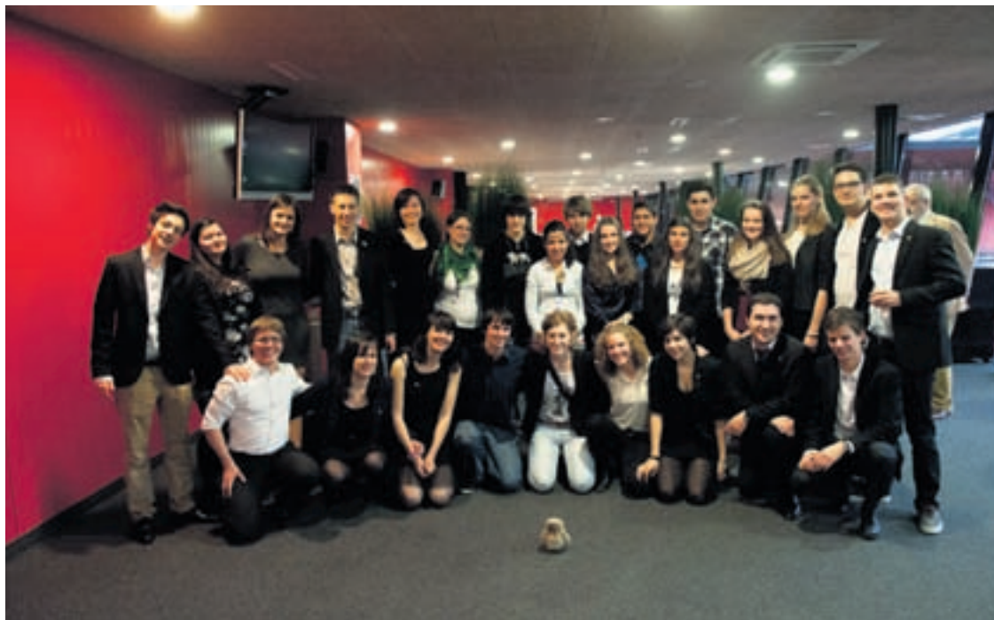
Parlement Européen des Jeunes à Neuchâtel en avril 2013.

Sous un soleil de plomb, les épreuves se sont enchaînées, entre baseball, pyramides humaines ou football, avec la victoire finale remportée par le Conseil des Jeunes de Lausanne, qui organisera donc la