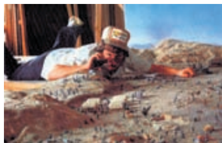
Avec «Gulliver», les enfants verront le monde avec les yeux d'un géant.

Plonger avec Gulliver dans un monde féérique de Lilliputiens: c'est le voyage proposé durant les vacances scolaires par la compagnie Le Thaumatrope, dans une création pour le moins originale puisqu'elle sera jouée dans un cube percé de petites lucarnes. A voir dès 8 ans au Temple du Bas.