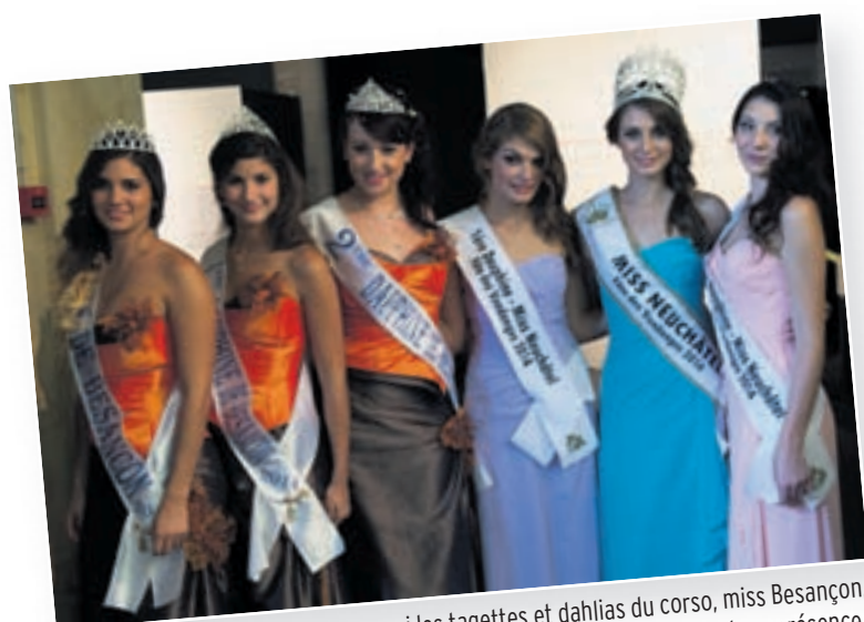
En orange, bleu et rose : Roses parmi les tagettes et dahlias du corso, miss Besançon, miss Fête des vendanges et leurs dauphines ont illuminé la Fête de leur présence. A part cela, les blondes n'ont plus la cote de part et d'autre de la frontière...