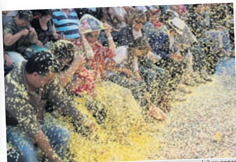
Pluie de confettis: Mieux vaut une bonne pluie de confettis sous un soleil rayonnant que la violente averse qui avait trempé tout le monde l'année passée.