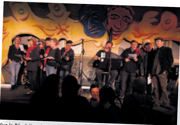
Viva la Révolution: La Comédie de Serrières a transformé la rue du Neubourg en un repaire de révolutionnaires qui ont rendu hommage en chansons aux partisans italiens et aux héros de la Commune de Paris, sans oublier le commandante Che Guevara.