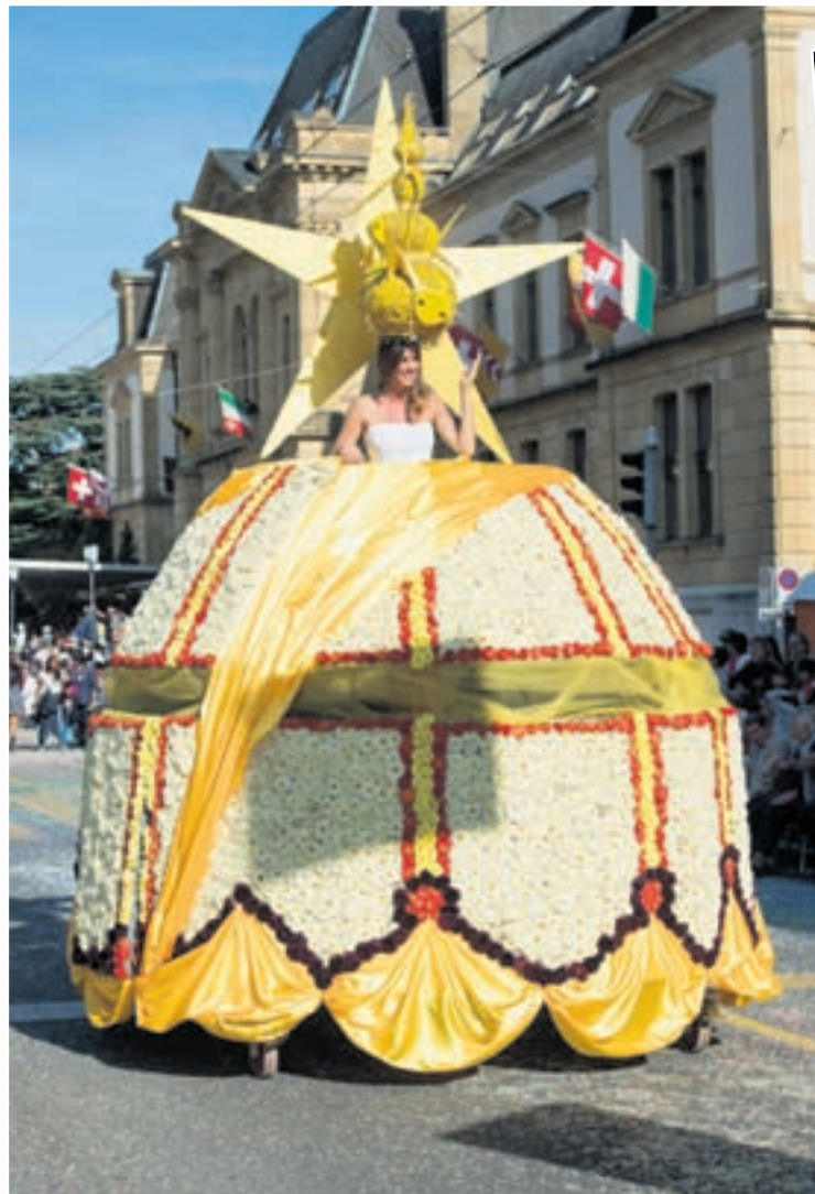
Joli cœur : Si l'on n'a pas de chance en amour, on en aura peut-être au jeu ! Tel était sans doute le message subliminal délivré par cette dame de cœur dont la robe géante toute de fleurs lui avait été offerte par le Casino. De quoi en perdre la tête!