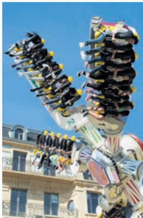
La tête à l'envers: Les manèges de la place du port rivalisent chaque année d'inventivité pour tourner la tête des adolescents qui finissent parfois par en avoir l'estomac tout retourné...