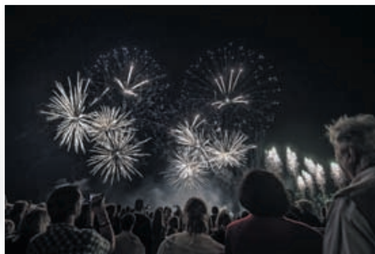
Pas en noir et blanc : Le spectacle pyromélodique des frères Guinand a enchanté le public trois quarts d'heure durant et - contrairement aux apparences - a produit une débauche de couleurs et de musiques impressionnante.