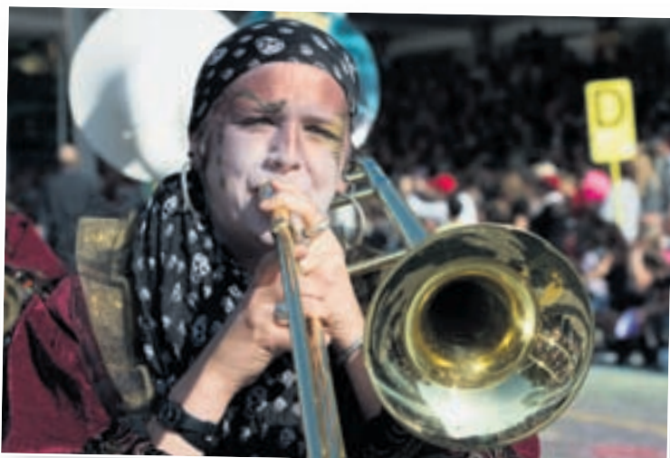
Secoués: La cliqué des AJT a secoué les têtes du public (dont certaines n'en demandaient pas tant) avec une musique qui ressemble à un bloody mary mélangé dans un shaker acoustique. A consommer sans modération!