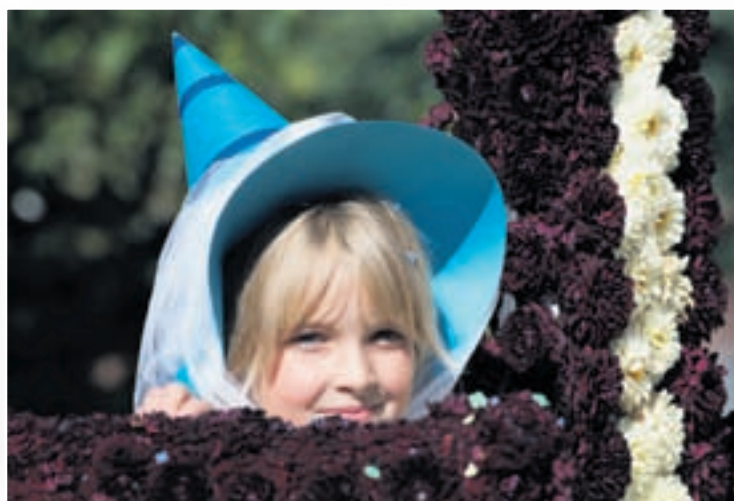
Beauté timide: La Fête des vendanges est aussi celle des enfants qui sont les adultes de demain appelés à perpétuer cette précieuse tradition neuchâteloise séculaire.