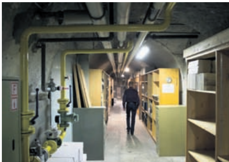
La BPU a inauguré mercredi la série de visites organisées par la Ville dans les coulisses des institutions culturelles.

Plus prosaïquement, qu'il s'agisse de la collection des invertébrés du Muséum d'histoire naturelle ou des trésors du département des arts appliqués du Musée d'art et d'histoire, le