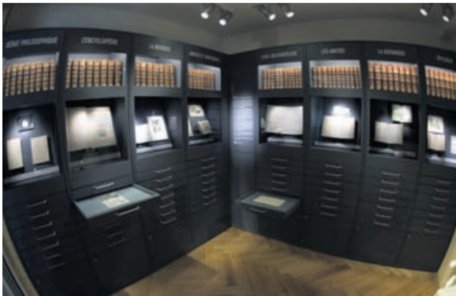
La salle des archives de l'espace Rousseau renferme des trésors, telles les fameuses cartes à jouer de l'écrivain.

La Bibliothèque publique et universitaire de Neuchâtel (BPUN) a inauguré la semaine dernière un nouvel espace dédié à Jean-Jacques Rousseau, dont elle possède un fonds d'archives unique au monde. Il intègre une exposition permanente interactive et ludique, ainsi qu'un dépôt d'archives ouvert tous les mercredis et samedis après-midis au public. Parmi la centaine de lettres et manuscrits originaux qui y sont exposés figurent l'unique exemplaire des «Rêveries du promeneur solitaire» ou les fameuses cartes à jouer sur lesquelles le grand homme des Lumières notait ses pensées.