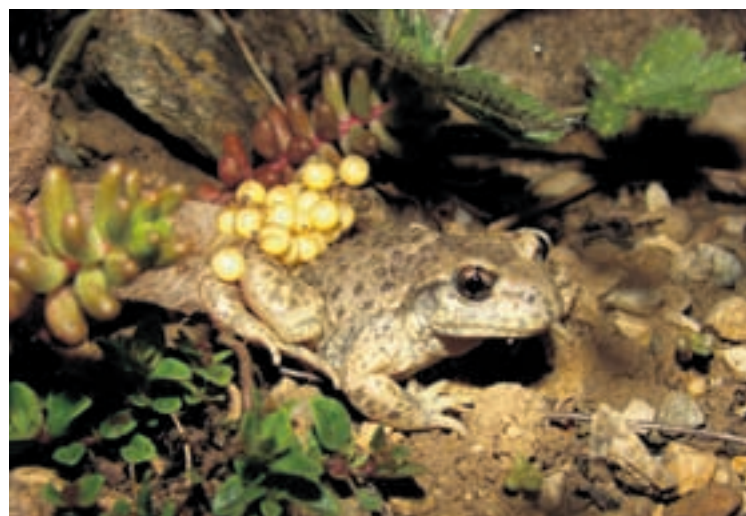
Un mâle de crapaud accoucheur prenant soin de ses œufs.