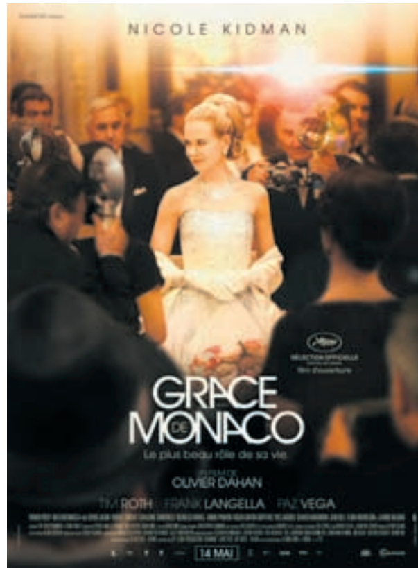
Nicole Kidman incarne la princesse Grace de Monaco dans un film-portrait de la célèbre actrice Grace Kelly.

Le film est magnifiquement dirigé avec de somptueux décors. Il en résulte des images d'une grande qualité. Nicole Kidman et Tim Roth incarnent avec brio Grace et Rainier de Monaco. A l'écran, le franc-parler de Grace et les manières monégasques ne font pas bon ménage. Le film la présente comme ayant du mal à s'acclimater à son environnement, ce qui déplaît à son entourage royal. Quand son éventuel retour à Hollywood se mêle au conflit fiscal opposant la France à Monaco, des difficultés au sein du couple princier apparaissent. Le spectateur est confronté aux coulisses peu reluisantes de l'univers politique et royal monégasque. Dans ce contexte, le réalisateur s'attache à montrer le dilemme qui secoue Grace et tous les états d'âme