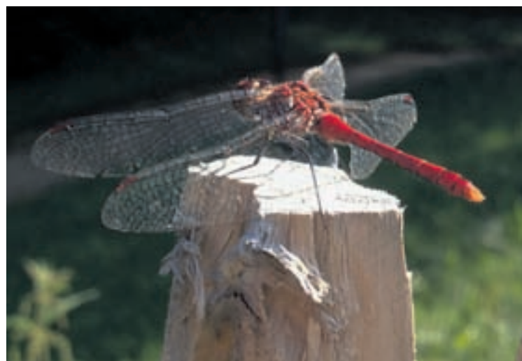
Plus d'une centaine de photos présentent le monde des insectes, à l'image du symptetrum sanguin, une libellule vivant au bord des étangs. • Photo: Blaise Mulhauser