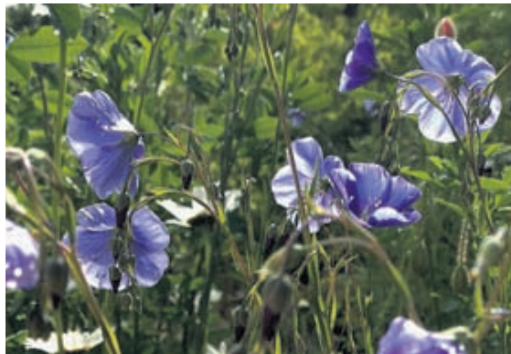
Fleurs de lin, une plante très utilisée à Neuchâtel durant le Moyen Age et jusqu'au XIX e siècle.