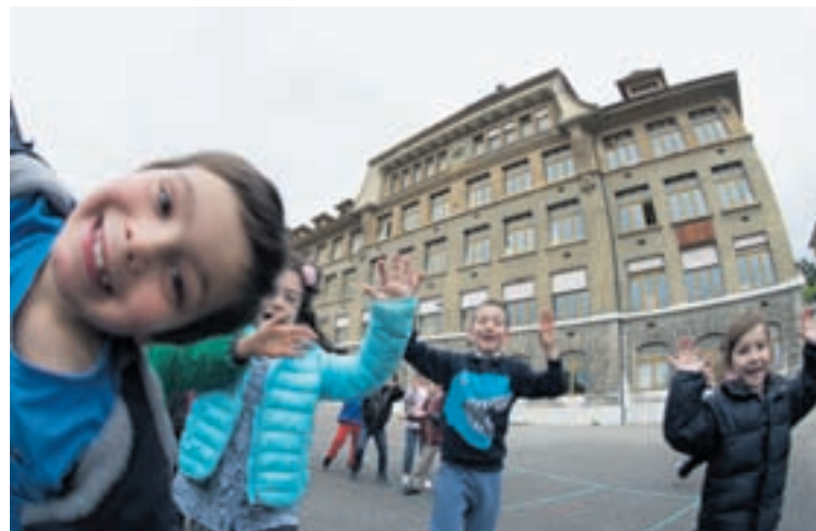
... les élèves se préparent à la fête du centenaire

TOUT EST PERMIS 3 e semaine. 8 ans sug. 14 ans. VF me au ma 18h15. De Coline Serreau.