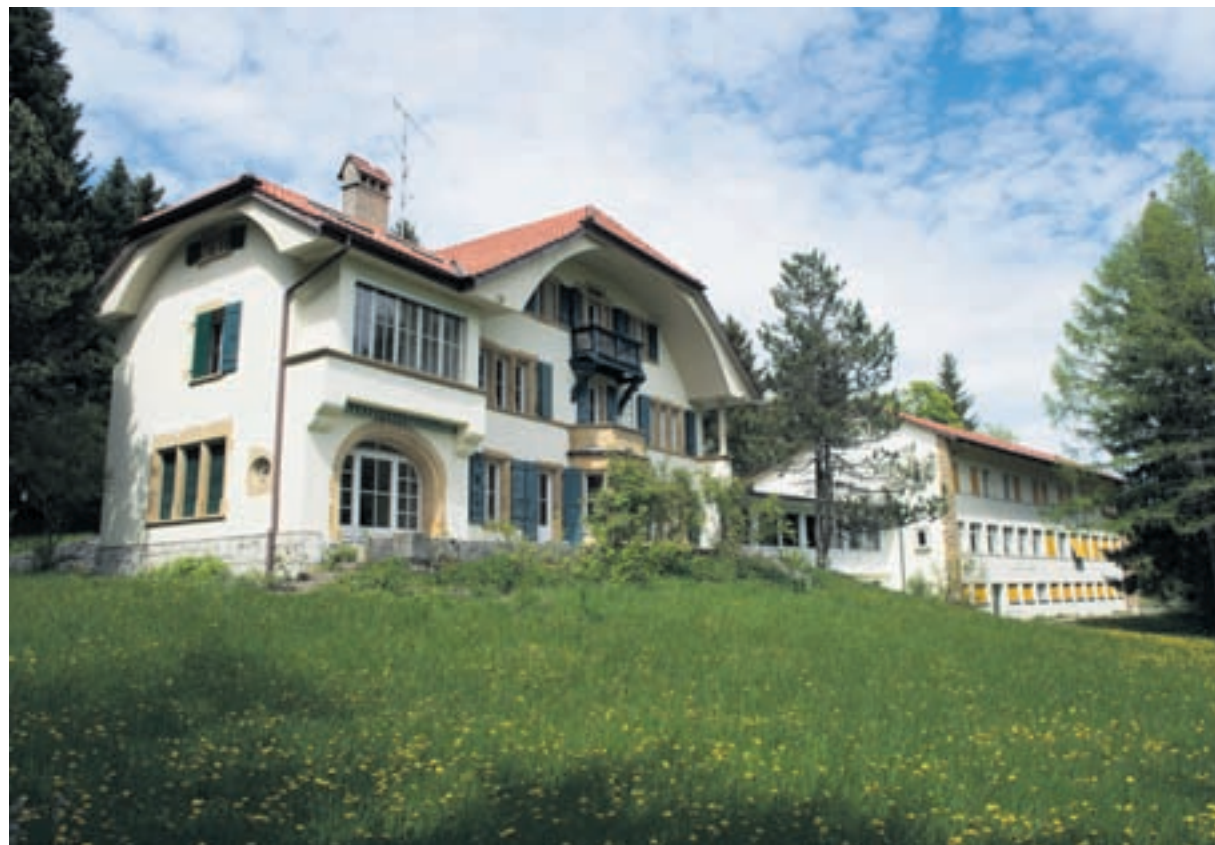
Le groupe PRL souhaite que le Conseil communal présente des options concrètes et chiffrées pour l'avenir du Home Bâlois à Chaumont.