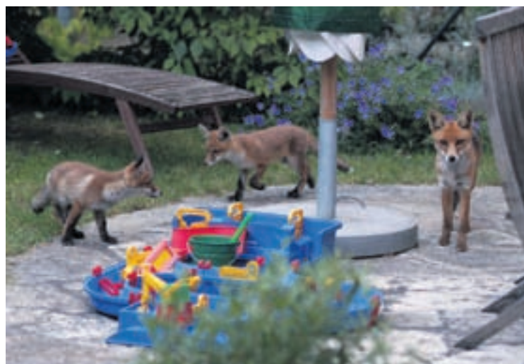
Plusieurs habitants de Neuchâtel voient leurs photos figurer dans le livre. La famille Saam a ainsi envoyé des images de renardeaux jouant sur leur terrasse.