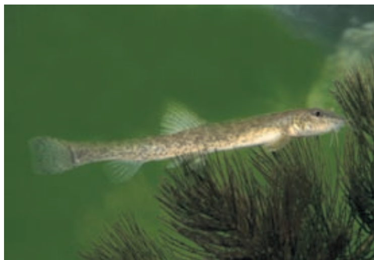
Le monde aquatique est aussi représenté dans l'encyclopédie. Ici une loche franche.