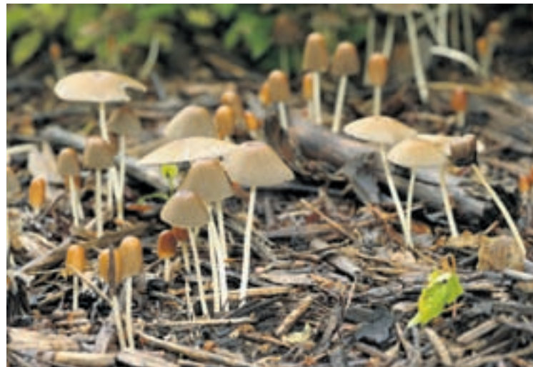
Le livre regorge de photos de champignons tels que ces coprins parasols.