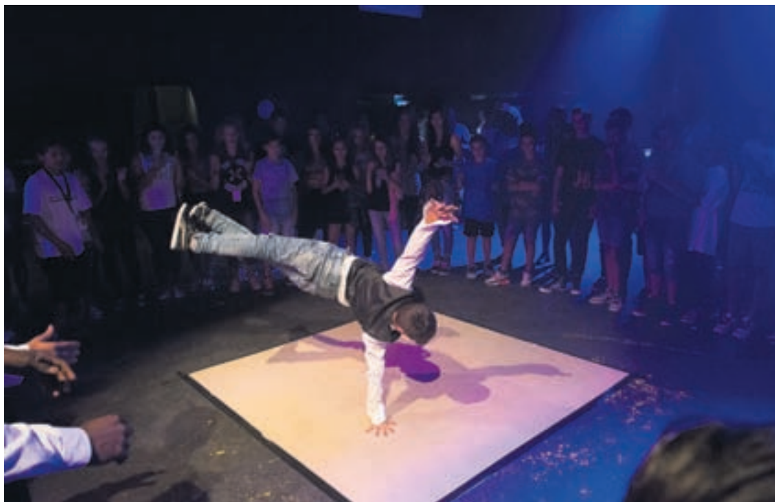
Une soirée thématique pour les jeunes, organisée par des jeunes: tel se présente le projet Urban street du Conseil des jeunes, qui s'est tenu samedi soir à la Case à chocs.