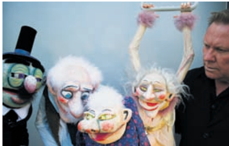
Le spectacle «Mathilde» du marionnettiste Neville Tranter met en scène les résidents et le personnel d'une maison de retraite.