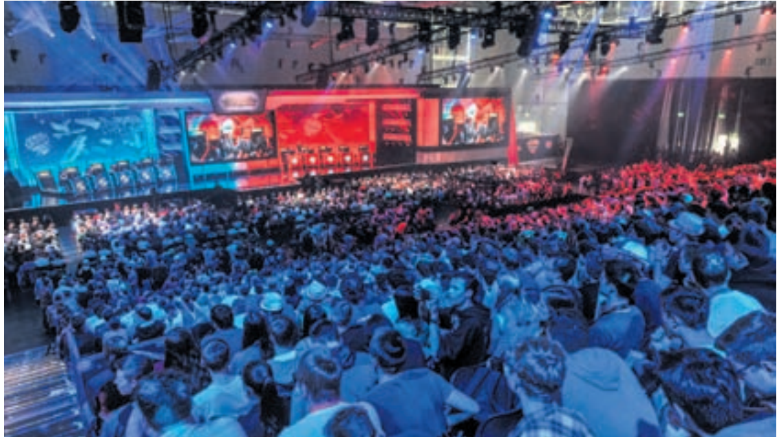
Une place imposante a également été laissée à l'e-sport. • Photo : gamescom-cologne.com

Chez Nintendo , l'accueil est toujours aussi soigné et on y a déniché