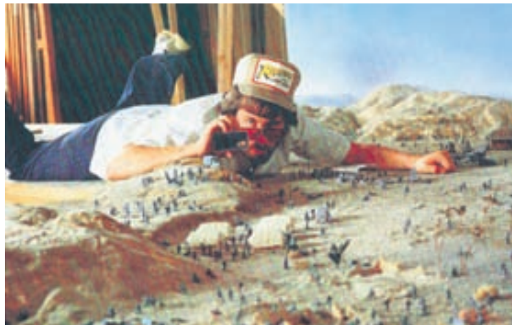
Dans le spectacle «Gulliver», les spectateurs observeront les acteurs au travers de petites lucarnes.