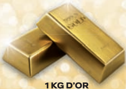
1 KG D'OR