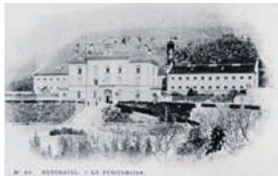
Sur la colline de Chantemerle, le pénitencier cantonal a fait place à Unimail.