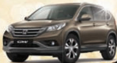
1x CR-V DIESEL