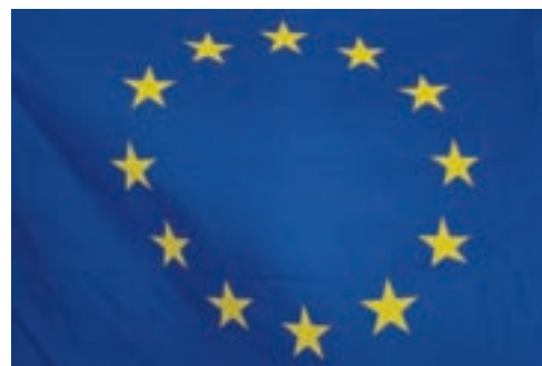
Le Prix de la citoyenneté sera remis pour la première fois le 21 novembre dans le cadre des manifestations de la Semaine européenne de la démocratie locale.

Le Conseil communal place le renforcement de la cohésion sociale et de la citoyenneté en ville de Neuchâ-