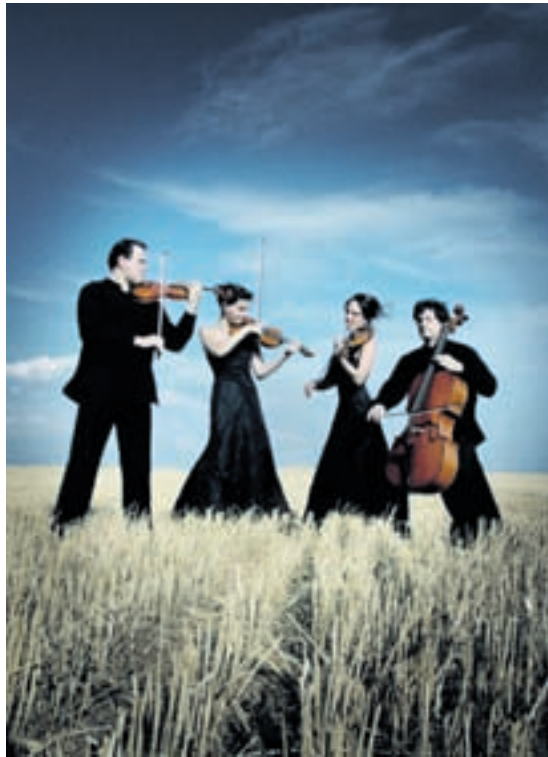
Le quatuor Terpsycordes viendra en novembre au Temple du Bas pour un concert qui s'annonce prometteur.