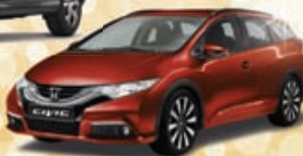
1x CIVIC TOURER