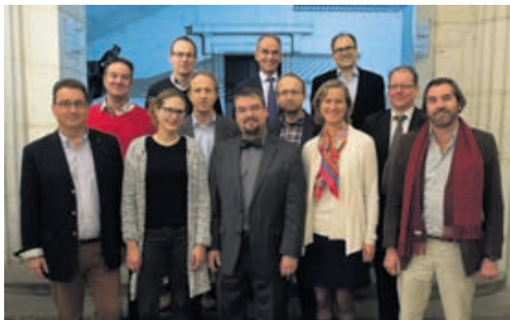
Le groupe PLR regrette que la planification financière à moyen terme n'ait pas été effectuée dans le cadre du présent budget.

De plus mis en relation avec les années 2016 et 2017 pour lesquels les rééquilibrages entre canton et communes provoqueront de nouvelles charges ou/et des diminutions de revenus, ne devrait-on pas déjà anticiper dans le budget 2015 ces perspectives défavorables? Or l'écart dans l'évolution entre charges et revenus d'exploitation