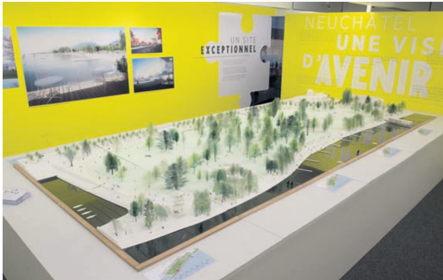
Le projet Ring pour le réaménagement des Jeunes-Rives a suscité un large engouement auprès des participants au processus participatif «Centre et Rives».

impressions à propos de la démarche participative «Centre et Rives»