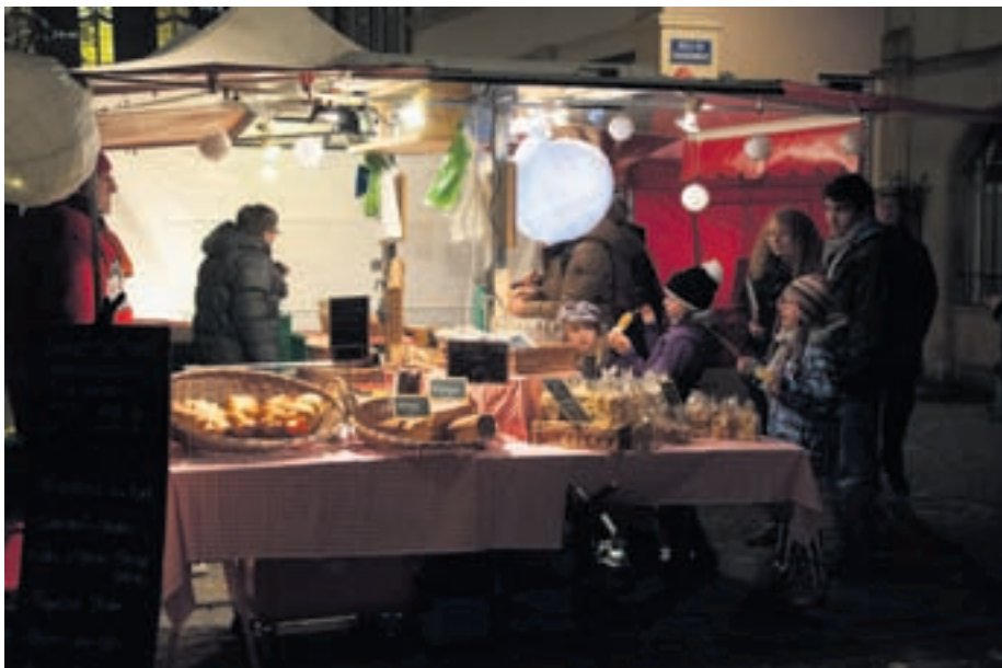
Différents stands de Noël proposent des produits de qualité à la place du Coq-d'Inde durant quatre jours.