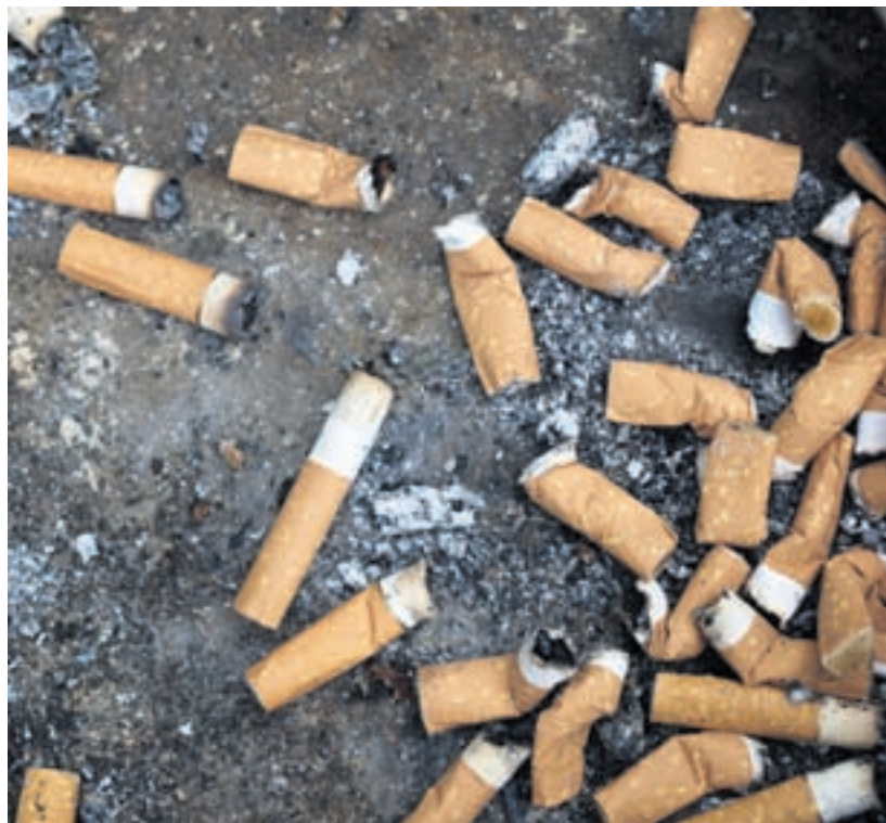
P.-O. A.