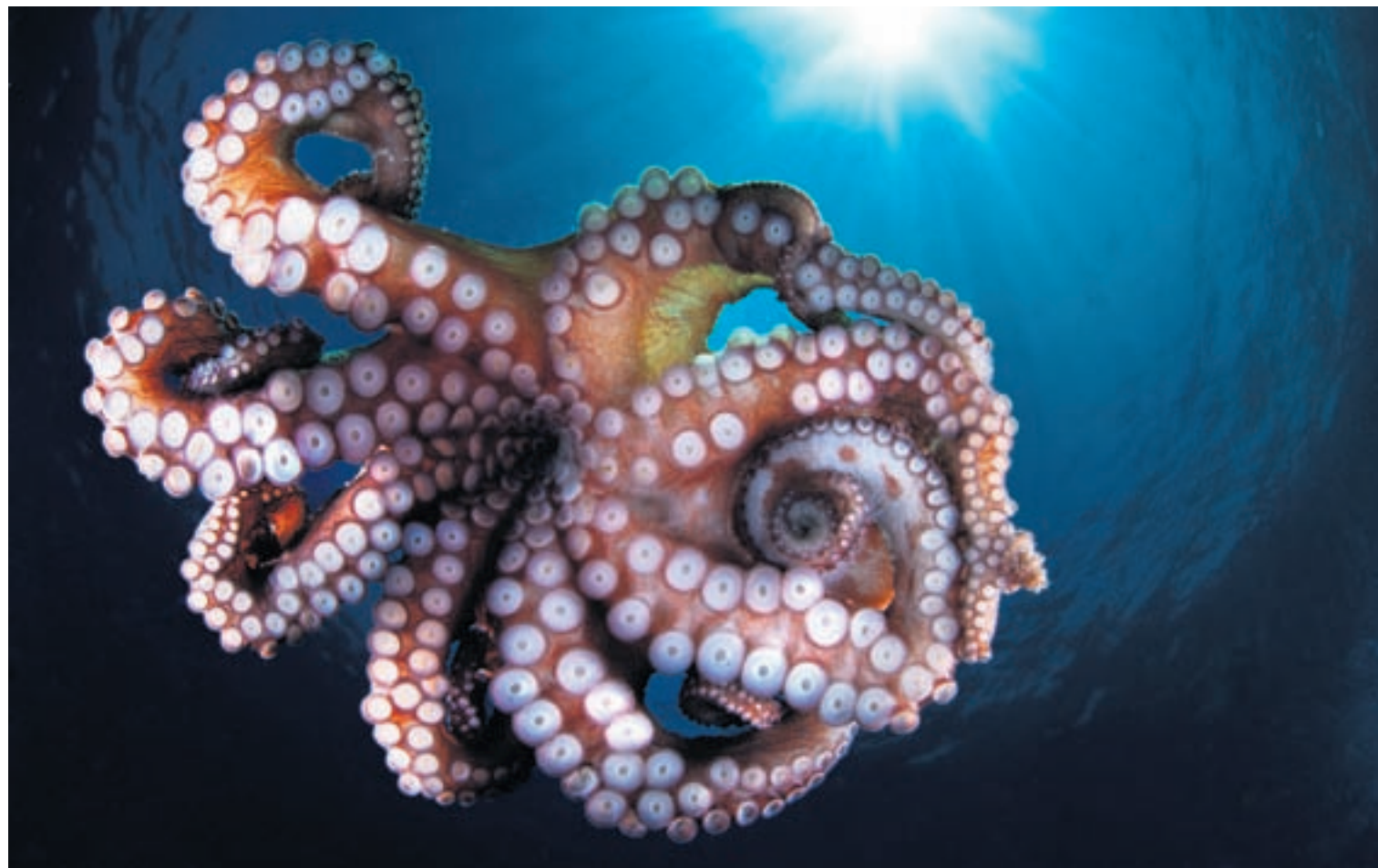
Les résultats du concours international de photos seront publiés vendredi 7 mars sur le site www.festisub.ch .