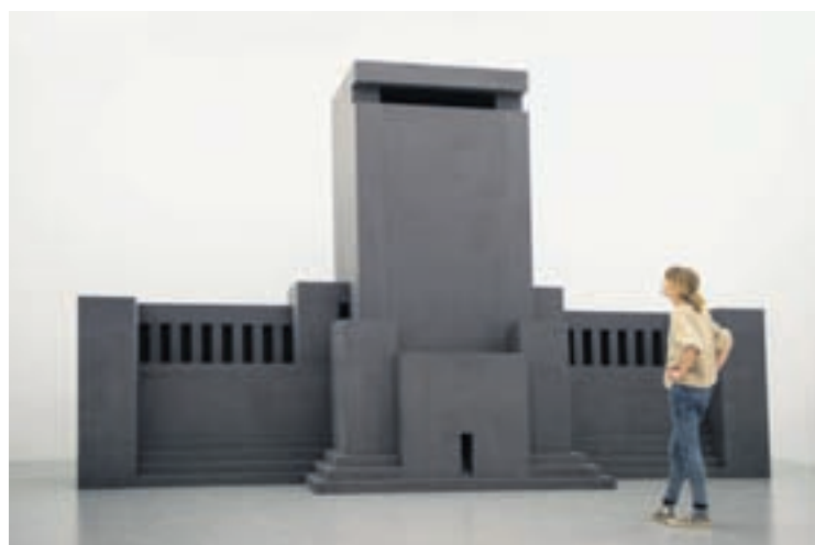
L'artiste belge Renato Nicolodi a spécialement conçu cette pièce pour la nouvelle exposition collective du CAN.

L'artiste allemande Beate Gütschow se réfère à la période romantique et baroque des XVII e et XVIII e siècles. Elle utilise la photographie à la manière