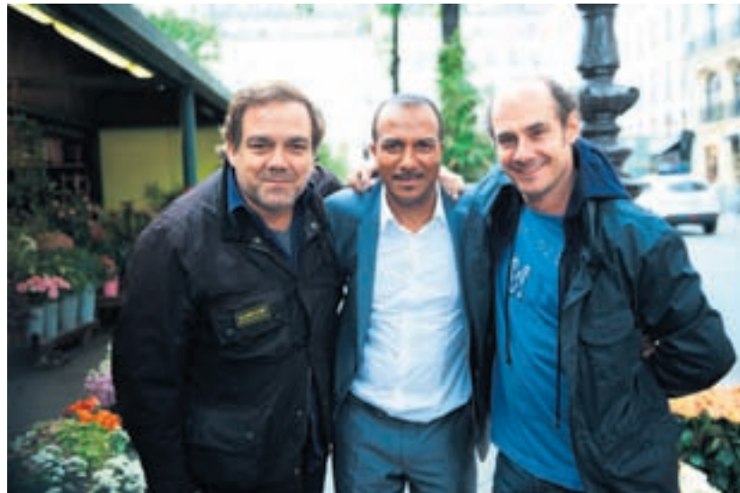
Didier Bourdon, Pascal Légitimus et Bernard Campan livrent au cinéma la suite des aventures des Trois Frères.

On retrouve les trois frères La Tour près de 20 ans après les avoir laissés. Marié, en concubinage ou célibataire, leur situation personnelle réveille déjà les premiers éclats de rire. Ils vont à nouveau être réunis par le décès de leur mère. Chez le notaire, rien ne se passe comme prévu. S'en suit une cascade d'événements plus abracadabrants les uns que les autres.