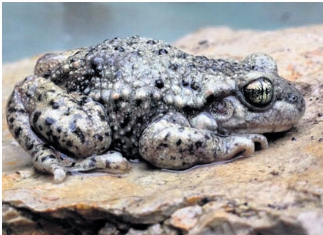
Le groupe PopVertsSol attend avec impatience le rapport sur le Parc périurbain, qui permettra notamment d'accueillir des crapauds accoucheurs.

Morgan Paratte: Un des fondements de l'école publique est d'apporter à tous les élèves l'accès à l'instruction: l'idéal de la «démocratisation de l'école» étant de donner aux écoliers d'équales chances d'accès aux savoirs. Jusqu'à présent l'école s'inscrit pourtant dans un processus qui s'articule autour de deux injonctions à priori antinomiques: celle de «trier» les élèves et celle d'en «intégrer» le plus