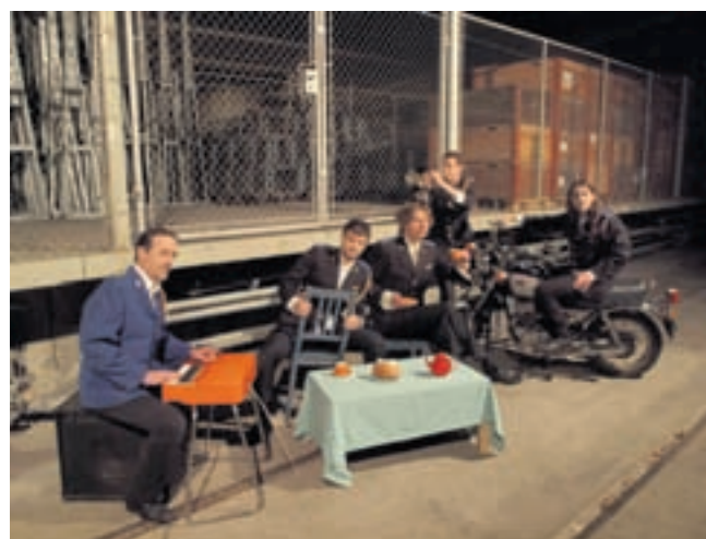
Les membres de l'ensemble vocal 5 aux Moulins ont décidé d'inviter amis et public à venir tourner la meule avec eux.

Une idée née l'automne dernier autour d'une bière. «Nous avons pu partager des concerts et être invités dans des festivals où nous avons rencontré d'autres chœurs. Nous