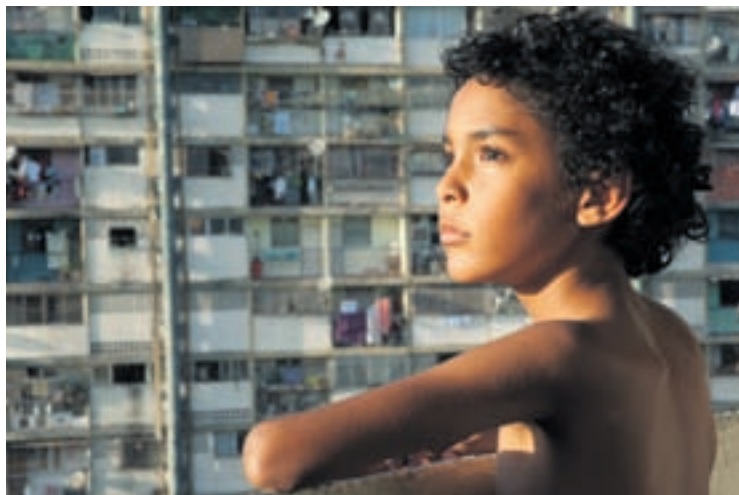
Le film «Pelo Malo» de Mariana Rondón figure dans la sélection 2014 du Festival du Sud.

A Neuchâtel, le festival s'ouvrira mercredi 23 avril à 20h30 au cinéma Rex avec la projection en avant-première du film «De la rue aux étoiles» de Verena Endtner. Née à Berne, la cinéaste présentera en personne ce documentaire consacré aux enfants des rues de Saint-Petersbourg. Le festival accueillera également à Neuchâtel Kamal Musale avec «Millions Can Walk». Ce cinéaste d'origine indienne