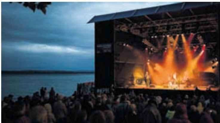
La 6 e édition de l'Auvernier Jazz Festival se tiendra fin août.

Renseignements complémentaires: Billetterie: prévente jusqu'au 28 août 2014. Points de vente et autres informations sur www.auvernierzjazz.ch .