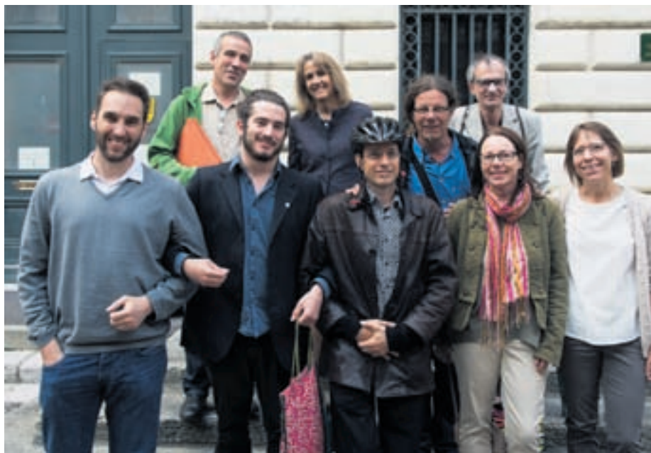
Le groupe PopVertsSol souligne que le crédit relatif au réaménagement du site des anciennes serres à Vieux-Châtel est un pas dans la bonne direction.

Avec la concurrence des grands magasins, la survie des petits commerces passe par la fidélisation de la clientèle neuchâteloise tout d'abord. Le parti socialiste ne peut qu'encourager la population à s'approprier leur centre-ville, tant au niveau des anima-