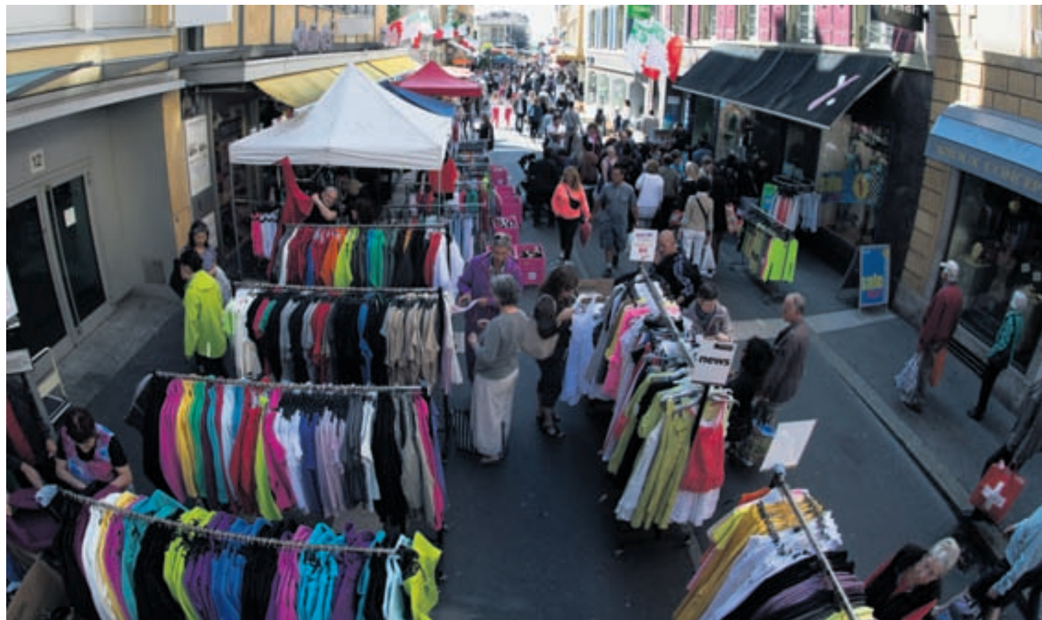
La Quinzaine neuchâteloise a rassemblé les foules au centre-ville, en particulier dans la rue du Seyon interdite à la circulation pour l'occasion.