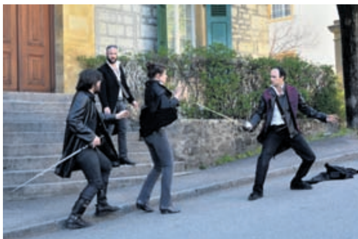
Les Batteurs de Pavés présenteront une adaptation contemporaine des Trois Mousquetaires dans les rues de Neuchâtel.

«Mais ces variantes sont souvent édulcorées et naïves alors que l'œuvre est d'une rare complexité», souligne dans le dossier de presse le metteur en scène Manu Moser. D'où la volonté de la troupe de jouer en intégralité les multiples intrigues et rebondissements