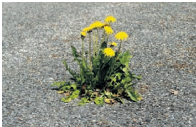
... Dame nature se défend