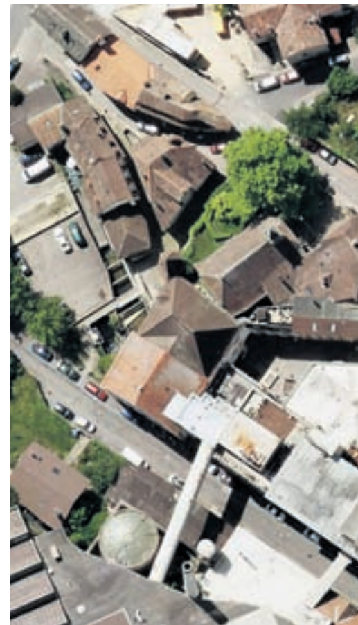
Le futur jardin public sera situé dans un magnifique parc ar

La création de ce parc est aussi une manière de soutenir les activités de la Fondation Hermann Russ, qui édite le journal pour enfants «Le petit ami des animaux». Le jardin s'ouvrira sur la future place des Battieux. Les habitants pourront le traverser pour rejoindre le lac via la tranchée couverte sur l'autoroute. «C'est une vraie vision de mobilité douce qui est proposée», a conclu Olivier Arni. (ab)