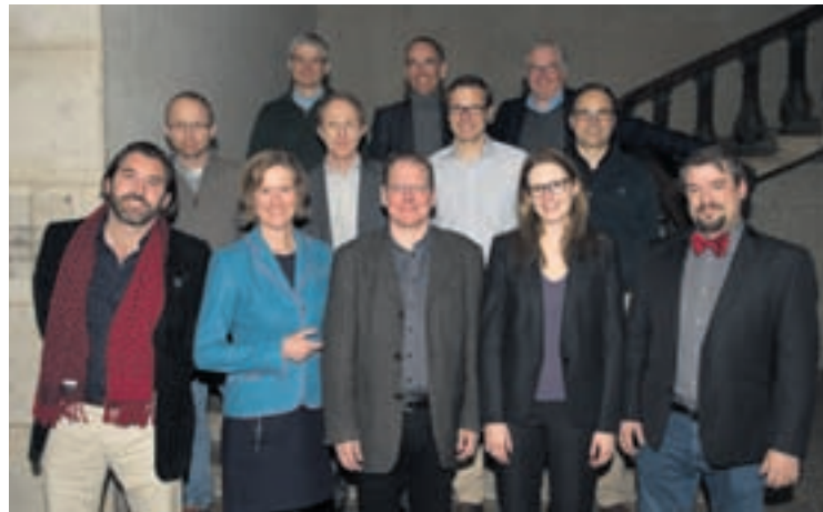
Le groupe PLR estime qu'octroyer un congé parental de cinq jours aurait été une décision responsable et juste.

La gauche souhaite que notre Ville adopte un congé parental de 20 jours pour ses employés. La même gauche en veut un de 10 jours pour le canton. Pourquoi ces différences? Notre groupe trouve vraiment dommage de créer des catégories de «privilegiés» que les autres employés ont de la peine à comprendre. Ces différences nuisent à l'image de nos employés communaux, qui font un travail remarquable. A l'heure où tout le monde doit se