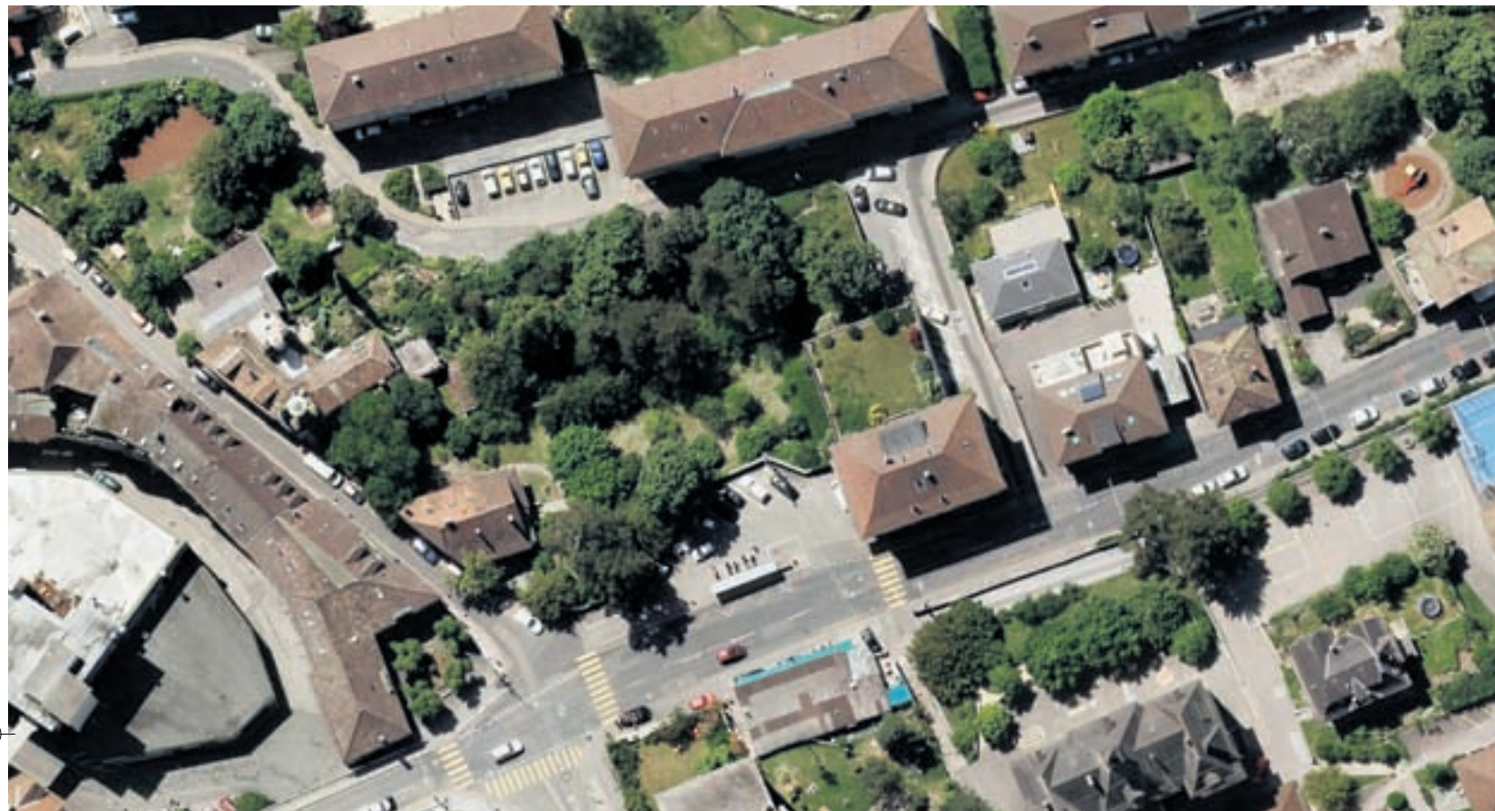
arc arboré, situé en contrebas de la rue du Clos-de-Serrières.

ction d'un congé de paternité de 20 jours pour les collaborateurs communaux