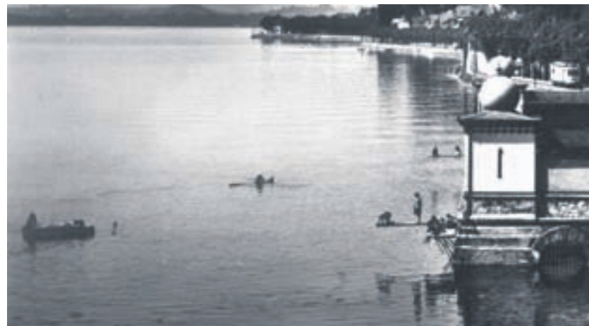
A cette période, le Bain des Dames...

A cette époque, les baigneuses sortaient de l'eau recouvertes de charmants voiles filamenteux verdâtres après avoir croisé quelques petits icebergs brunâtres et des poissons flottant le ventre en l'air. Les trempettes dans notre lac ont dû faire la fortune des élixirs et onguents proposés par les artisans-pharmaciens locaux. Le 28 juillet 1952, J.-P. P. relate dans la « Feuille d'avis »* l'inquiétude de la population. Il relaye quelques conseils pour atténuer la pollution des eaux du lac. Le journaliste rappelle que, dorénavant, il faut cesser