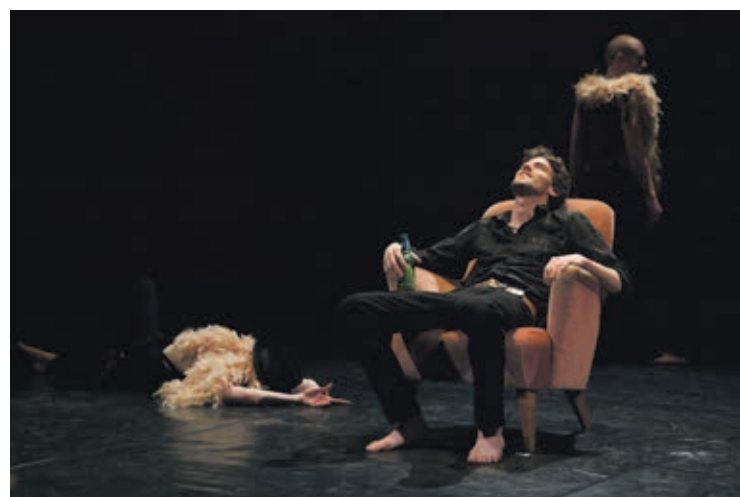
L'Homme moderne succombera-t-il à l'appel des sirènes?

Tapies dans l'ombre, trois Sirènes sont là. Par leur chant pernicieux, ces belles dangereuses, mi-femme mi-oiseau, mettent le doigt là où ça fait mal, forçant l'homme à se remettre en question. «Depuis les Manichéens, les Sirènes sont des créatures négatives. Elles symbolisent la tentation», relève Lucas Schlaepfer. Mais si les Sirènes n'étaient pas là pour détourner les hommes de leur route? Et si ces voix que nous n'écou-