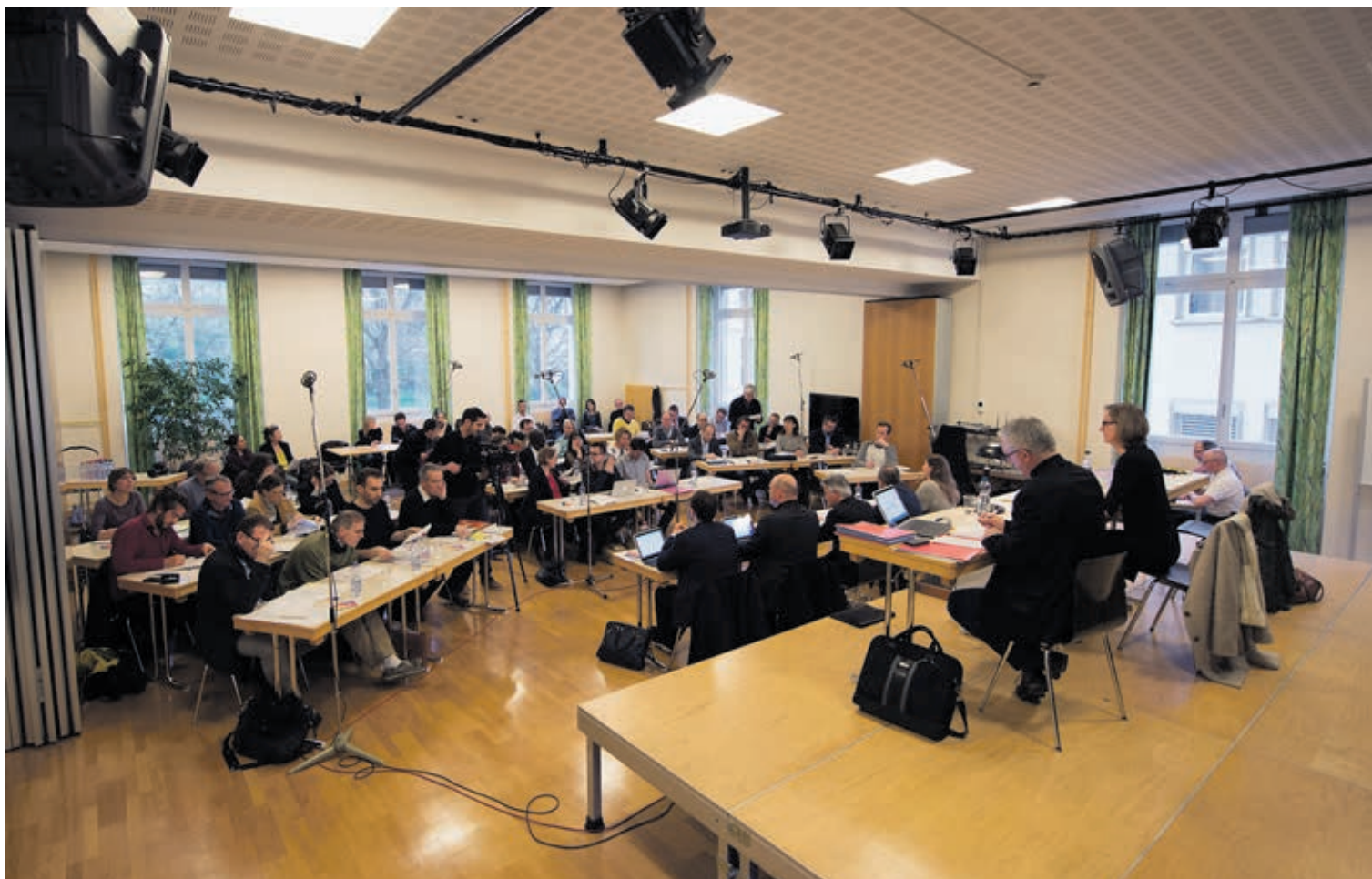
Exilé au Collège des Terreaux en raison des travaux en cours à l'Hôtel de Ville, le législatif s'est penché lundi sur la rénovation du Musée d'ethnographie, l'entretien du domaine public et l'avenir des offices postaux.

Pétition pour la défense des offices postaux