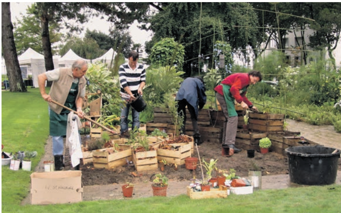
Des légumes en libre-service en milieu urbain: c'est le concept du mouvement né en Grande-Bretagne.

Le mouvement des Incroyables Comestibles fait des émules au chef-lieu