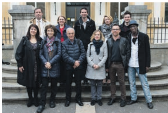
Le groupe socialiste se félicite des travaux qui ont été entrepris dans la Villa de Pury.

En conclusion, le groupe socialiste a validé ce second crédit de 3,8 millions afin de donner plus d'éclat encore à ce musée, véritable objet de promotion de la ville de Neuchâtel.