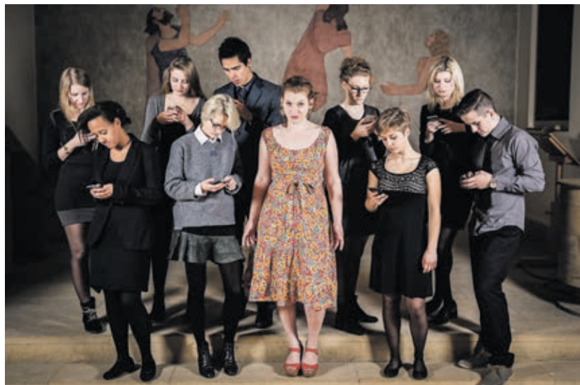
Les dix comédiens de cette troupe au grand cœur.

La pièce tout public Croyez-moi sur parole , écrite et mise en scène par Maëlle Bader, soulève un manque de communication entre des personnes qui se côtoient régulièrement. Blo-