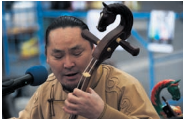
... Nouvel an chinois