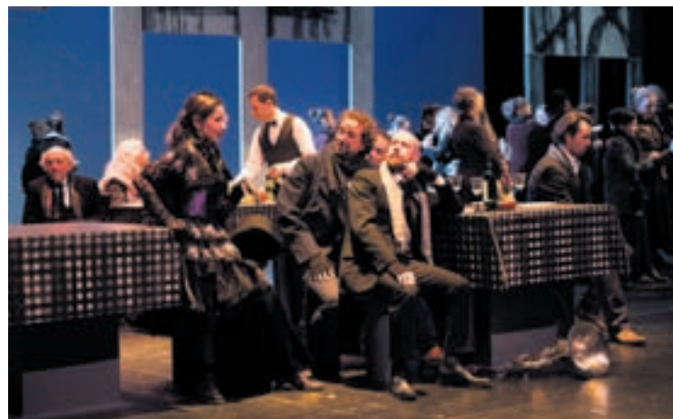
Pour ses trente ans, L'avant-scène opéra monte « La Bohème » de Puccini.

Au début, on a fait appel à des professionnels pour nous encadrer. Je n'avais que vingt ans à l'époque ! On a commencé par des concerts, puis par de petits opéras, pour finir par se lancer dans des œuvres majeures du répertoire. Durant quinze ans, j'ai