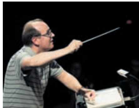
Yves Senn, à la baguette.

« La Bohème »: les 11 et 12 février à 20h et le dimanche 14 février à 17h au Théâtre du Passage. Direction: Yves Senn. Mise en scène: Alexandre de Marco. Réservations: 032 717 79 07 ou www.theatredupassage.ch .