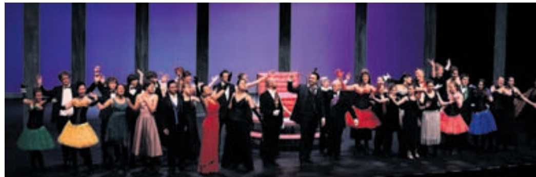
L'avant-scène opéra dans « La Veuve joyeuse » de Franz Lehár, créé l'an dernier au Théâtre du Passage.