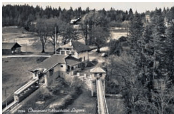
1910: Station supérieure du funiculaire La Coudre-Chaumont.