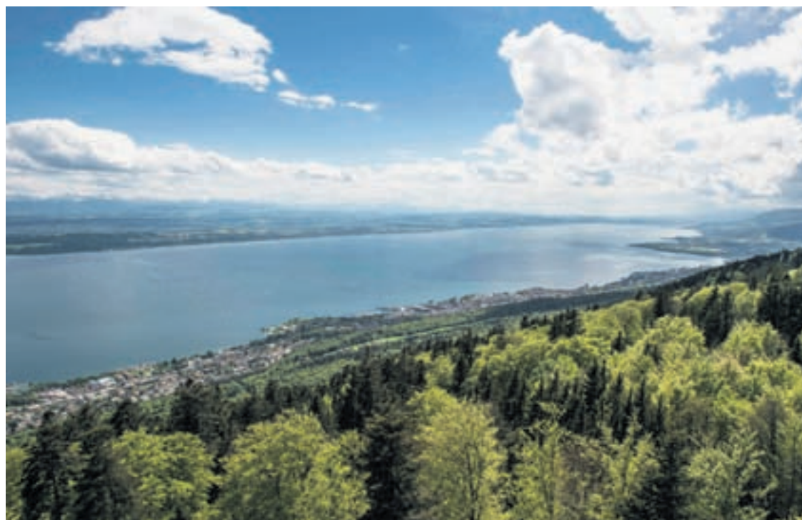
Les Conseil généraux de Corcelles-Cormondrèche, Neuchâtel, Peseux et Valangin ont dit oui à la fusion.