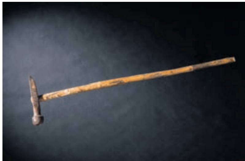
Marteau à casser les pierres. JBN.

Démantez un marteau, il reste le fer, qui désigne la partie métallique active, également lorsqu'elle est en acier. Le fer du marteau possède un œil: l'ouverture transversale dans laquelle on insère le manche au centre de gravité de la tête. Un petit coin nommé angrois, enfoncé dans l'œil, immobilise le manche. Le fer oppose dans un même plan, de part et d'autre de l'axe du manche, la table et une partie amincie, la panne.