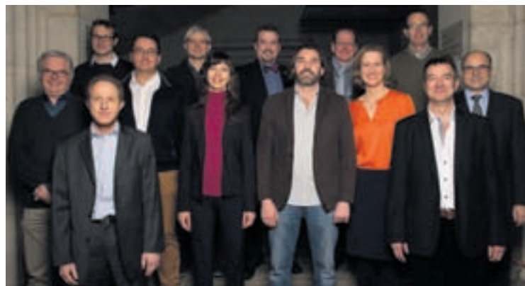
Le PLR défendra avec enthousiasme les valeurs libérales et humaines dans le processus de fusion.

Au cours du long et patient processus ayant conduit le Conseil général de Neuchâtel, ainsi que ceux de nos communes voisines, à accepter le projet de fusion pour qu'il puisse être soumis au vote populaire, de nombreuses préoccupations aussi légitimes que fondamentales, liées à nos identités respectives, au projet de société proposé, au maintien des prestations offertes à la population et à des garanties de travail pour nos employés communaux actuels, ont été intégrées au projet, de manière à ce qu'il devienne véritablement celui de chacune et de chacun.