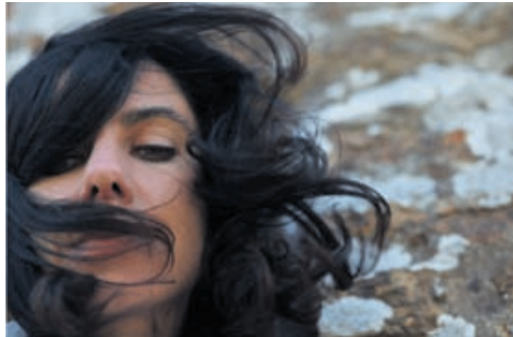
PJ Harvey, une artiste qui s'engage!

Ado, elle suit des cours de sculpture au Yeovil Art College. C'est à cette époque qu'elle joue dans ses premiers groupes, Bologna et Automatic Dlamini. En 1991, à 22 ans, elle