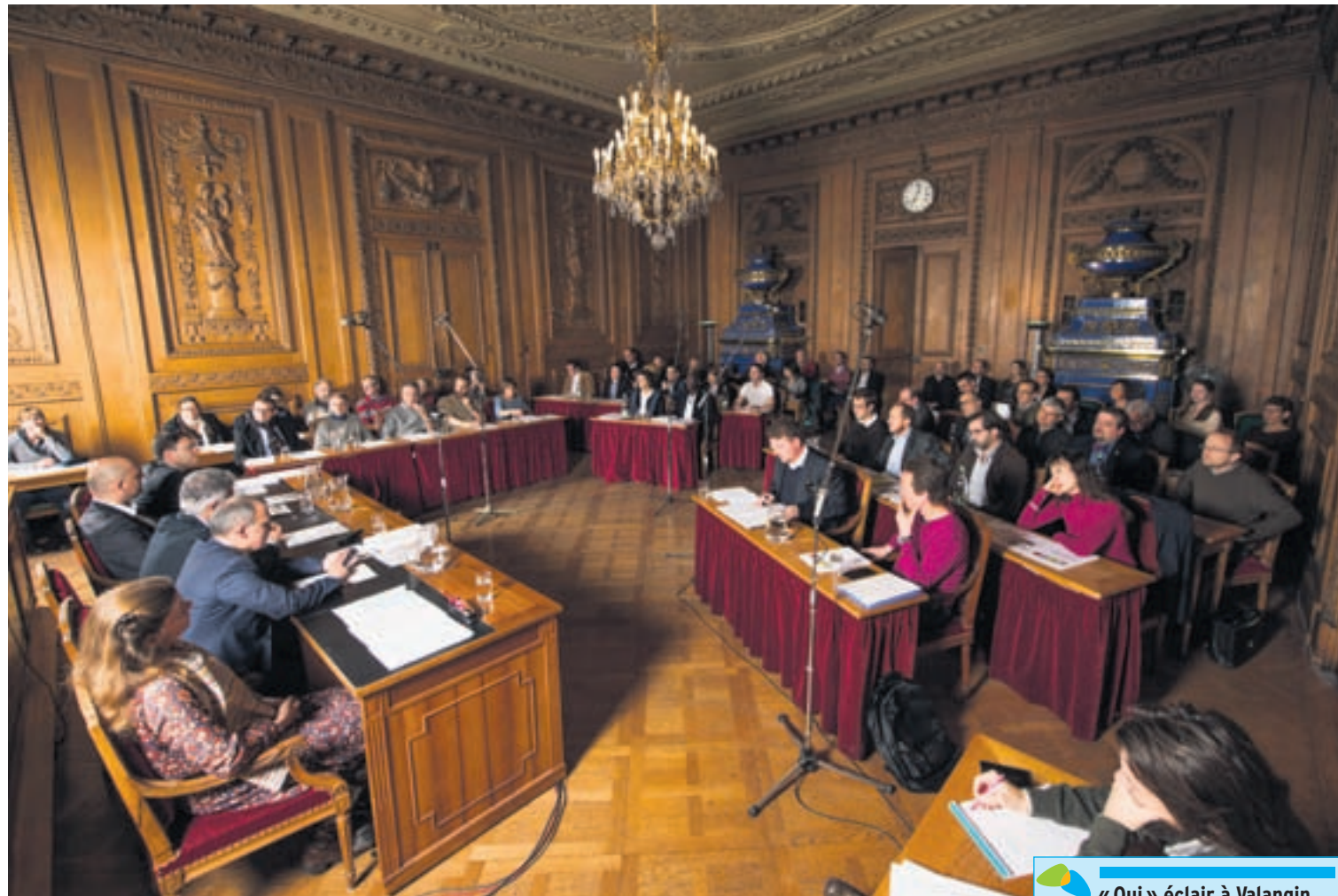
Le peuple dira le 5 juin s'il approuve la fusion de Neuchâtel avec Valangin, Peseux et Corcelles-Cormondrèche acceptée lundi soir par les Conseils généraux des quatre communes.

optent la convention à quatre par 26 voix contre 13