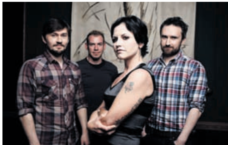
The Cranberries.

Pour sa 16 e édition, Festi'neuch a récemment annoncé les premiers artistes composant son affiche 2016: Skunk Anansie (UK), The Cranberries (IRL), Cypress Hill (USA), Cœur de pirate (CAN), Parovoz Stelar (AUT), Bigflo & Oli (FR), Selah Sue (BEL), Gipsy Kings (FR).