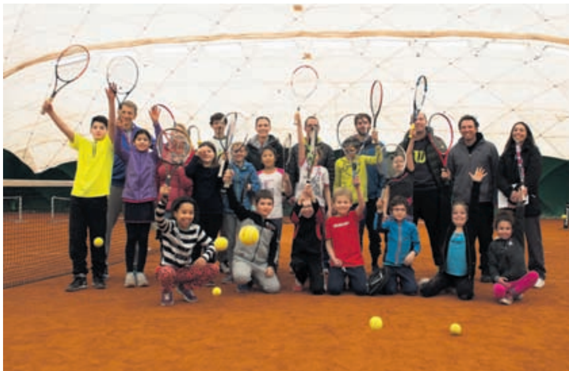
Fort de 450 membres, le Club de tennis de Neuchâtel pourra rester encore trente ans aux Cadolles.

Reflète de la dernière séance du Conseil général