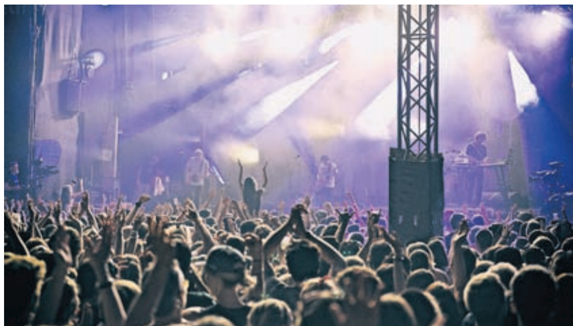
Une édition 2016 avec un maximum de contenu musical, de belles découvertes et des groupes suisses qui montent.

Pascal Sandoz Conseiller communal Directeur sécurité, infrastructures et énergies