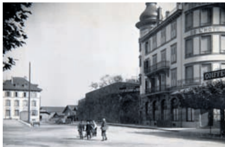
Place de la Gare vers 1900