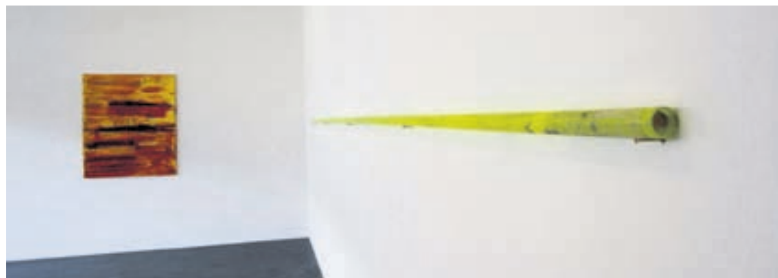
Smallville confronte des reliques d'Expo.02 à des œuvres d'art contemporain.

Un morceau de bâche, un roseau lumineux, des galets en équilibre, une boîte de «merde d'artiste»: les vestiges d'Expo.02 s'exposent à Smallville, un nouveau lieu d'art contemporain ouvert en décembre dernier par quatre artistes neuchâtelois dans leur atelier commun, situé près de la rue des Draizes. Le vernissage a lieu ce vendredi à 18 heures.