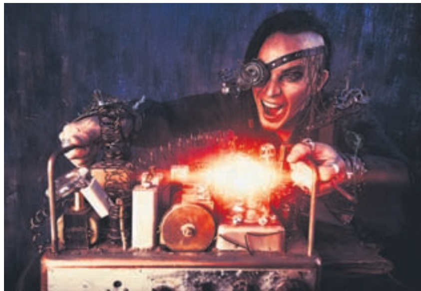
Arrêtons de jouer à l'électron... • Photo: sp

Quarante ans de production d'énergie et une éternité pour en effacer les traces mortelles. Un cimetière radioactif que nous offrons aux générations futures pour les 100'000 prochaines années. Il a fallu attendre