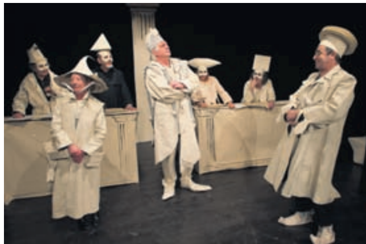
Le Théâtre Tumulte et la Comédie de Serrières jouent «Pantagruel» de Rabelais.