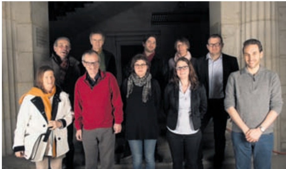
Le groupe PopVertsSol salue l'initiative du Conseil communal de mettre sur pied un groupe de médiateurs pour venir en appui aux employés communaux.

Dans ce contexte, l'initiative du Conseil communal de mettre sur pied