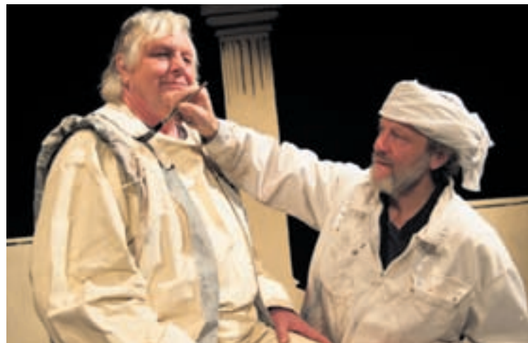
Théâtre Tumulte: Paxon apporte les dernières retouches au costume de Pantagruel.