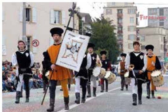
A gauche, festivités des dix ans du jumelage dans la vieille ville d'Aarau, 2007. A droite, défilé costumé de Biturgensi sur l'avenue du 1 er -Mars, à la Fête des vendanges la même année. • Photos: Stefano Iori