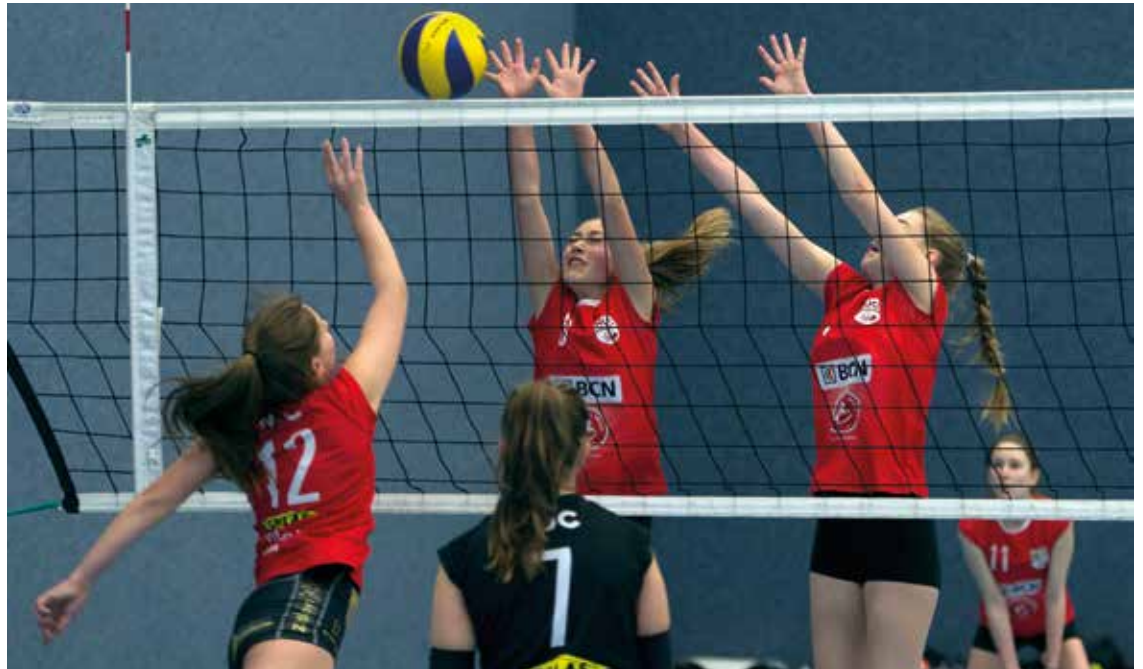
L'équipe M17 du NUC volleyball sera l'unique représentante neuchâteloise lors du tournoi «Final Four».

Directeur de l'urbanisme, de l'économie et de l'environnement