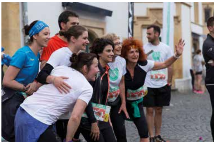
La course se termine place des Halles dans la bonne humeur. • Photo: sp

Coureuses et coureurs seront-ils aussi nombreux que l'an dernier (plus de 500 participants) pour la deuxième édition de «Wake up and run», un événement qui allie course matinale et petit-déjeuner de choc, qui aura lieu le 19 mai prochain à Neuchâtel? A ce jour, quelque 400 personnes étaient en tous les cas déjà inscrites, et le délai d'inscription est fixé au 14 mai. De toutes les courses prévues en Suisse, c'est à ce stade celle qui connaît le plus grand succès!