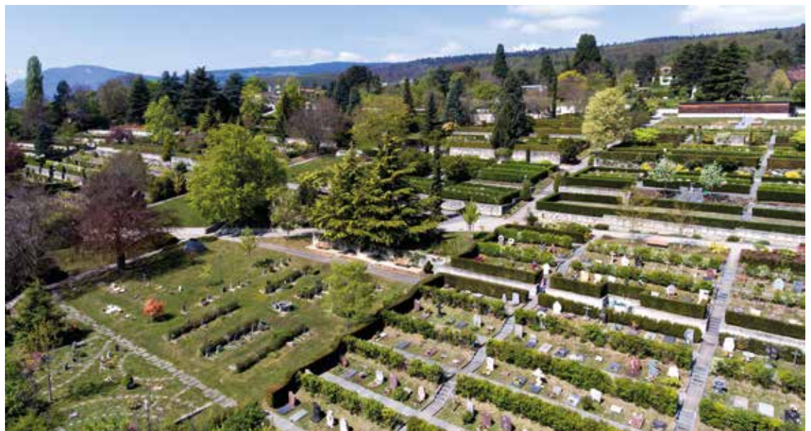
Un crédit de 750'000 francs a été accordé pour des aménagements au cimetière de Beauregard.

Le groupe socialiste estime que la Ville doit jouer un rôle clé dans la mise en place d'une politique de développement diversifié et harmonieux de la vie nocturne. Au-delà de l'activité économique que génère cette dernière, elle participe de manière importante à la qualité de vie culturelle et sociale des habitants. Les soirées passées à discuter, refaire le monde ou simplement se changer les idées... voilà à notre sens des composantes essentielles des liens sociaux qui permettent à chacun de s'épanouir. Nous sommes convaincus qu'une ville qui vit, c'est notamment une ville qui fête!