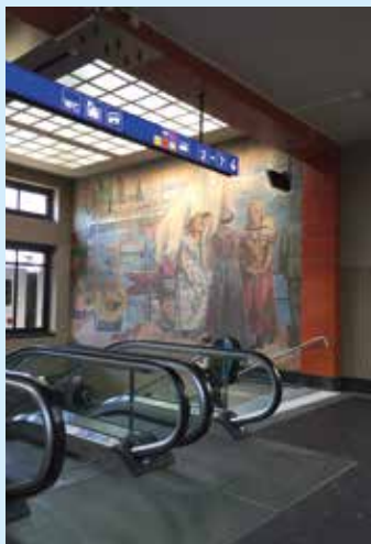
Les fresques de Dessouslavy seront mises en valeur par un nouvel éclairage et des notes explicatives.

Inaugurée en 1936, la gare de Neuchâtel comporte notamment des dallages en pierre naturelle qui parcourent le sol du bâtiment principal et font partie intégrante de l'édifice. La réfection du sol prendra en compte cette caractéristique et conservera le dallage existant. Les grandes fresques, réalisées par le peintre chaux-de-fonnier Georges Dessouslavy entre 1936 et 1939, restaurées au début des années 2000, seront mises en valeur par un éclairage adapté et des notes explicatives.