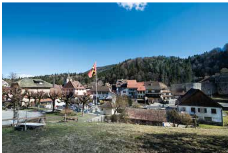
La commune de Valangin devra se positionner quant à son avenir et à un éventuel rapprochement avec la Ville de Neuchâtel.