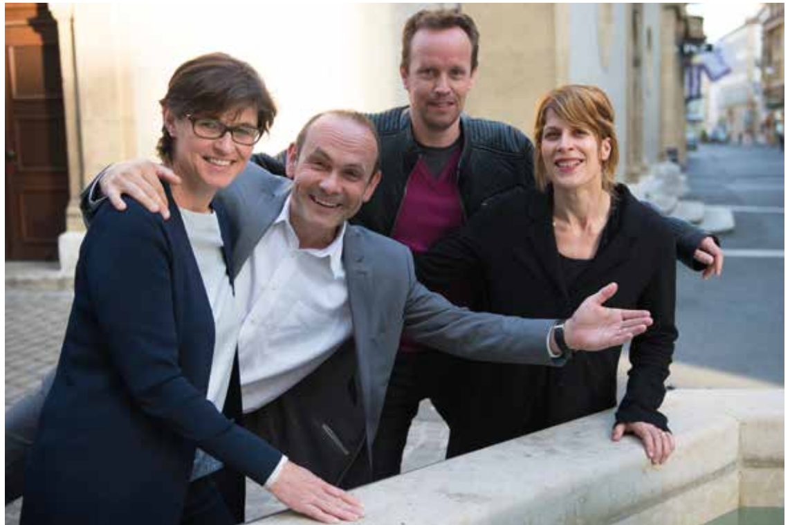
Le groupe Vert'libéraux-PDC devant la fontaine du Lion.

« Aussi paradoxal que cela puisse paraître, chaque cimetière est un lieu de vie, un espace de sérénité indissociable de tout habitat urbain. »