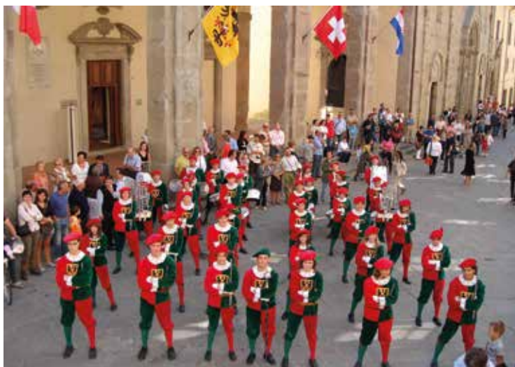
Les Armourins à Sansepolcro en 2007 pour les dix ans du jumelage. On aperçoit la maison de commune et le Dôme au fond.

Du football également en perspective, avec le Tournoi international