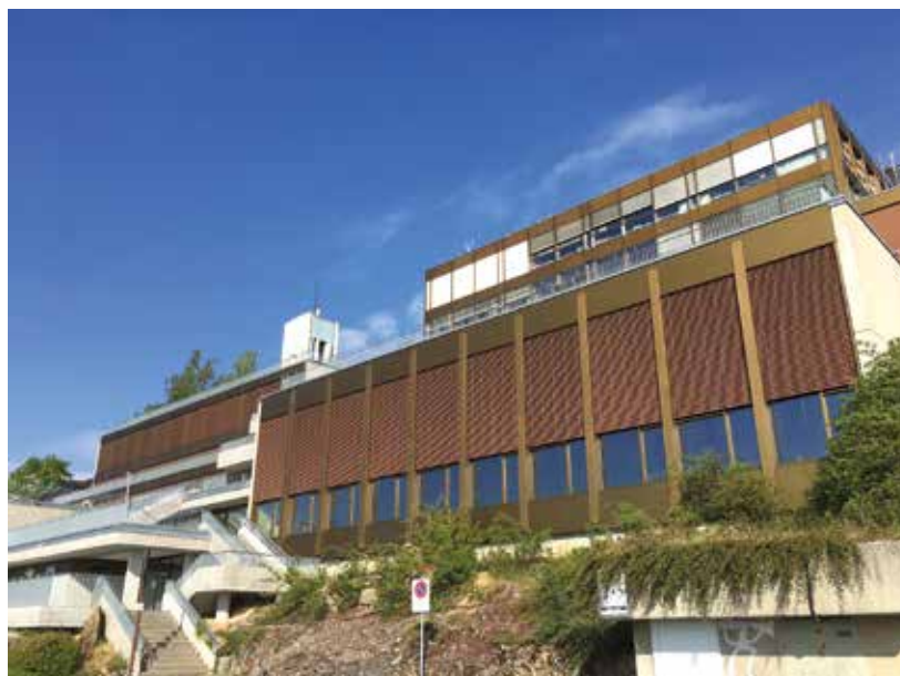
Le collège du Crêt-du-Chêne après son assainissement. Sa consommation d'énergie a été divisée par 3 alors que ses émissions de CO 2 sont passées de 330 à 20 tonnes par année.

L'analyse détaillée de ces chiffres met en évidence le fait que le secteur des transports est le mauvais élève de la classe. En effet, ses émissions ont augmenté de 4% en 2015