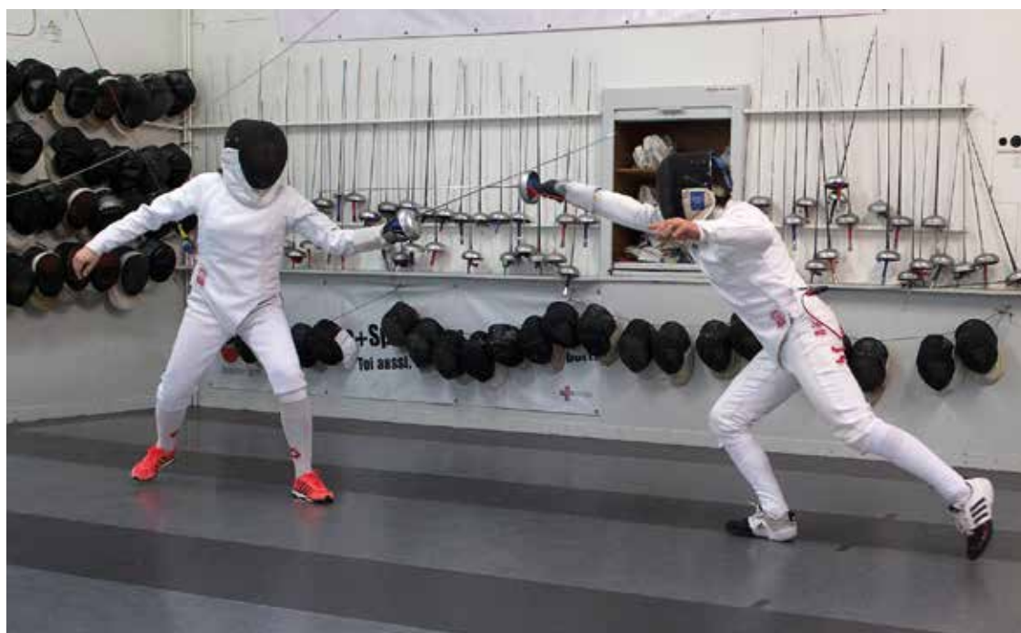
La société d'escrime fête cette année les 25 ans de son Tournoi des 3 Mousquetaires, qui aura lieu le week-end du 20 et 21 mai.