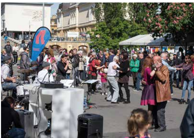
Comme l'an dernier, un bal musette se tiendra au port le dimanche après-midi.