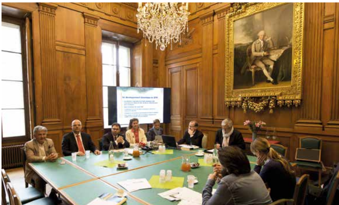
Le Conseil communal présentait in corpore les comptes de la Ville à la presse.

Les décisions cantonales ont pesé sur les comptes 2016 de la Ville de Neuchâtel: présentés hier par le Conseil communal in corpore, ils bouclent sur un excédent de charges de 4,82 millions de francs. Un résultat inférieur au budget, dû essentiellement à des facteurs extérieurs non maîtrisables - en particulier la répartition de l'impôt entre canton et communes et la baisse du taux d'imposition des personnes morales. D'importants efforts ont été réalisés parallèlement par le Conseil communal pour compenser ce manque de recettes.