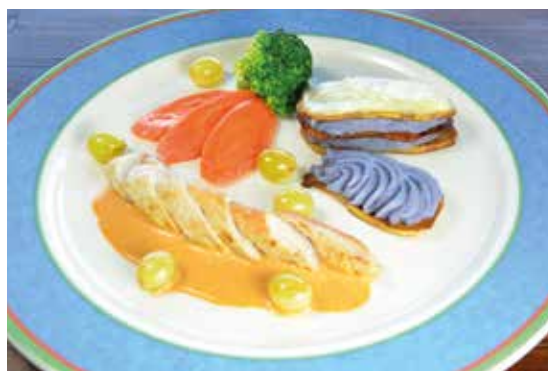
Filets de lapin au Riesling.