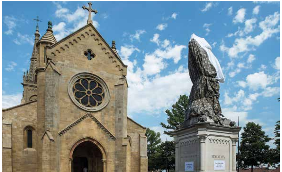
L'artiste sud-africaine Ledelle Moe dévoilera vendredi 23 juin son installation temporaire sur le monument Farel.

Directrice de l'Éducation, de la Santé et de la Mobilité