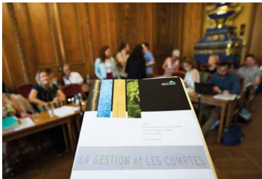
Les comptes 2016 ont été acceptés à l'unanimité lundi soir.

Teintés de rouge pour la première fois depuis 2008, les comptes 2016 de la Ville de Neuchâtel ont néanmoins été acceptés à l'unanimité, lundi soir par le Conseil général, qui s'est ému en particulier des conséquences des reports de charges du canton sur les finances communales. Et si la faiblesse des investissements est un sujet de préoccupation pour tous les groupes, la plupart ont salué le nombre de projets réalisés par la Ville l'an dernier.