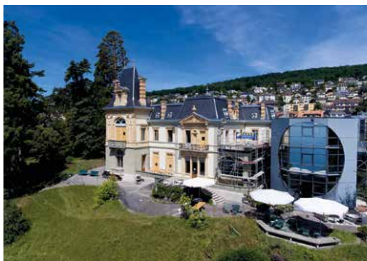
La Villa de Pury a nécessité d'importants travaux de restauration.

En parallèle, plusieurs années de démarches et de longs mois de tra-vaux ont permis de développer un programme de rénovation consistant à déplacer l'administration du Musée dans les combles de la Villa et à attri-buer l'entièreté des étages nobles à l'exposition. L'option choisie par Jean