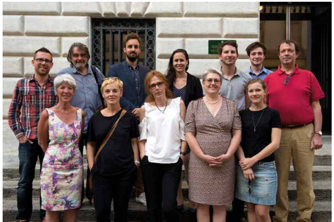
Pour le groupe socialiste, qui se dit satisfait mais prudent, l'essentiel est de garder le cap.

Satisfaction, mais prudence: à l'avenir, il conviendra d'intégrer le facteur cantonal dans l'établissement des budgets, les perspectives