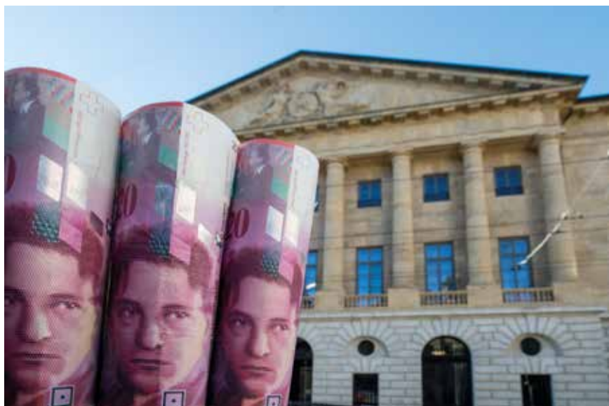
Le Conseil général a accepté les comptes 2016 à l'unanimité.

ont été bien inférieurs à ceux qui avaient été prévus au budget. Ce qui n'est pas une bonne nouvelle! Une collectivité publique, comme une entreprise, se doit d'investir sans cesse, pour améliorer les conditions-cadres et, partant, la qualité de vie, ou au moins pour maintenir le même niveau de qualité, mais aussi parce que les investissements publics boostent l'économie et contribuent à l'attractivité de la ville.