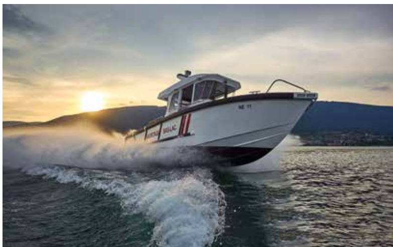
La Ville de Neuchâtel a soutenu la construction du nouveau bateau, d'un coût total de 425'200 francs, à hauteur de 50'000 francs.

Arens VI possède bien des avantages par rapport à son prédécesseur, un semi-rigide de type Tornado. «Nous sortons souvent par gros temps. La nouvelle unité est désormais équi-