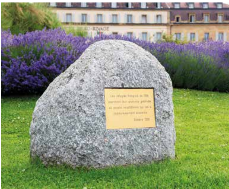
Inauguré en 2006, ce mémorial rappelle la répression sanglante de 1956 et le douloureux exil des Hongrois ayant fui leur pays.