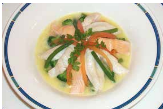
Nage de poissons du lac à la Perdrix Blanche et aux primeurs.