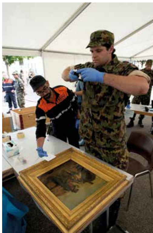
L'évacuation des œuvres s'est faite avec grand soin.