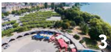
Après le feu vert du Conseil général, le réaménagement des Jeunes-Rives peut aller de l'avant.