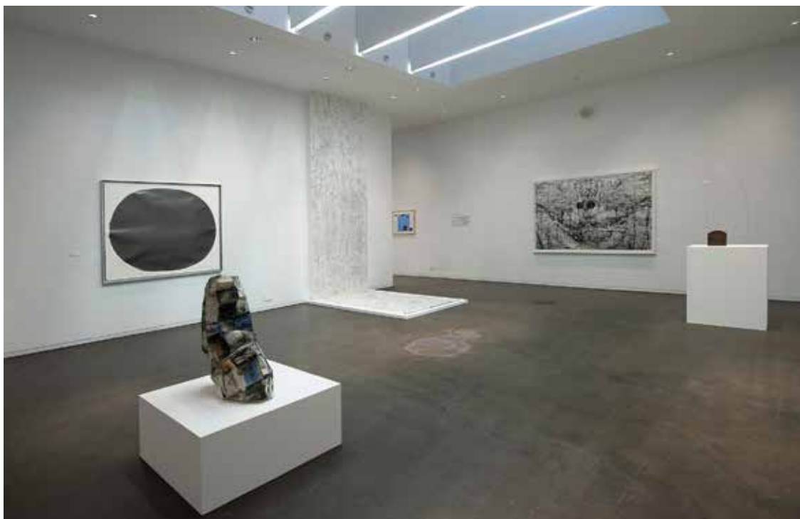
«Sous les dehors du dessin» réunit une cinquantaine d'œuvres de 1903 à nos jours.