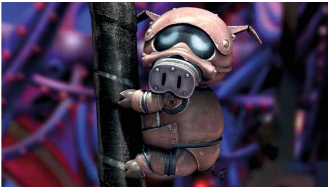
« Yatterman » de Miike Takashi, invité d'honneur du Niff, est l'une des perles à découvrir dans le cadre de la rétrospective « Rions dans l'espace ».