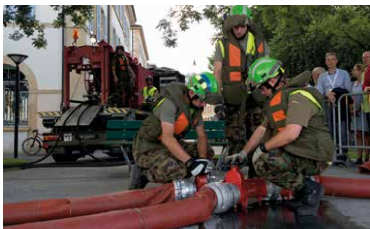
L'armée installe une conduite d'eau depuis le lac.