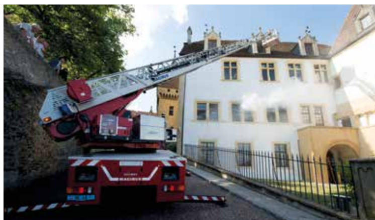
Simulation d'incendie au Château.