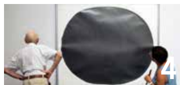
Dans son exposition d'été, le Musée d'art et d'histoire se penche « Sous les dehors du dessin ».