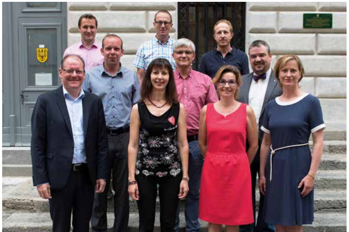
Pour le groupe PLR, le marché de Neuchâtel participe à l'attrait et à la qualité de vie du centre-ville.

Ces déclarations ont étonné et inquiété aussi bien les maraîchers qu'une partie de leur clientèle, forte-