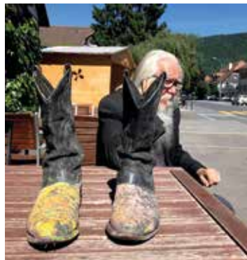
Vernissage: 30 juin dès 18h à l'espace Smallville, chemin des Péreuses 6. Exposition visible du 1 er au 22 juillet. Infos www.smallville.ch

Un grand nombre d'artistes, dont de grandes pointures, entretiennent un rapport intime avec leurs chaussures. Celles-ci nous livrent des informations précieuses sur leur propriétaire comme ses goûts ou son orientation politique. Eminemment plus bavardes que des pinces négligées croupissant dans une tasse à café remplie de térébenthine, ces chaussures divulguent de véritables secrets sur les pratiques artistiques. Qu'elles soient maculées de peinture comme les bottes en serpent à sonnette d'Olivier Mosset (photo) ou impeccables comme les mocassins italiens bleu marine de Xavier Veilhan, les chaussures témoignent parfois mieux que l'espace d'atelier de la manière dont les artistes produisent de l'art.