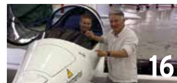
SolarStratos n'a pas pu survoler le Saint-Laurent, mais sa mission en Amérique du Nord est un succès.