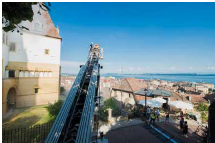
Une volontaire évacuée par l'échelle mobile.

A Neuchâtel, le 20 juin, l'armée, la Protection civile et les pompiers du SIS ont maîtrisé un incendie (fictif!) au château grâce à une conduite d'eau montée depuis le lac. Une importante collection prêtée par un prestigieux musée new yorkais a aussi été mise à l'abri. Ces exercices se sont déroulés en présence d'invités issus des milieux de la sécurité, en Suisse romande et en France voisine. En voici quelques images. (eg)