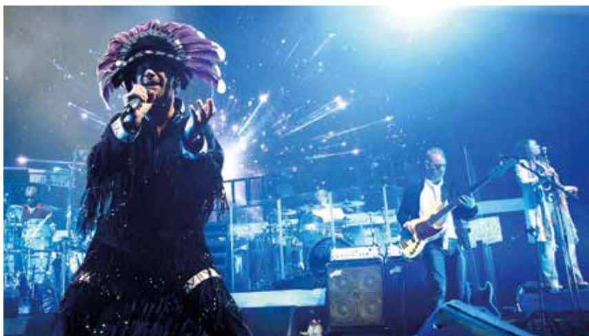
Jay Kay en plein groove!

Jamiroquai, c'est le projet musical de Jason Kay. Né à Healing, près de Blackburn, en Angleterre, en 1969. Elevé par sa mère, il ne connaît son père qu'à l'âge de 29 ans. Depuis sa plus tendre enfance, Jason est accro au rhythm'n'blues et à la soul des seventies! Son grand gourou, c'est Steve Wonder. Après une adolescence plutôt mouvementée (gros problèmes d'adaptation scolaire, aucune envie de travailler à l'école, etc.), sa mère ne le supporte plus et le met à la porte. Jason est obligé de s'assumer et de papillonner entre petits boulots et endroits où on veut bien l'héberger. A un moment donné, il est même obligé de vivre dans la rue. Dans la mesure où, pour sa survie, il ne peut pas faire autre-