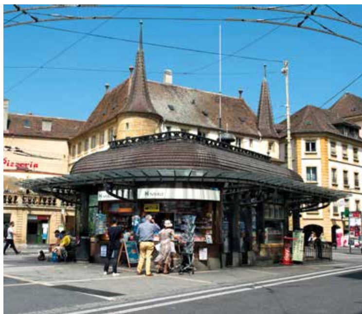
Le kiosque de la place Pury a été doté d'une large marquise pour abriter les voyageurs et embelli par un décor art nouveau.