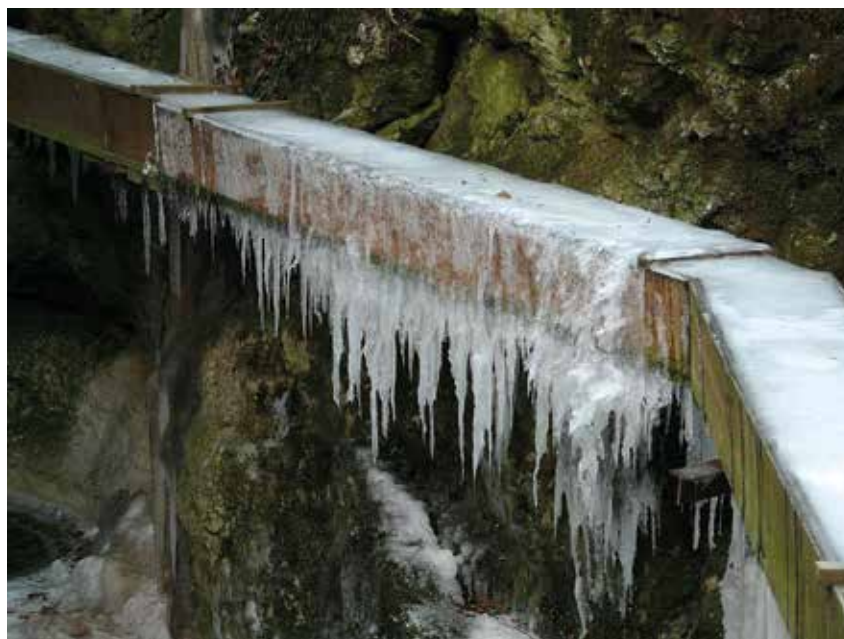
Photo fraîcheur à suspendre, le Gor de Vauseyon au cœur de l'hiver.

Il existe quelques solutions locales pour diminuer le stress thermique tout en redécouvrant la ville... C'est l'occasion d'aller explorer nos zones «fraîcheur» en ville: au bord de nos cours d'eau ou dans nos vallons ombragés. En plus, c'est gratuit!