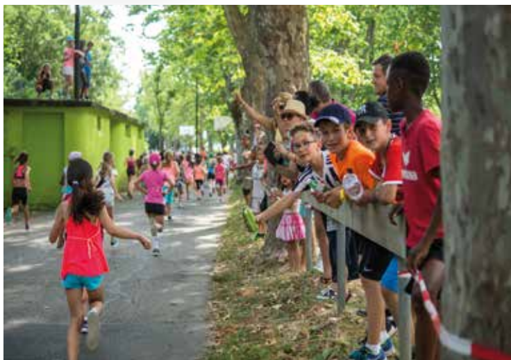
Quelque 600 élèves des collèges de la Ville se sont mesurés à la course jeudi dernier sur la plaine du Mail.

« Allez! Encore un petit effort, tu vas y arriver! »: sous les encouragements de leurs parents et de leurs copains, quelque 600 élèves âgés de six à onze ans ont participé jeudi à l'ombre des grands arbres de la plaine du Mail au 38 e marathon des écoliers de la Ville de Neuchâtel. C'est l'une des deux manifestations qui vient traditionnellement clore l'année scolaire.