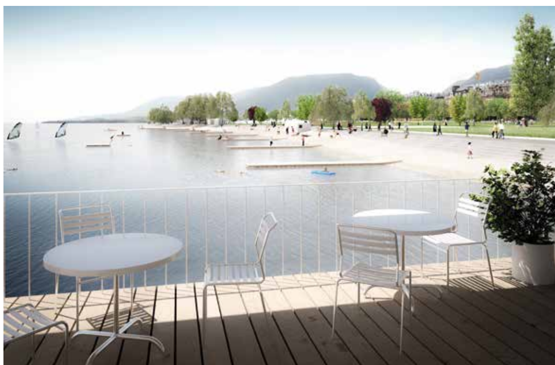
L'aménagement prévu pour les Jeunes-Rives a été accepté sans opposition par le Conseil général, dont plusieurs groupes ont cependant posé des questions liées aux aspects financiers.

Ces éléments importants n'ont pas empêché notre groupe de saluer les choix environnementaux proposés tant au regard de la nature que de la mobilité douce, et en particulier du parc solaire prévu.