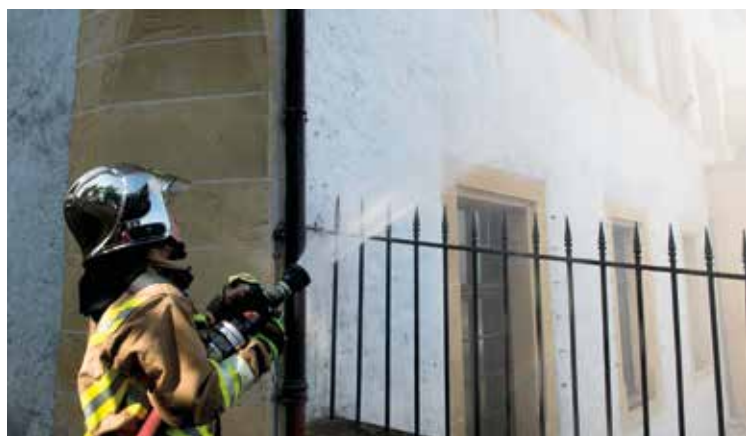
Le Service d'incendie et de secours (SIS) en pleine action.