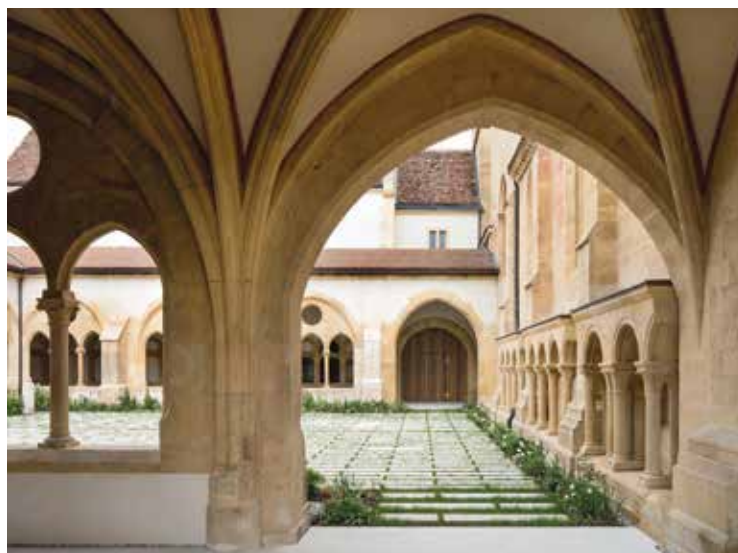
Le centre du préau sera végétalisé et le revêtement travaillé de sorte à faciliter son accessibilité.

Les acteurs spécialisés (Patrimoine Suisse – section Neuchâtel, EREN – paroisse de Neuchâtel, Office fédéral de la culture, Société des concerts de la Collégiale et corporations bourgeoises de la ville) ont aussi été