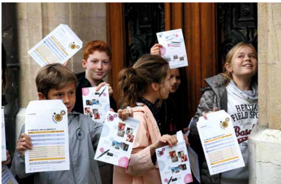
Les enfants et leurs sourires seront prochainement sur le pas de votre porte.

les fléaux comme la pauvreté ne le concernent que de façon très éloignée. Et pourtant, en 2016, ce sont plus de 4'000 familles touchées par des problèmes financiers qui ont été aidées dans la région grâce à la vente des timbres et des autres articles Pro Juventute. Le phénomène est encore plus préoccupant sur le plan national puisque 7% de la population