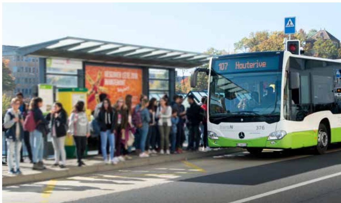
Le Conseil communal veut pérenniser l'Abo-Ado et l'étendre aux 20-25 ans. • Photo: Stefano Iori

Directrice de l'agglomération, de la sécurité et des infrastructures