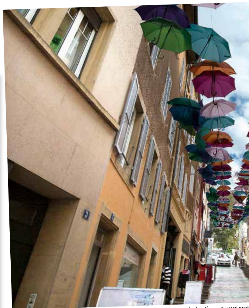
Enlevés la semaine dernière, les parapluies des Chavannes ne seront plus là pour vous prot

L'arrivée de la pluie rime avec la fin des baignades en extérieur mais cela ne vous oblige pas à ranger votre maillot de bain jusqu'au retour des beaux jours, bien au contraire ! La piscine du Nid-du-Crô est équipée d'une pataugeoire et de trois zones de bain distinctes : un grand bassin de natation, un espace plongeoir avec des tremplins perchés à 1 mètre et à 3 mètres de hauteur ainsi qu'une partie avec fond réglable (sur réservation) pour apprendre à nager en sécurité. Les horaires d'ouverture au public sont particulièrement souples : 8h - 22h non stop du lundi au jeudi, 8h - 19h30 le vendredi, 8h - 18h30 le samedi et 9h-19h le dimanche. De quoi pouvoir faire quelques brasses après le travail pour retrouver une certaine zénitude et conserver le corps de rêve que vous avez entretenu durant la période estivale.