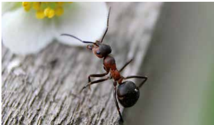
La première des conférences est agendée au 1 er novembre. Vous découvrirez 60 ans d'une colonie de fourmis.

La Société neuchâteloise des sciences naturelles (SNSN) propose un cycle de conférences 2017-2018 sur les thèmes les plus variés. Les quatre premières, cette année, permettront de satisfaire les mordus de la nature ainsi que les passionnés de collections et de géologie.