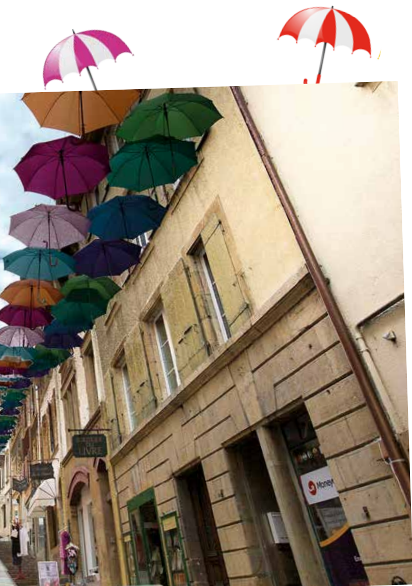
Préparer des intempéries à venir!