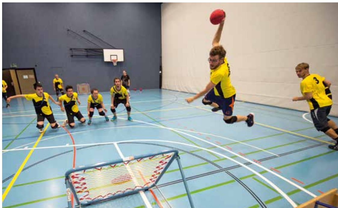
Un sport sans contact pour un max de plaisir.