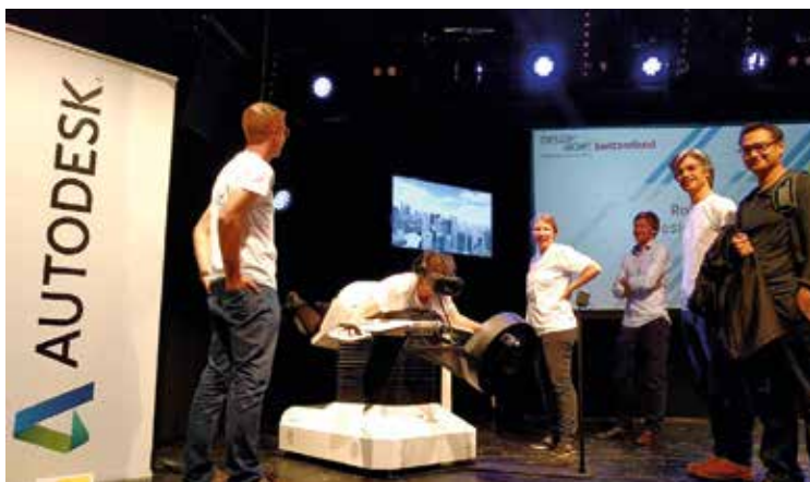
L'an passé, les expériences de réalité augmentée avaient séduit les participants.

Après le succès de la première édition avec ses 450 participants, la société Autodesk organise une nouvelle Design Night demain jeudi 19 octobre dès 18h à la Case à Chocs à Neuchâtel. Au programme de cette soirée sur le thème de l'« Augmented Age » : réalité virtuelle, réalité augmentée, réalité mixte et impression 3D. Objectif de la société américaine, implantée à Neuchâtel : démocratiser les nouvelles technologies auprès de la population. Dans une ambiance décontractée et en musique, les invités explorent le design et la création sous un angle nouveau, par le biais d'activités « makers » à la pointe de la technologie et d'une conférence donnée par un expert.