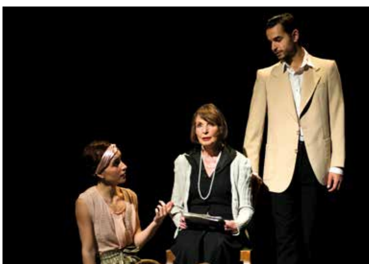
Les souvenirs sont-ils une source de problèmes ou de solutions?

Qui est-elle vraiment et qui sont ces autres? Plusieurs outils dramaturgiques sont utilisés pour faire passer un maximum d'émotions aux spectateurs, la danse appuie ce que le texte est incapable de faire passer et la musique est un fil conducteur qui souligne les moments de fracture, de douceur ou d'angoisse. C'est le groupe neuchâtelois de musique électronique Psycho Weazel qui s'occupe de l'univers acoustique de la pièce: «C'est quelque chose de nouveau pour nous, mais nous sommes ravis de le faire car la thématique abordée est importante.»