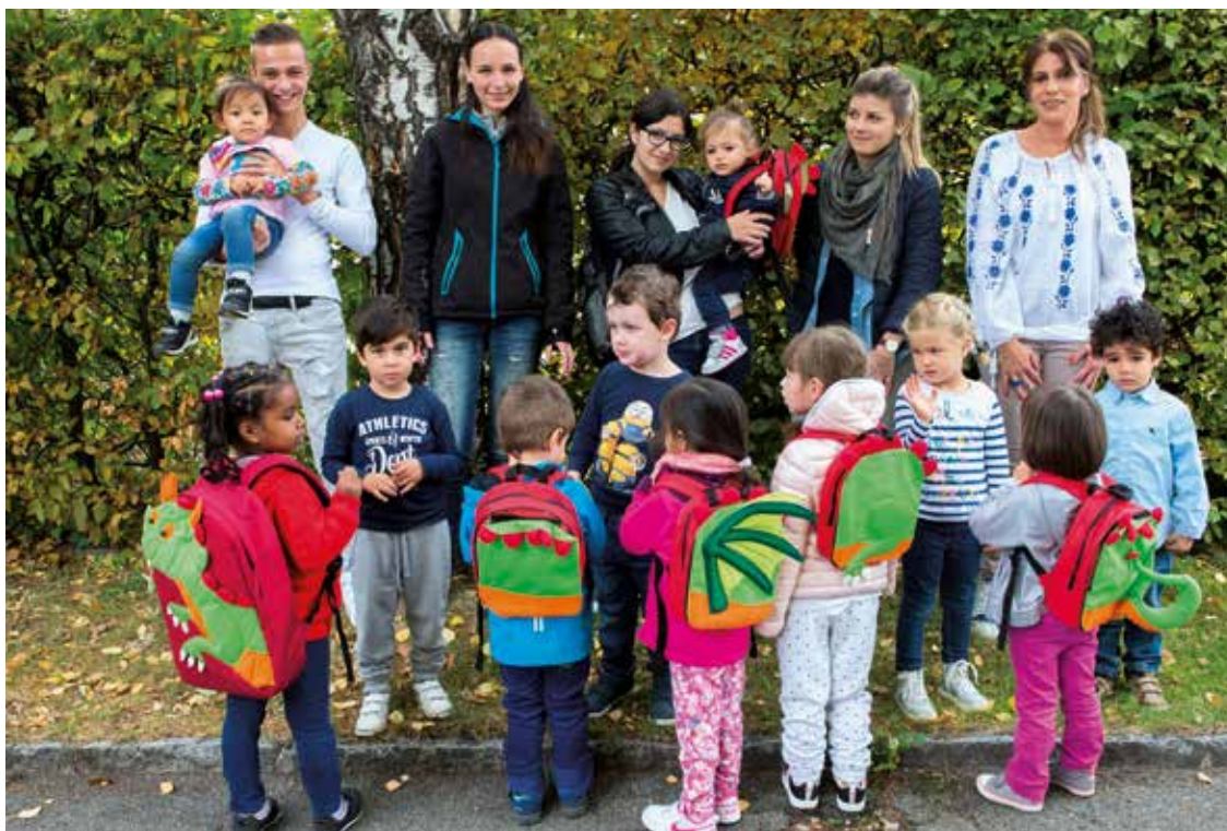
Les petits de Serrières accueillent ceux des Cadolles qui portent Gaston sur leurs dos.

Une fois par mois environ, l'une des cinq crèches adresse une invitation à celle qui héberge temporairement Gaston – celle qui possède les 6 sacs à dos utilisés pour le transport des livres – pour pouvoir l'accueillir à son tour quelques semaines. «C'est le rituel de l'invitation. Comme c'était notre tour, nous avons posté notre lettre il y a eu