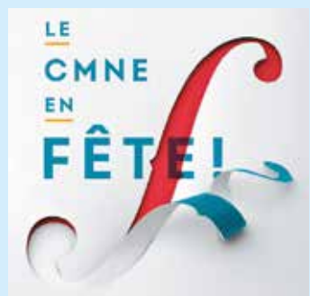
Un anniversaire fêté en trois temps.

Tous les renseignements sur le site www.cmne.ch .