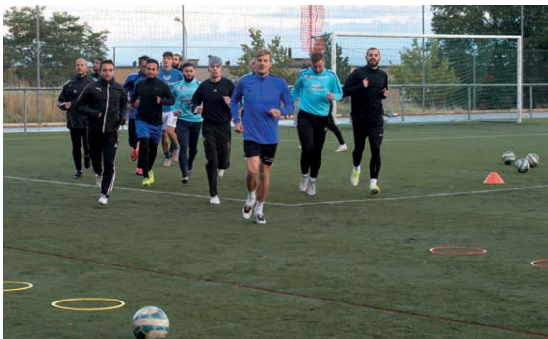
Plus de 70 membres dont un tiers de jeunes représentent Audax-Friul.