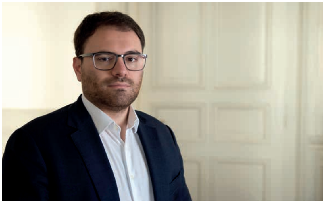
Selon Fabio Bongiovanni, un référendum des communes reste possible.

Certains amendements pourraient avoir une influence sur les finances communales s'ils sont accep-