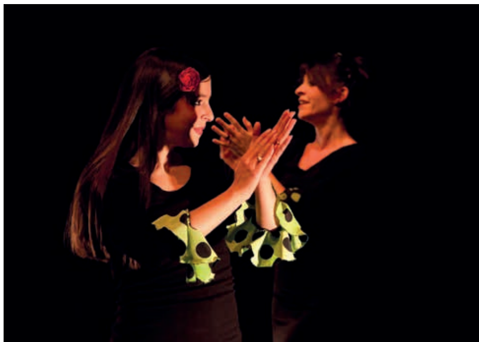
Alogamia propose une création pleine de rythme autour du flamenco.