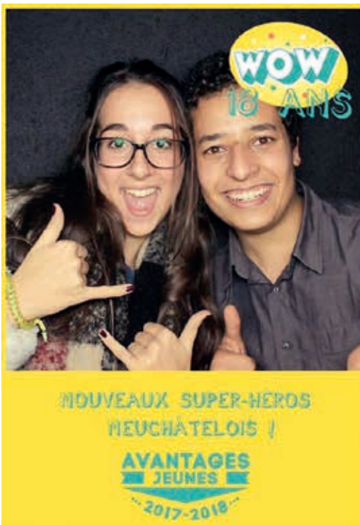
Une boîte rigolote permettait de se prendre en photo avec un décor de la carte Avantages jeunes, puis de partager l'image sur les réseaux sociaux.