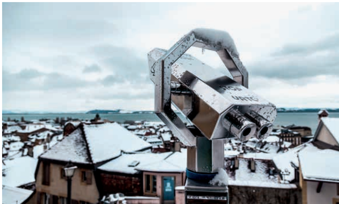
Le Conseil général a longuement débattu de l'avenir des finances communales.

A l'occasion du débat sur le budget, le groupe Vert'libéraux-PDC a déposé un postulat au sujet des allocations communales destinées aux personnes âgées et aux invalides de condition modeste: nous souhaitons que le Conseil communal étudie et mette en place un système pilote, transposable à d'autres secteurs bénéficiant de subventions communales, qui permettrait de verser ces allocations sous forme de bons ou d'un autre moyen de paiement valable uniquement sur le territoire communal, soit de permettre à ces montants versés par la commune de profiter aussi à l'économie locale.