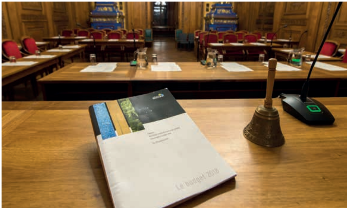
Sous toit, le budget 2018 de la Ville prévoit un déficit de 5 millions de francs, pour quelque 278 millions de charges. • Photo: Stefano Iori

Le Conseil général a retoqué lundi le budget présenté par le Conseil communal