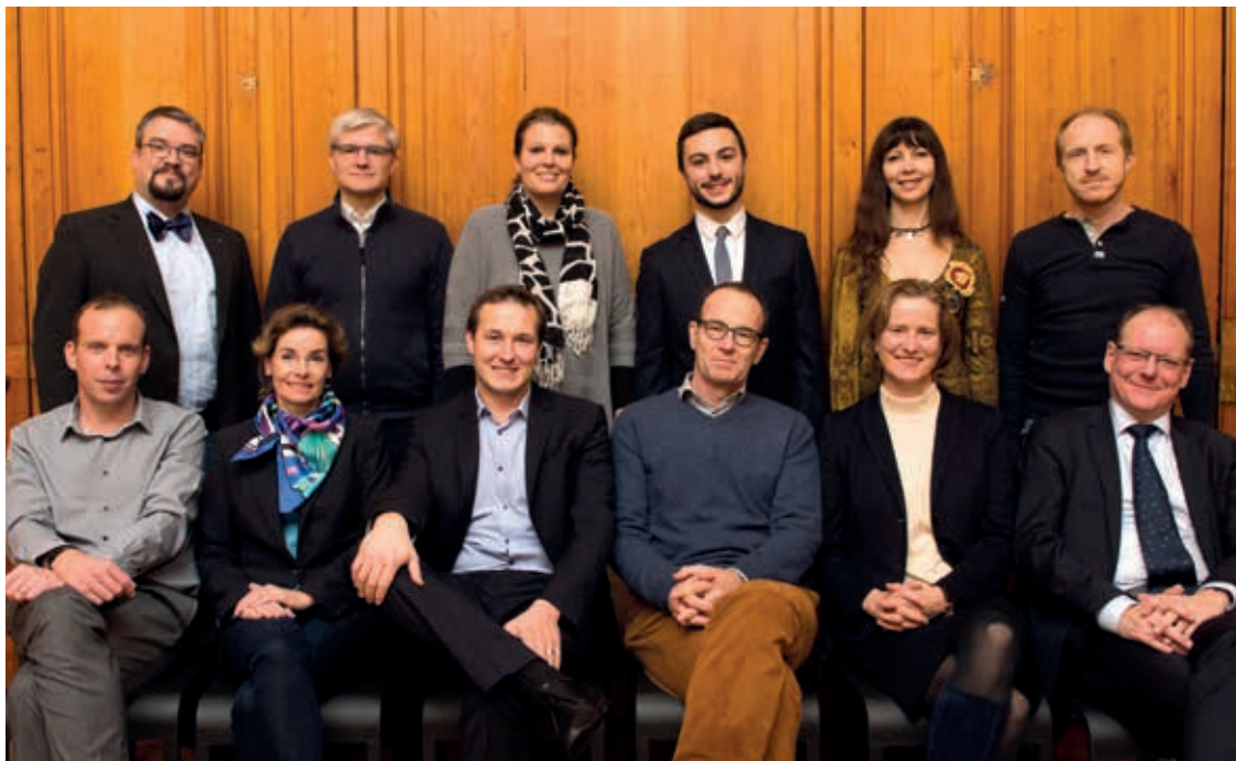
Le groupe PLR se félicite du rapport du Conseil communal sur l'avenir des domaines de la Ville.

Tout vient à point à qui sait attendre. Le Conseil communal vient