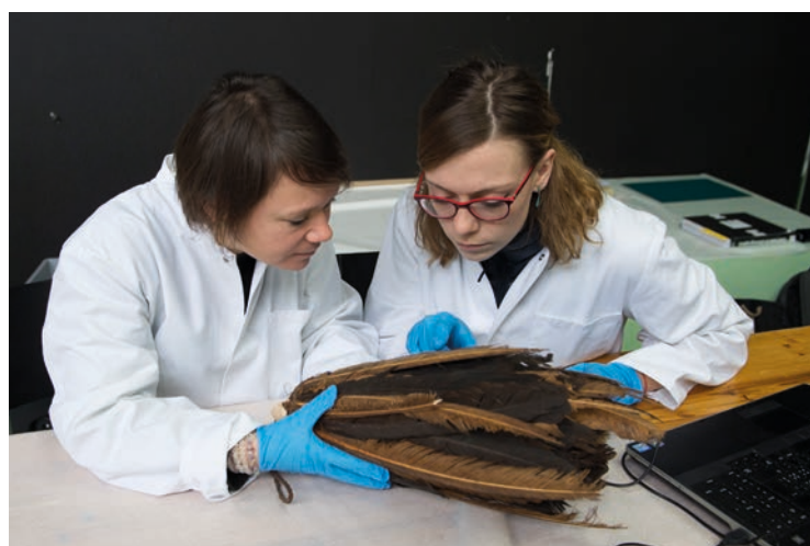
Plumet de sorcier, Angola. L'observation fine de chaque objet est indispensable à la conservation préventive.