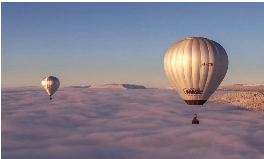
Pierrick Duvoisin et son team Balloon Concept ont effectué plusieurs vols de reconnaissance au-dessus de Neuchâtel pour préparer leur challenge inédit.