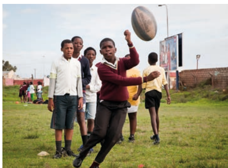
Coaching sportif ou appui scolaire au programme de ces séjours engagés.

Soif de découverte? A la recherche d'une expérience unique à l'étranger ou de vacances différentes, plus engagées? L'ONG Imbewu, basée à Neuchâtel, et son partenaire local United Through Sport accueillent des volontaires internationaux en Afrique du Sud, plus particulièrement à Port Elizabeth, pour encadrer des enfants et jeunes des townships de la région.