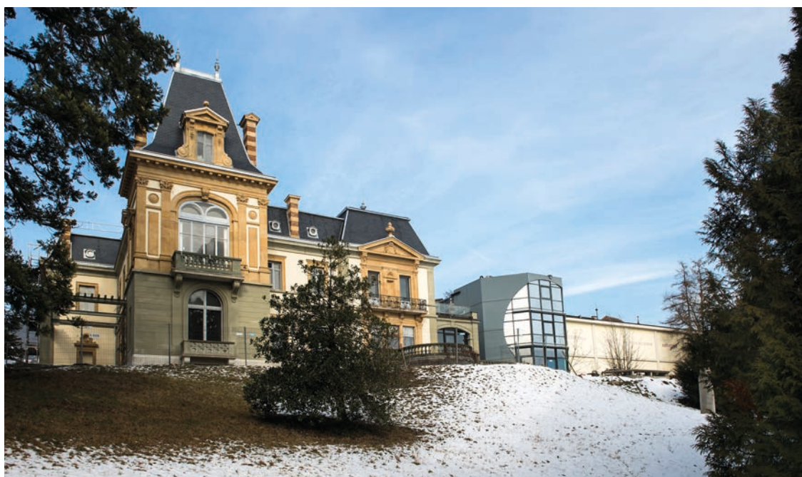
Lors de la réouverture de la Villa de Pury prévue à l'automne, les visiteurs découvriront de nouveaux espaces d'exposition.