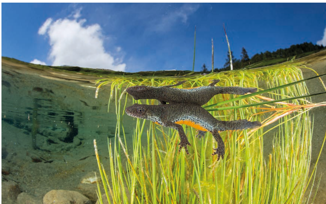
Pendant deux jours, Festisub dévoilera les beautés du monde subaquatique, tel ce triton, capté par le Tessinois Franco Banfi.

Directrice de l'Éducation, de la Santé et de la Mobilité