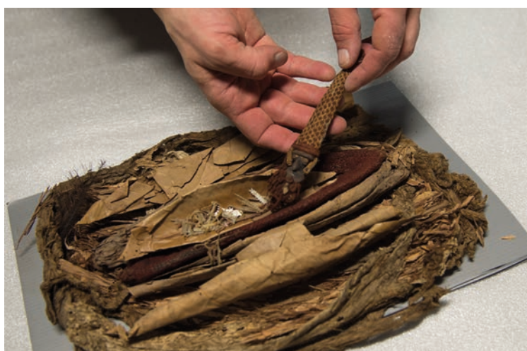
Tête de monnaie canaque dans son écrin fait de divers végétaux et de tapa. Nouvelle Calédonie.