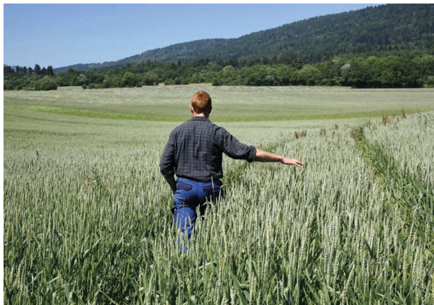
Le portrait sensible d'un agriculteur, qui tourne le dos à l'agriculture chimique à laquelle il avait été formé pour se lancer dans la culture de blés anciens.

La vente du troupeau provoque des déchirements. «On pourrait