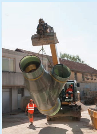
Une étape importante: la pose du diffuseur, l'été dernier.

La fonte de la glace devrait permettre à la production hydroélectrique de démarrer concrètement! A l'instar du projet de turbinage des eaux du Seyon également concrétisé en 2016, la centrale de Serrières contribue à augmenter l'indépendance du canton en matière énergétique. Viteos poursuivra dans cette voie avec de futurs projets.