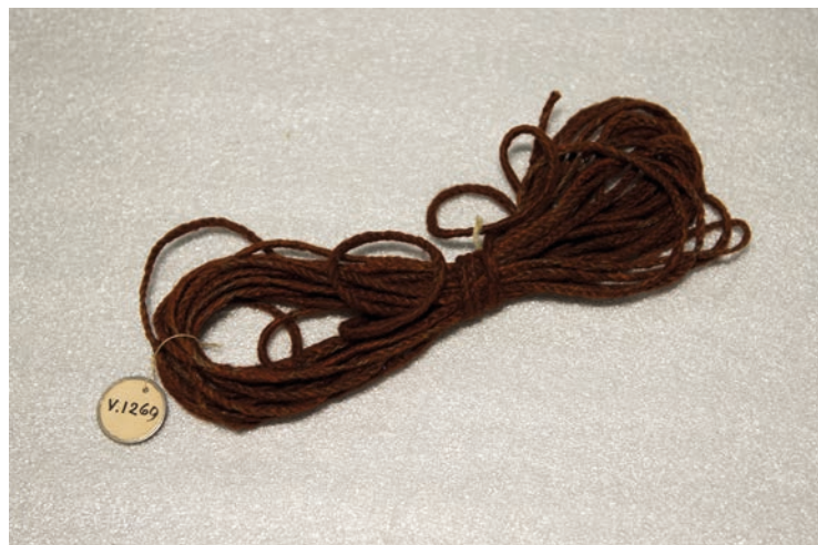
Entièrement tressé à base de poils de roussette (une chauve-souris végétarienne), ce fil nécessite un tel travail à sa confection qu'il peut servir de monnaie d'échange. Nouvelle Calédonie.