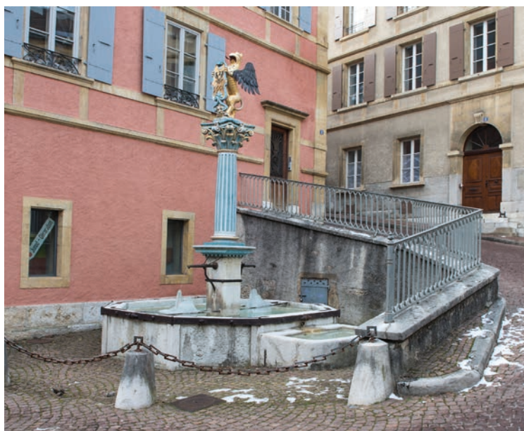
Du vin blanc, puis du rouge, coula en 1668.