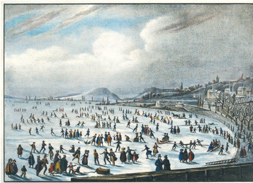
Neuchâtel en février 1830: des milliers de gens s'amuse dans la baie de l'Evole.

Mais depuis le début des mesures, en 1864, le nombre de jours de glace recule. Dernier célèbre et glacial hiver en date: 1963. Cet hiver-là, presque 50 jours sous zéro avaient alors été enregistrés et une fine pellicule de glace s'était même formée sur le lac. Sans qu'on puisse pour autant le traverser, comme lors des épisodes