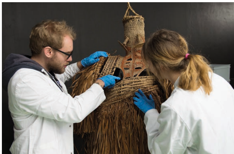
Masque Asmat, Papouasie-Nouvelle-Guinée, en phase de stabilisation.