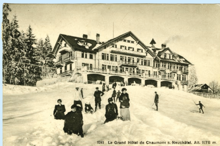
Le Grand Hôtel de Chaumont vers 1911, reconstruit après l'incendie de 1909.

Au début du XX e siècle, Chaumont était d'ailleurs un «spot» de sports d'hiver, vanté comme tel sur des affiches publicitaires. S'y pratiquaient notamment des courses de bobsleigh. Mais l'événement le plus marquant – et le plus dramatique – de l'hiver chaumonnien fut sans doute l'incendie du Grand Hôtel, le 1 er février 1909, ravagé en un après-midi. Malgré une pompe attelée à six chevaux, et une voiture réquisitionnée à l'usine Martini de Saint-Blaise, les pompiers ne purent que constater les dégâts. Aucune victime – l'hôtel abritait alors quelques hôtes étrangers – ne fut heureusement à déplorer. (fk)