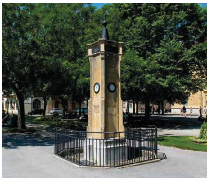
La colonne météorologique du quai Ostervald a été restaurée en 2001.