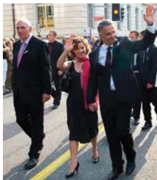
Didier Burkhalter et son épouse lors de son premier bain de foule à Neuchâtel, en 2009, après son élection au Conseil fédéral.