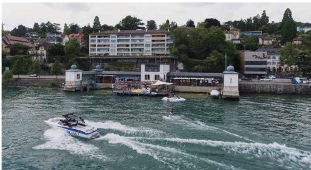
Le public est invité à venir s'essayer au ski nautique, wakeboard et wakesurf au travers d'initiations pour enfants et adultes ce samedi aux Bains des Dames.