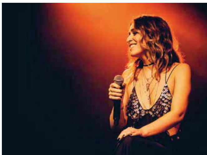
La chanteuse Roberta Sà donnera un avant-goût de la soirée brésilienne.