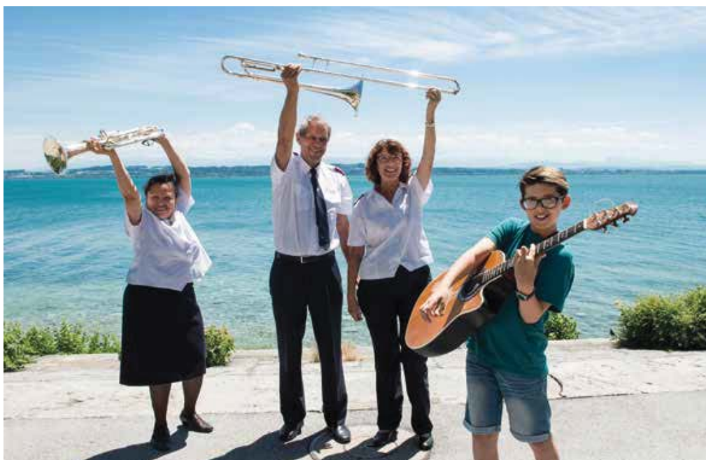
Comme William, de l'école de musique BBM, de nombreux musiciens monteront sur scène ce week-end.

Directeur de la Culture et de l'intégration, des Sports et du Tourisme