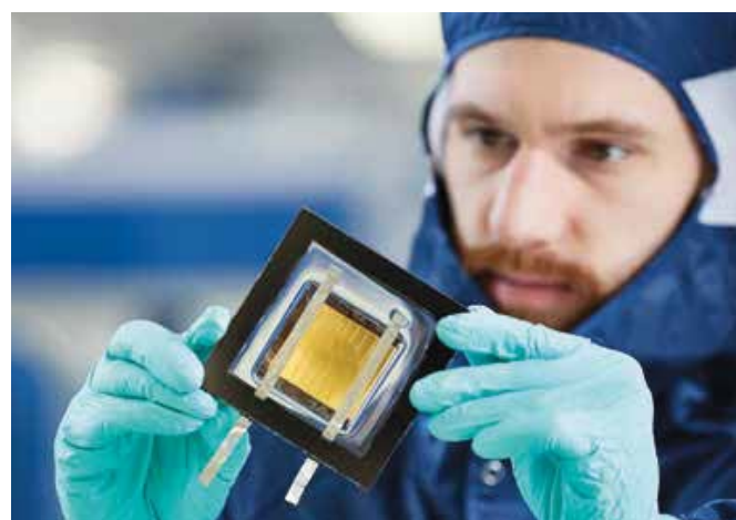
Une trentaine de nouveaux brevets sont venus enrichir les 196 familles de brevets du CSEM.

Un bracelet de sécurité biométrique, une nouvelle génération de capteurs solaires ultralégers pour satellites ou un procédé avant-gardiste pour calibrer les mouvements horlogers... Les innovations mises au point par le CSEM, centre technologique et d'innovation basé à Neuchâtel, et ses partenaires industriels n'ont pas manqué en 2016.