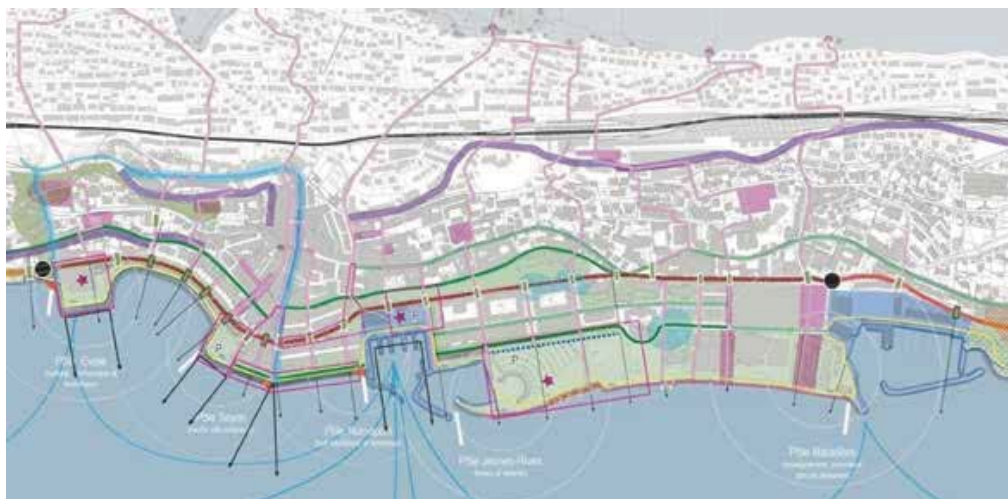
Extrait du plan directeur sectoriel «Le lac et ses rives», qui a pour but de développer une vision globale et cohérente de la rive et des diverses activités qui doivent s'y dérouler.

« Dans tous les projets d'envergure, il est fondamental de démontrer que chaque franc dépensé a été pensé. »