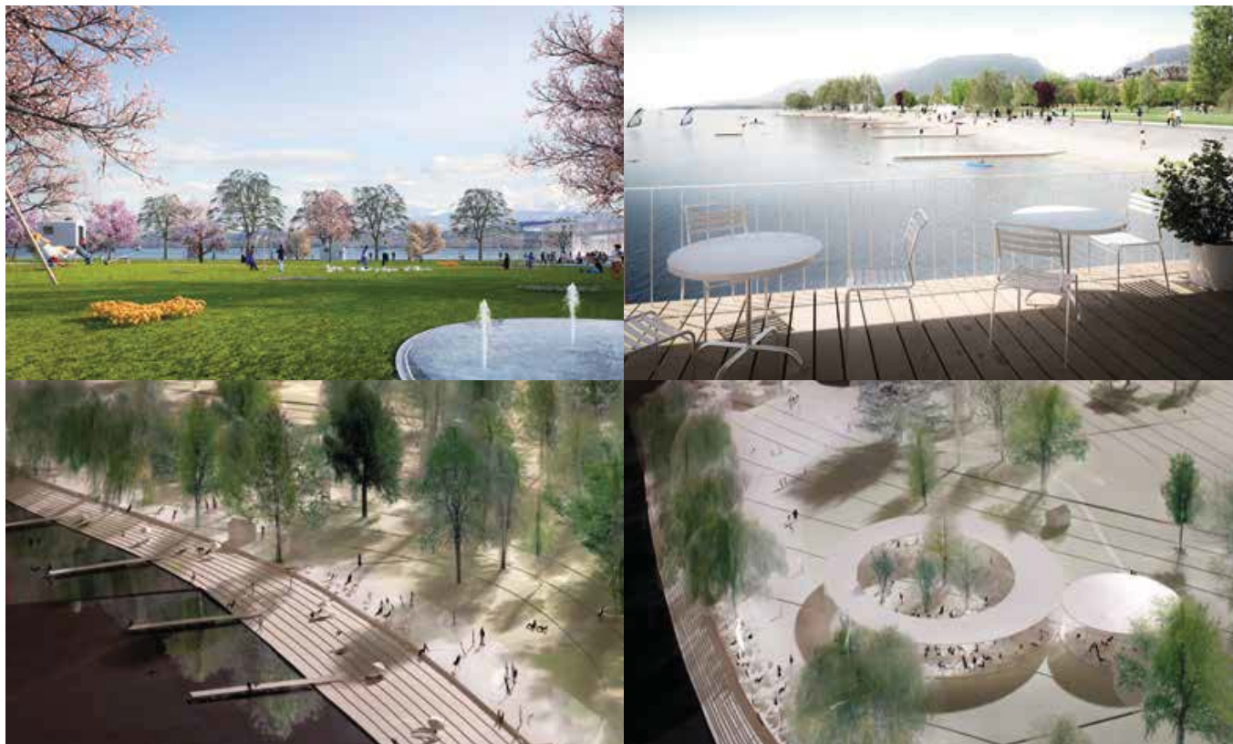
Grande plage, restaurant vitré et espaces verts se côtoient sur le site idyllique des Jeunes-Rives, pour lequel le Conseil communal sollicite un ultime crédit d'étude de 1,5 million de francs.

soumise début 2019. Le premier coup de pioche pourrait ainsi être donné en septembre 2020. Les travaux sont prévus en deux temps. D'abord, la plage et l'est du parc, puis l'actuel parking et ses abords. Les places de stationnement des Jeunes-Rives seront maintenues le plus longtemps possible. Le temps d'agrandir le parking du Port sous la place Alexis-Marie-Piaget, peu importe la variante choisie en surface. A savoir l'implantation d'un grand magasin ou l'extension du Jardin anglais. Le Conseil communal se déterminera cet été à ce sujet. Nous souhaitons véritablement donner une nouvelle vie aux Jeunes-Rives en accueillant aussi bien la population neuchâteloise que les touristes. C'est d'autant plus important que nous avons la chance d'avoir à Neuchâtel des rives urbaines dotée d'un immense potentiel en matière de tourisme, de culture et de loisirs, du port du Nid-du-Crô à la Baie de l'Evole et le hangar des trams, en passant par les Jeunes-Rives, le port du centre-ville, le quai Ostervald et l'esplanade du Mont-Blanc! (ak)