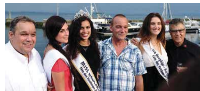
La Cave du Cep sera à l'honneur lors de la Fête des Vendanges, sur le char de la Gerle d'Or lors du traditionnel Corso fleuri.

La 23 e Gerle d'Or a été décernée à la Cave du Cep, à Cortaillod. Pour sa 23 e édition, la dégustation a eu lieu le 14 juin sur le bateau « Le Fribourg » de la Navigation. Dix-neuf chasselas neuchâtelois étaient en lice à cette occasion.