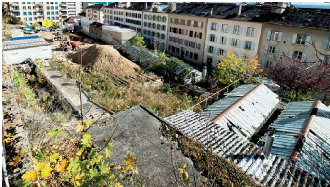
C'est ici que sera aménagé le nouveau jardin public.

Des jeux pour les enfants, des bancs, un espace de détente, un verger, des arbustes à baies, des jardins potagers, des nichoirs à insectes et des gîtes pour la faune: «Les aménagements proposés nous semblent démesurés par rapport à la surface à disposition. 1'200 mètres