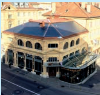
Le bâtiment fut d'abord un grand magasin, avant de devenir une brasserie en 1909.

Les travaux d'intérieur, quant à eux, ont consisté à refaire complètement le système de ventilation des cuisines et du restaurant. Le processus de circulation de l'air, chaud en hiver, frais en été, permet une régulation optimale du climat.