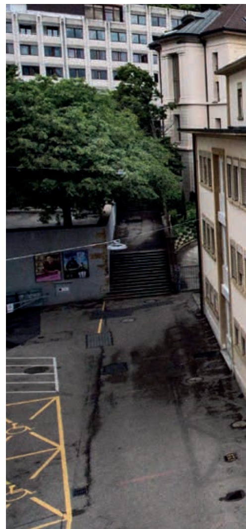
La proximité du futur bâtiment scolaire avec le Collège d

Le Conseil communal, par sa directrice de l'éducation Christine Gaillard n'est pas resté sourd à ces remarques et a décidé de retirer du projet l'investissement de 250'000 francs prévu pour la pose des panneaux sur cette façade. «Le projet initial prévoyait l'utilisation de trois façades pour capter l'énergie solaire puis l'exécutif a opté pour une option plus optimale reposant uniquement sur la face sud (et la toiture). Tenant compte du besoin d'information supplémentaire demandé par certains groupes suite à ce changement, il serait dommage de retarder l'entier du projet qui fait l'unanimité sur le fond.» Le crédit, passé de 8'710'000 à 8'460'000 francs après cette décision, a été approuvé à l'unanimité. (kv)