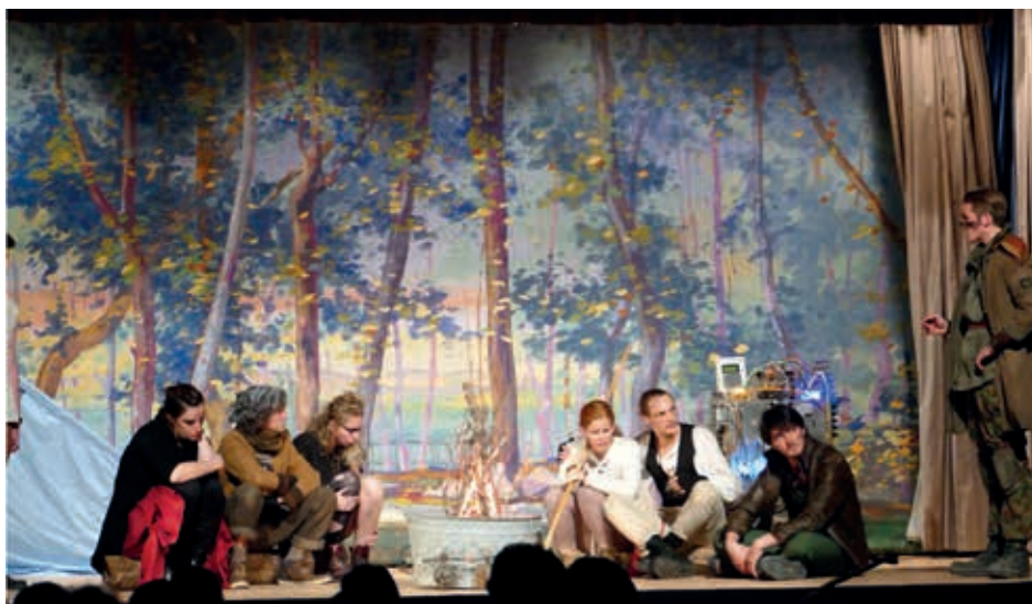
La pièce qui sera jouée les 17, 18 et 19 novembre prend place dans un univers post-apocalyptique.

Au fil de ces spectacles, l'association a pu montrer des pres-