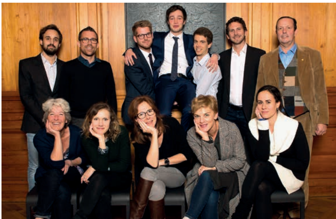
Le groupe socialiste salue le projet de réaménagement du bâtiment Maximilien-de-Meuron en collège.

Sur le plan de l'éducation, dans un contexte de densification de la population et de réformes pédagogiques, il est temps d'optimiser la répartition des bassins scolaires de manière pertinente afin d'offrir de meilleures conditions d'enseignement. Il nous paraît également approprié que des locaux adaptés puissent être attribués à l'Ocosp (Office cantonal de l'orientation scolaire et professionnelle), ainsi qu'au service socio-éducatif qui accompagne les élèves fragilisés.