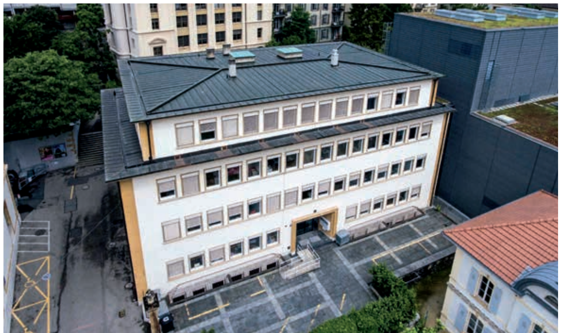
Tout le cycle 3 du Centre des Terreaux sera regroupé sur un seul site.

Enfin, notre groupe, très attaché à une meilleure gestion de nos ressources en énergie, s'est félicité de l'installation d'une station photovoltaïque en toiture de l'immeuble. La pose de panneaux photovoltaïques en façade a en revanche suscité de légitimes interrogations au sein de tous les groupes du législatif: il était donc sage d'y renoncer, dans l'intérêt d'une politique énergétique durable crédible.