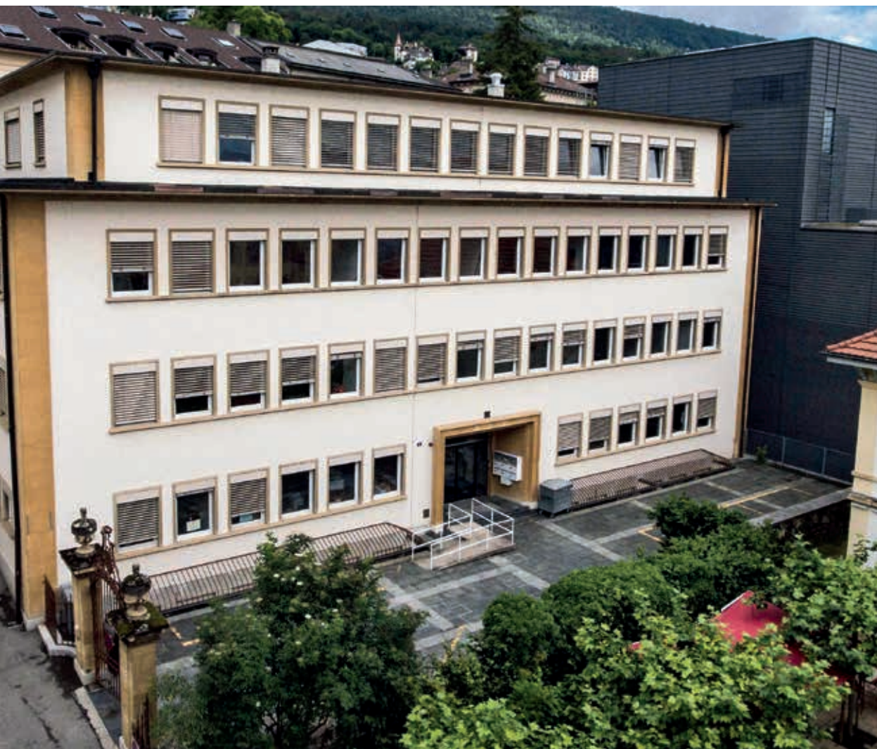
es Terreaux est une aubaine.

hé lundi sur l'aménagement du jardin public du Vieux-Châtel