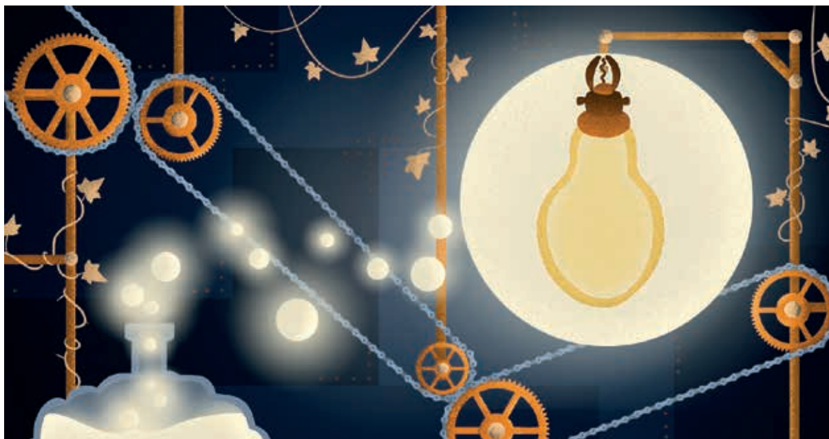
L'association Ateliers Le Labo veut permettre aux jeunes d'explorer de nouvelles voies professionnelles.