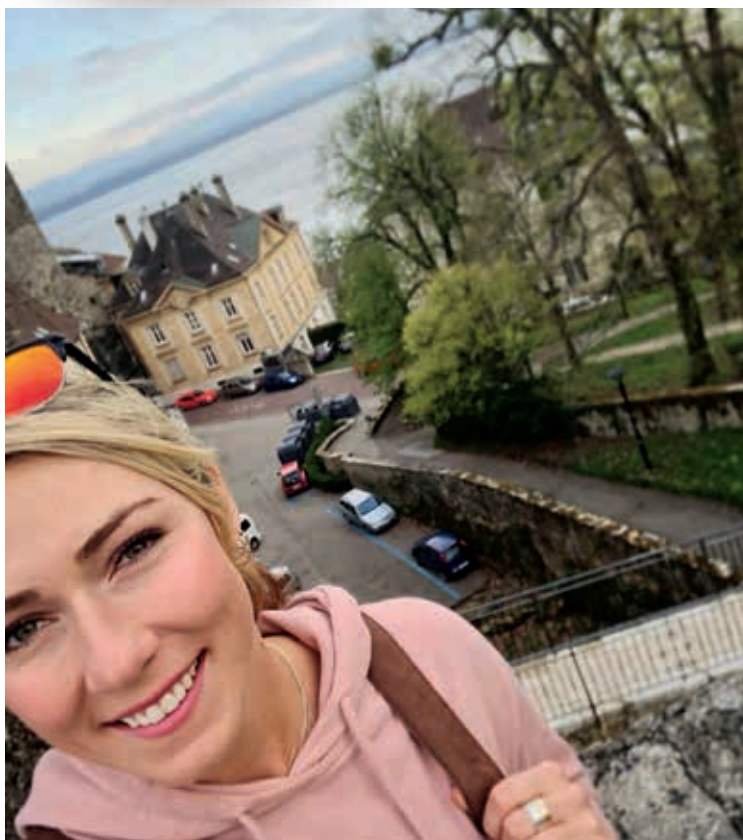
Mikaela Shiffrin en visite à Neuchâtel: « Un endroit magnifique », a-t-elle dit.

La skieuse américaine Mikaela Shiffrin, championne du monde, championne olympique et détentrice du globe de cristal de la Coupe du monde, était de passage dans la région ces jours, notamment pour se rendre auprès de l'un de ses partenaires, la marque horlogère Longines, à Saint-Imier. Elle était en ville dimanche après-midi, d'où elle a posté ces sympathiques photos prises au Bannet, et à proximité de la Collégiale. « C'est une chance de visiter Neuchâtel, c'est un endroit magnifique, ce qui n'est pas surprenant! », raconte-t-elle sur sa page Facebook, où des milliers de personnes ont apprécié ses photos. Et lundi soir, les mêmes photos publiées sur Instagram comptaient déjà près de 50'000 « likes »!