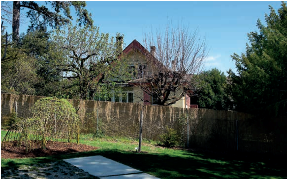
Le Conseil communal propose d'acheter cette maison pour l'accueil parascolaire à Serrières.