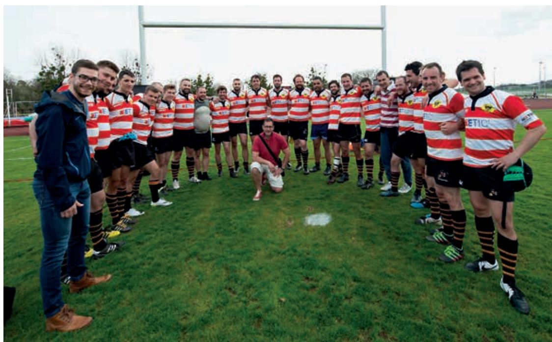
Le Neuchâtel Sports rugby club fête ses 50 ans cette année.