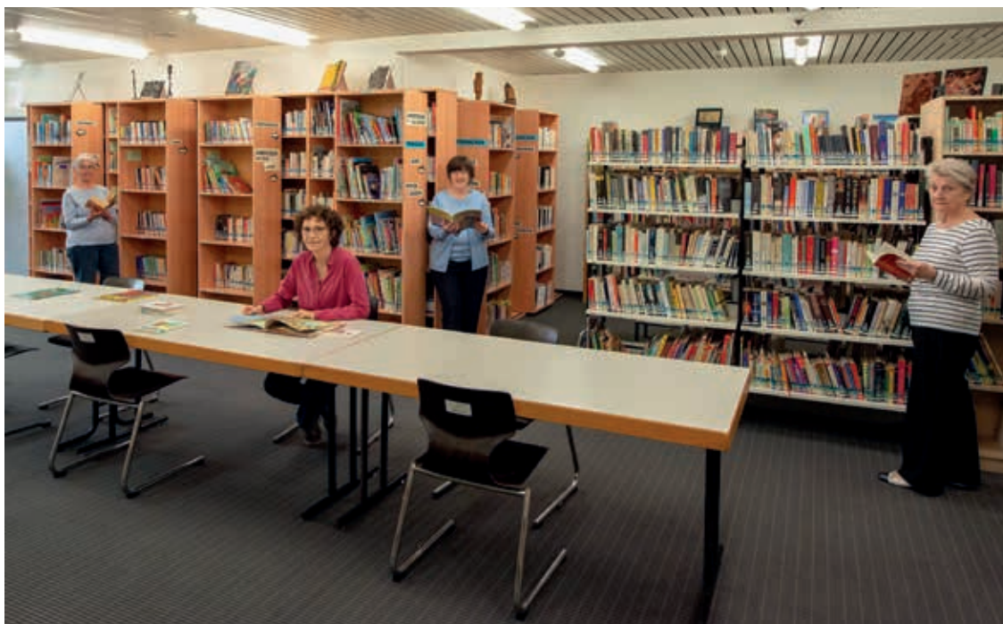
« Petit Prince » en finnois, contes en russe: on trouve de tout dans cette bibliothèque multilingue.

Directrice de l'Urbanisme, de la Mobilité et de l'Environnement