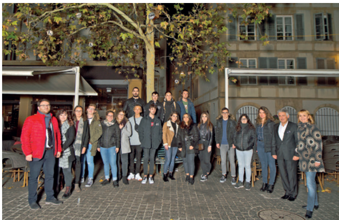
Des plaques portant le prénom et le métier de chaque jeune en formation sont accrochées aux branches.