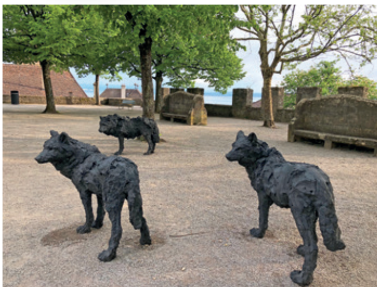
Les trois loups et l'agneau ont déjà reçu le soutien de 200 parrains et marraines.

Dernière ligne droite pour l'opération de financement participatif «Adopte un loup»: destinée à conserver dans l'espace public une trace de l'exposition «Témoins à charge», de l'artiste italien Davide Rivalta, cette action a déjà permis de réunir la magnifique somme de 83'000 francs. Et ceci grâce à la générosité de plus de 200 parrains et marraines, privés ou entreprises. Un grand merci à toutes et tous!