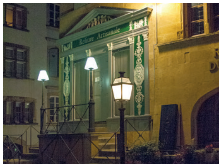
Le Banneret et ses lumières, photographiés par Nathan Jucker.

Pour cette première, le Lokart a choisi de confronter le regard de deux artistes sur le centre-ville de Neuchâtel. Entre enquête scientifique et exploration urbaine, le Chaux-de-Fonnier Nathan Jucker a passé deux semaines à en arpenter les rues, pour tenter d'en saisir l'essence. Quels sont les sons, les couleurs des différents lieux constitutifs du centre-ville? Quelles impressions nous donnent-ils? Où l'humain a-t-il laissé sa trace? Il en résulte une cartogra-