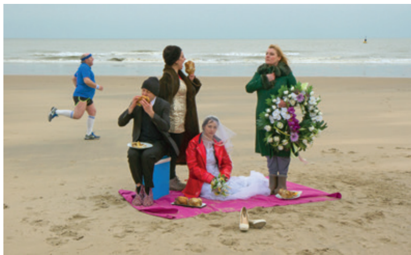
La nouvelle création de la Cie du Passage présente une échappée fantastique et burlesque à découvrir du 20 au 22 novembre.