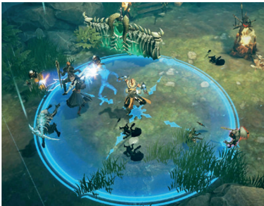
Diablo Immortal, bientôt disponible sur Android et Iphone.

Les studios tendent en effet plutôt à garder précieusement leurs informations. Le contrôle de ces dernières est ainsi devenu un outil puissant pour