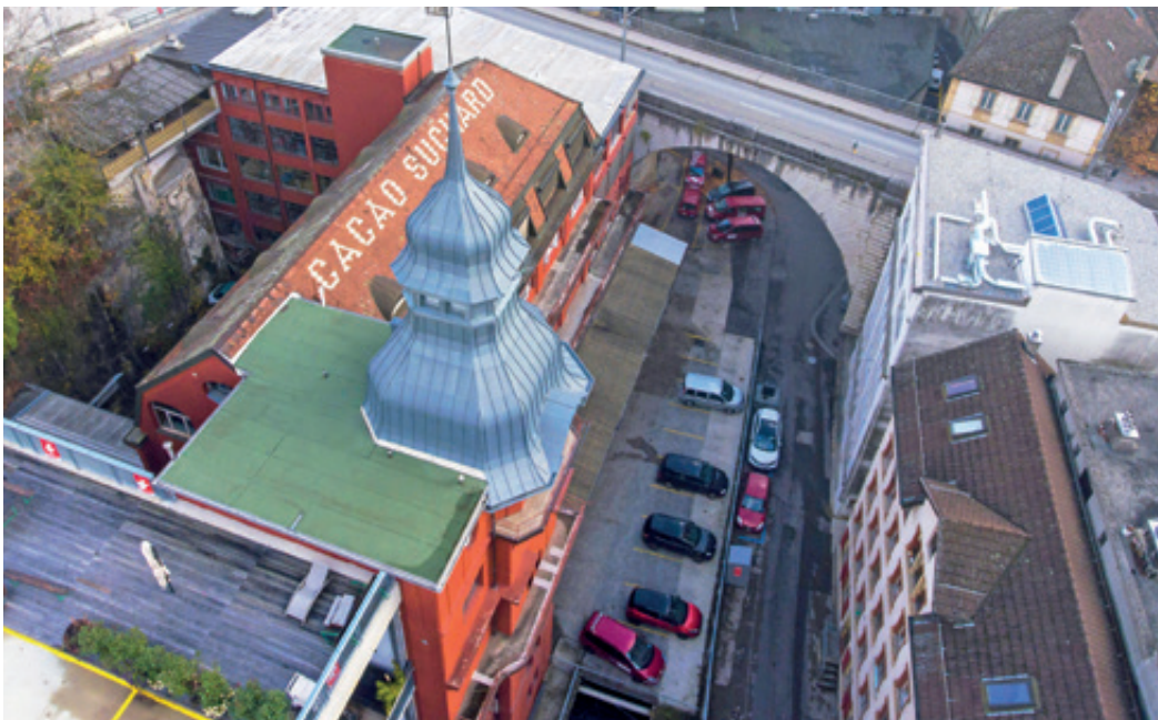
Adossée au pont Berthier, l'usine rouge est composée de matériaux nouveaux au moment de sa construction, au début du siècle passé.

Avec sa tourelle au toit gris est ses murs craqueux, rue des Usines 20, elle est emblématique du passé industriel de Serrières et de l'aventure du chocolatier Suchard: l'usine rouge, comme on l'appelle, a été construite en 1906. Accolée au pont Berthier, elle utilise alors des nouveaux matériaux comme le métal, la brique et le béton armé, qui permettront la création de vastes halles propices à une production toujours plus mécanisée dans le vallon de la Serrière, où Suchard a bâti une dizaine de fabriques. Les bonnes odeurs de chocolat et de cacao ont disparu depuis bien longtemps, mais de nombreuses activités artisanales et tertiaires ont redonné, ces dernières années, une vie au quartier. Deux fois l'an, une journée permet de découvrir dans la bonne humeur les acteurs qui font bouger le vallon. La 5 e édition de l'Afterwork Suchard aura ainsi lieu le 13 décembre dès 18h. Venez-y!