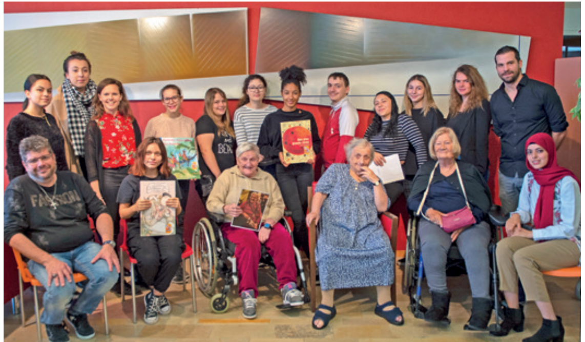
Toute l'équipe du Semestre de motivation Mod'emploi en compagnie de résidentes du home des Charmettes.

Après avoir lu les albums, les jeunes sont allés à la rencontre d'une dizaine de résidents du home Les Charmettes pour des moments de lecture et de partage. «Au départ, il y a de l'appréhension de part et d'autre. Les jeunes débarquent dans un cadre institutionnel et sont confrontés de manière très directe aux personnes âgées, parfois en chaise-roulante. Les aînés, eux, sortent peu et doivent s'habituer au look vestimentaire des jeunes, qui se trouve à des années lumières de ce qu'ils ont connu. Ils découvrent également une diversité ethnique à laquelle ils ne sont pas habitués. Quant à la mesure d'insertion du Semo, elle leur paraît tout simplement irréaliste. A leur époque, tous les jeunes, qu'ils soient bons élèves à l'école ou non, trouvaient un apprentissage. Ce