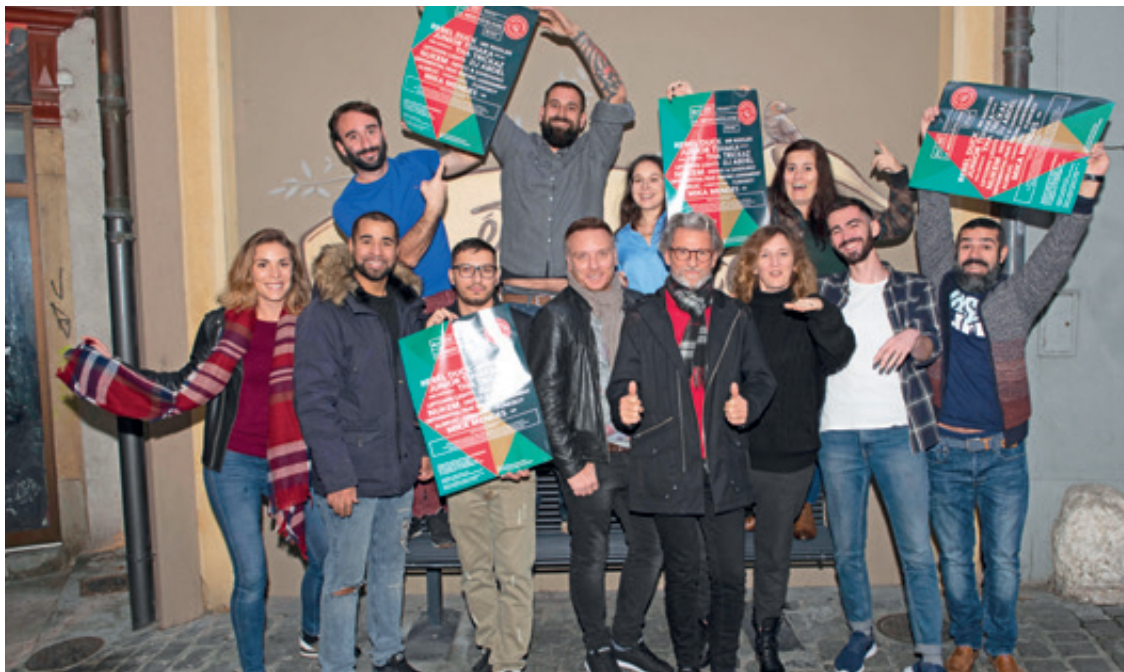
La nouvelle Association des commerçants de la nuit a vu le jour le 25 octobre dernier.