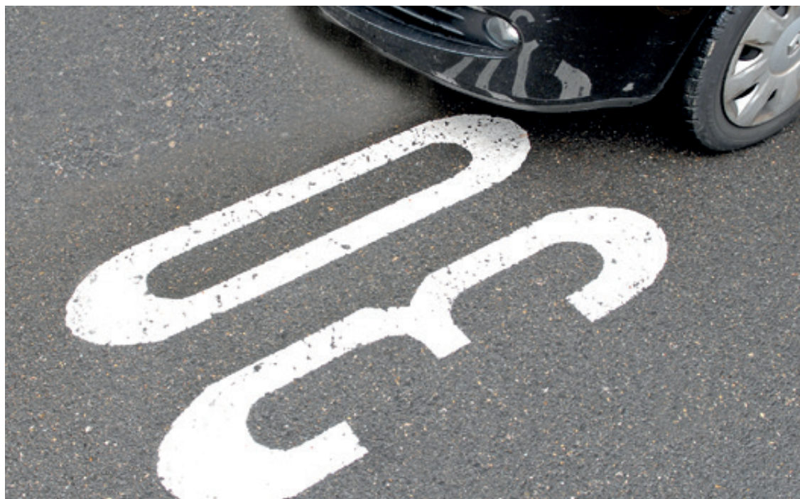
La Ville étudiera la possibilité d'étendre le 30km/h à l'ensemble des rues communales.

Nous espérons ainsi vivement que l'étude qui sera menée par le Conseil communal permettra d'aboutir à une politique innovante de l'affichage sur l'espace public en Ville de Neuchâtel avec des solutions adaptées à la réalité d'aujourd'hui et de demain.