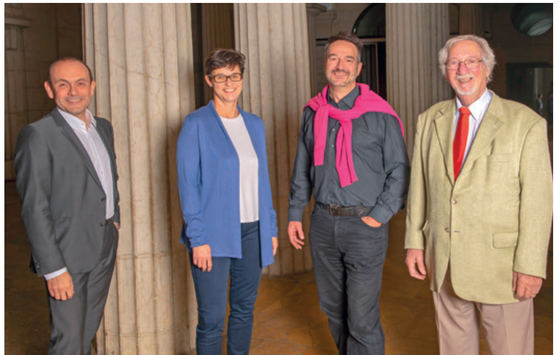
Le groupe Vert'libéral-PDC propose de donner à l'espace Louis-Agassiz le nom de la brillante mathématicienne Sophie Piccard.

Pour notre groupe, l'hommage rendu à Tilo Frey ne doit pas être entaché par la polémique qui entoure la mémoire d'Agassiz. Son nom pourrait ainsi être donné à la magnifique place, encore anonyme, située au sud du Col-