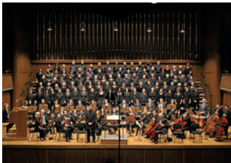
Les choristes de Cantabile et les musiciens de l'ESN se produisent ce samedi soir au Temple du Bas.

Le programme regarde à la fois le passé et l'avenir. Tout d'abord un passé héroïque avec Ballad of Heroes , de Benjamin Britten, écrit à la veille de la Seconde Guerre mondiale. Empreinte de valeurs pacifistes, l'œuvre rappelle que la paix et la dignité humaine ont été obtenues au prix fort. Plutôt sombre, elle s'achève sur un mouvement a capella qui annonce un renouveau. La Dona Nobis Pacem de Ralph Vaughan Williams (1935) marque la fin des combats, vers la réconciliation et la justice. Une œuvre très touchante qui fait triompher la vie. Pour finir, Cantabile revient à la période de la Grande Guerre avec la Vieille Prière Bouddhique de la compositrice française Lili Boulanger, morte en 1918 à l'âge de 24 ans de la maladie de Crohn. Son œuvre décrit la paix comme un état, donnant l'espoir d'un