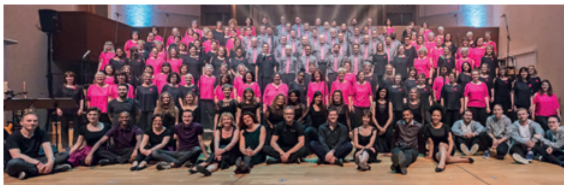
La chorale de la Rochette reprend une ultime fois son spectacle «Praise» au profit de programmes «santé et nutrition» de Terre des hommes.

La chorale de la Rochette donnait début juin un fantastique concert de chant gospel au Temple du Bas. Celles et ceux qui auraient manqué ce spectacle total avec orchestre, danseurs, solistes et plus de 100 choristes sur scène, disposent d'une occasion unique de se rattraper! «Praise» sera repris une dernière fois à Neuchâtel ce dimanche au profit de Terre des hommes.