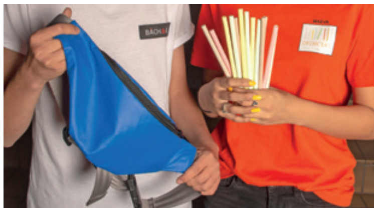
Des sacs en bâche recyclée et des pailles à croquer.

Pour un cadeau de Noël original: www.drinkeat.ch ou www.bach-eco.ch . Les entreprises ont également leur page facebook, «bach&Co» et «drinkeat.yes»