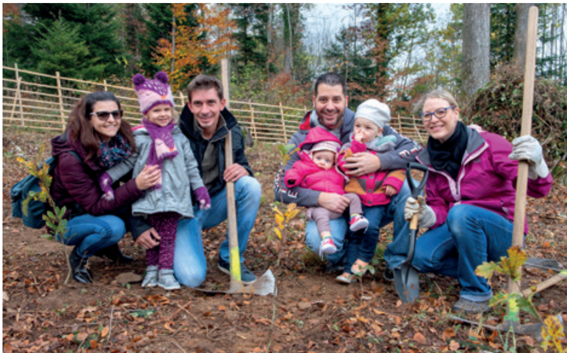
Les familles ont planté elles-mêmes, à Pierre-à-Bot, l'arbre de leur nouveau-né.

Directrice de l'urbanisme, de la mobilité et de l'environnement