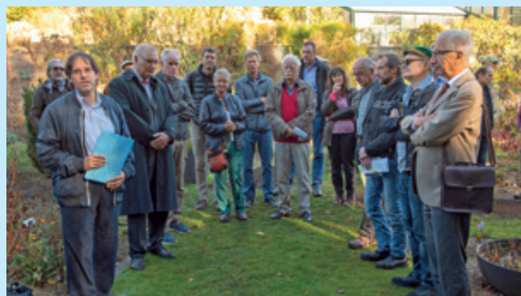
Les anciens d'Amici Naturae étaient venus nombreux pour l'inauguration de la vitrine.