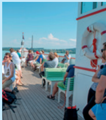
La saison débutera plus tôt en 2019, le 6 avril déjà!

La saison 2019 réservera des surprises. D'abord, pour profiter des printemps de plus en plus précoces, le début de la saison sera avancé de trois semaines, au 6 avril 2019. Ensuite, le bateau à vapeur emblématique de la société, le «Neuchâtel», verra son parcours enrichi par une nouvelle correspondance tous les samedi, rejoignant Bienne et ses eaux pittoresques. Enfin, la LNM se réjouit d'inaugurer ses nouvelles cuisines rénovées, qui offriront une restauration diversifiée de qualité aux passagers.