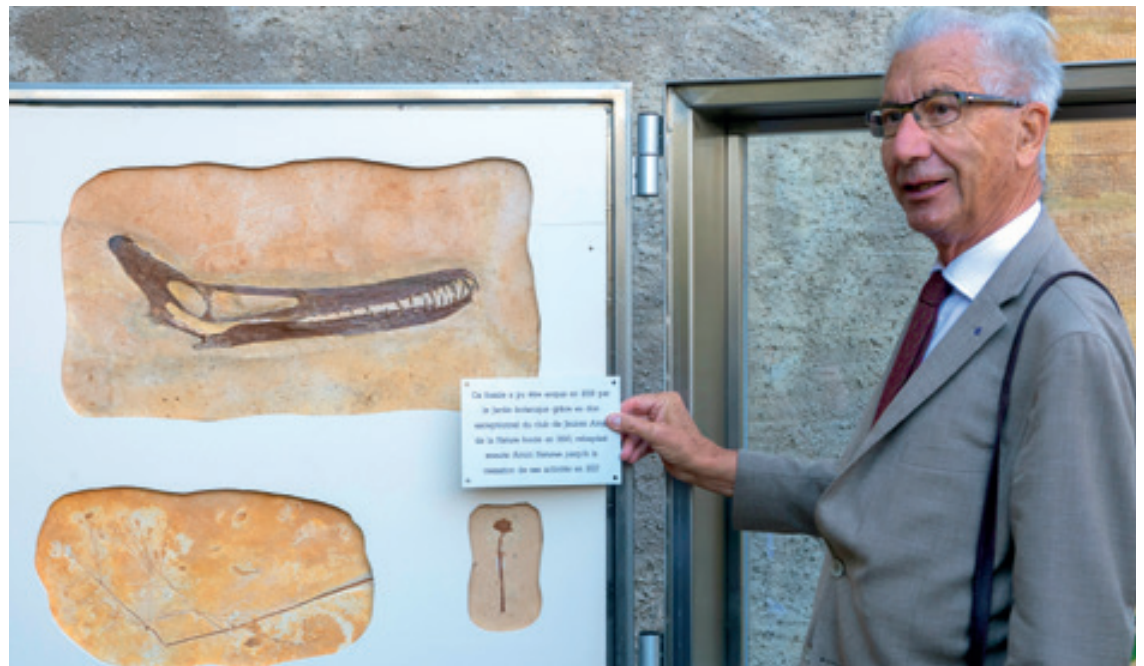
Le crâne de ptérosaure est exposé avec deux autres plaques fossiles provenant du site brésilien de Crato, montrant une fleur, des plantes et des poissons.

C'est ainsi que le Jardin botanique a commencé il y a quatre ans à constituer une collection de plantes fossiles provenant de Crato. Grâce au don de l'association Amici naturae, celle-ci s'est