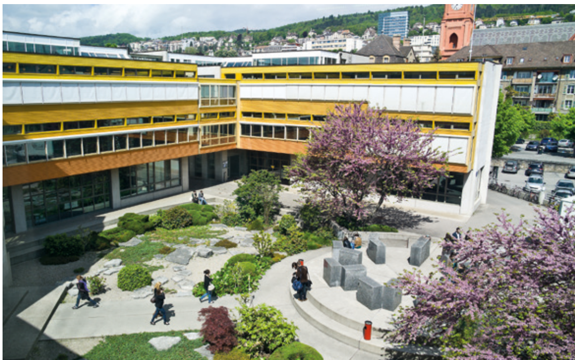
La Ville de Neuchâtel fait bloc derrière la construction d'un nouveau campus à côté de la Faculté des lettres.