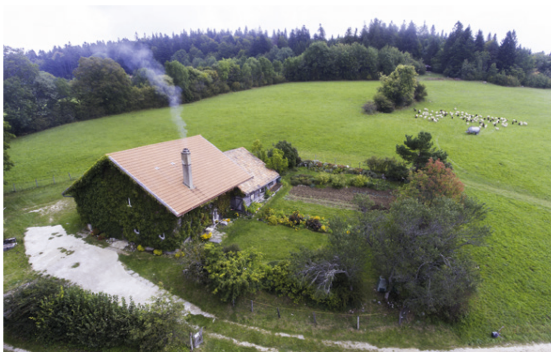
Pour le groupe PopVertSol, il faut préparer maintenant la reconversion à la production biologique des domaines agricoles et viticoles de la Ville.

afficher fièrement le label bio. Le Conseil général a donc décidé, ce lundi, de spécialement créer une commission pour la mise en œuvre détaillée de la reconversion de nos domaines agricoles et viticoles à la culture biologique. Nous sommes convaincus qu'elle sera un très bel atout pour l'image de notre ville!