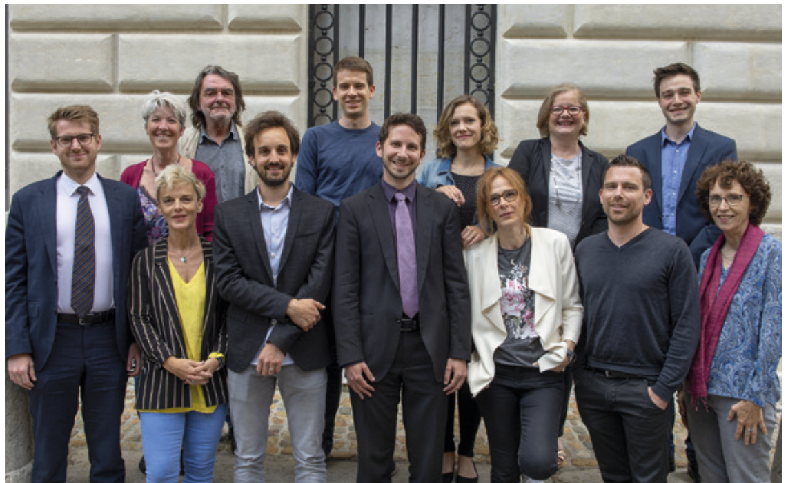
Le groupe socialiste, à l'instar de tous les groupes du Conseil général, insiste sur l'importance du projet UniHub, autant pour l'Université de Neuchâtel que toute la région.

De manière aussi rare qu'exceptionnelle, l'unanimité des groupes politiques du Conseil général a voté en faveur d'une résolution de soutien à l'Université de Neuchâtel. C'est dire l'importance que le Parlement communal accorde à notre Alma Mater, ainsi qu'aux hautes écoles et institutions de formation présentes sur notre territoire communal. Marquer cet attachement nous paraît d'autant plus important dans le contexte cantonal difficile dans lequel nous devons naviguer. Notre Université est l'une des institutions qui contribuent le plus au rayonnement national et international de notre Ville et de notre canton, sans