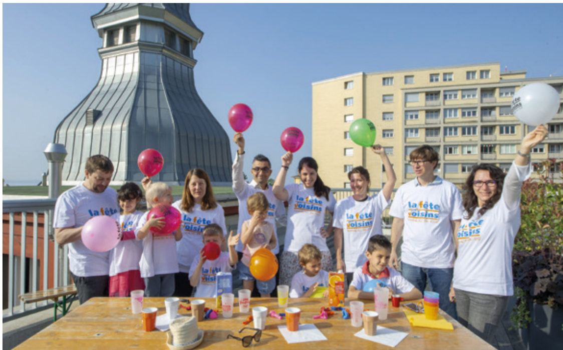
Les Neuchâteloises et Neuchâtelois sont invités à participer à la 8 e édition de la fête des voisins.

Directeur de la Culture et de l'Intégration