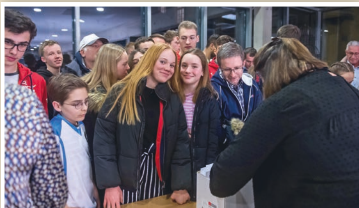
Les athlètes distingués ont reçu des entrées à Festi'neuch ou au cinéma. Chic!