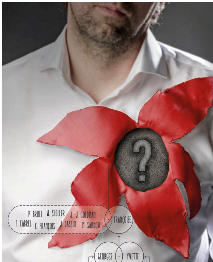
Un spectacle à la fois grave et léger comme un karaoké.

«C'est ce que j'appelle de la bio-fiction. Je me suis inspirée de ma vie,