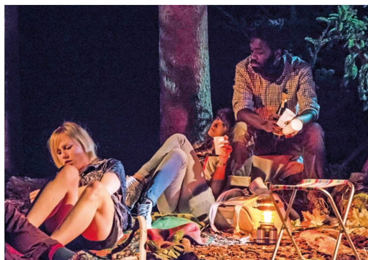
Réunis pour une soirée à la belle étoile, des amis verront leur vie voler en éclat. (Nicola di Meo)

Salué par la presse à sa création en 2015, ce spectacle «d'une beauté cinglante» et d'une «intensité rare» est l'œuvre d'un collectif de six jeunes comédiens qui se sont rencontrés à la Haute école romande de théâtre La Manufacture et qui mènent de front différents projets. «Nous trouvons