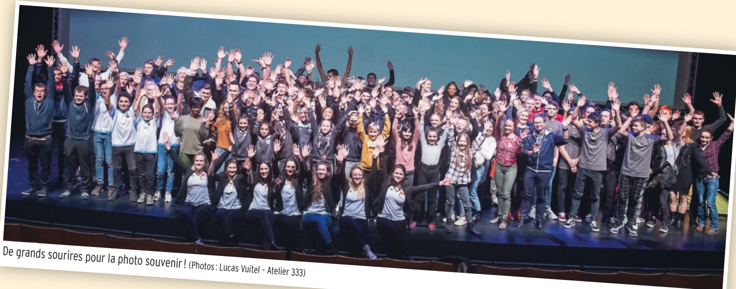
De grands sourires pour la photo souvenir!

Plus de 200 athlètes récompensés par la Ville à l'occasion de la remise des mérites sportifs 2018