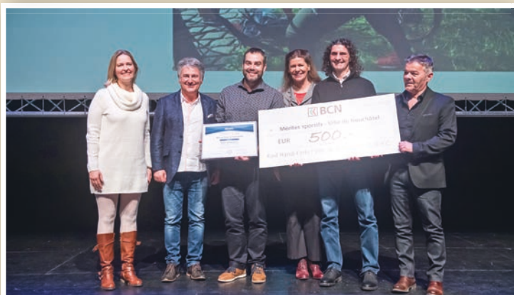
Les autorités de la Ville avec les organisateurs du Raid Handi-Forts.