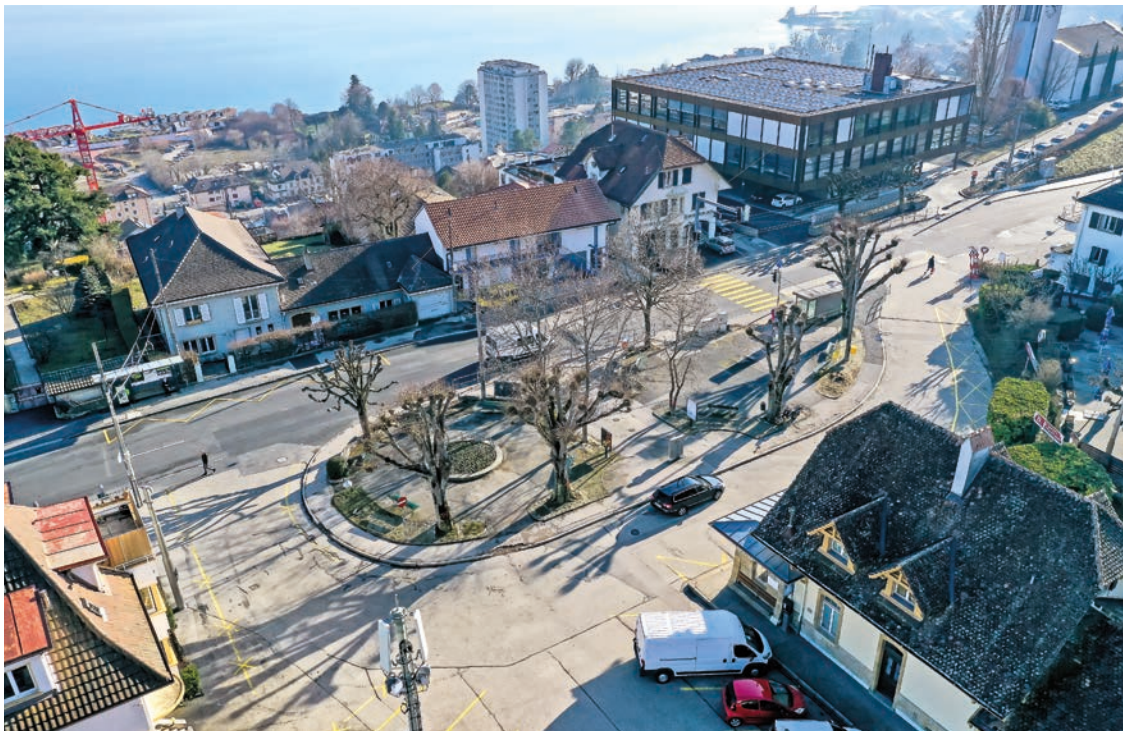
Les Coudriers auront leur mot à dire dans le cadre de la transformation de leur quartier.