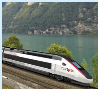
Points positifs, mais aussi inquiétudes pour l'avenir de la ligne Neuchâtel-Frasne-Paris.

Malgré les points positifs sur l'axe Neuchâtel-Travers-Pontarlier-Frasne-Paris, l'annonce de TGV Lyria appelle la FTJA à une grande vigilance. La suppression d'une course peut signifier le début d'une spirale négative conduisant à la perte d'acquis.