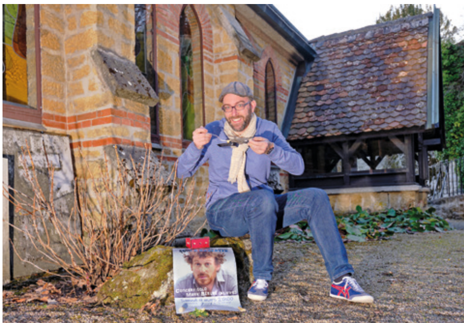
Un bon concert, précédé d'un apéro autour d'une raclette: c'est la formule originale proposée trois fois l'an à l'Ermitage.