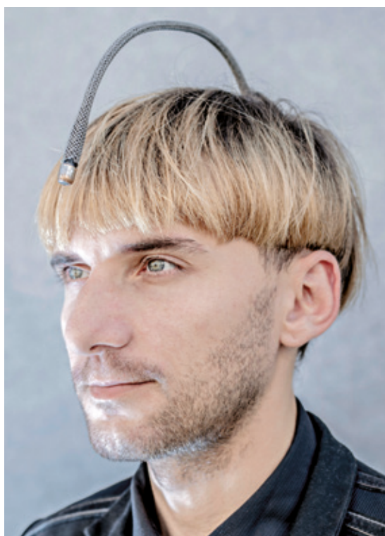
Neil Harbisson, un artiste cyborg.