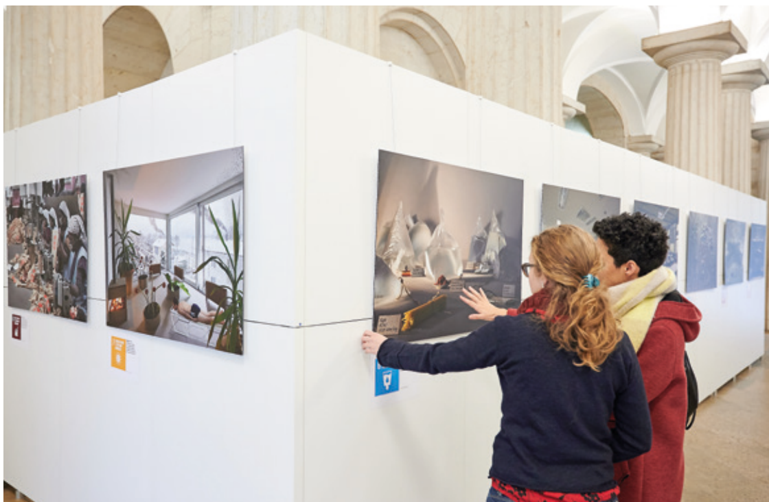
Assurer une gestion durable des ressources en eau constitue l'un des 17 objectifs de l'Agenda 2030.