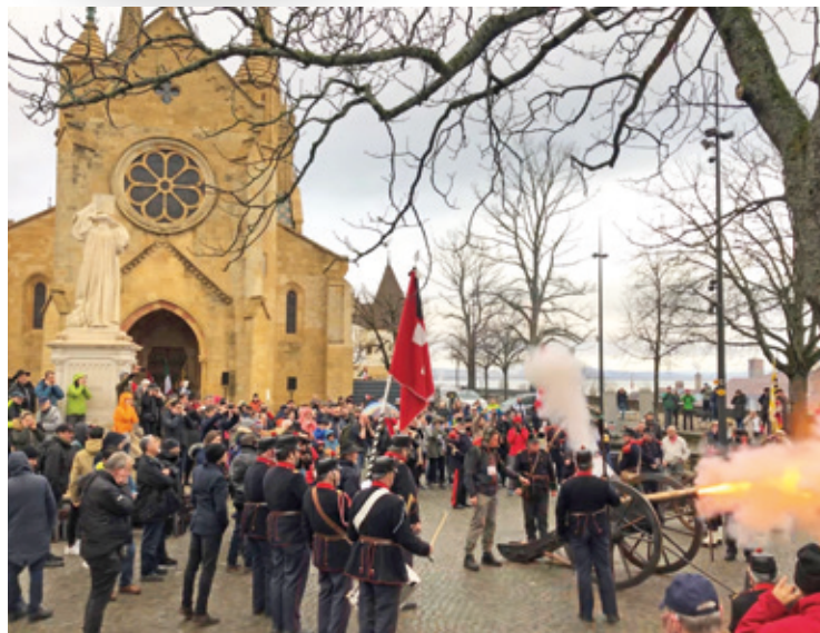
Les coups de canon ont fusé sur l'esplanade de la Collégiale

Neige en Haut, pluie en Bas: le 1 er Mars a été bien arrosé, la semaine dernière, ce qui n'a pas empêché les festivités de commémoration des 171 ans de la République neuchâteloise de se dérouler dans la bonne humeur.