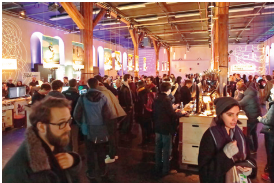
Une opportunité réjouissante d'avoir accès à des gens réputés et passionnant, ici en Suisse ! Ludicious

On commence par poser distraitement son arrière-train sur un coin de siège dans la salle de conférence, puis les orateurs s'enchaînent et les heures défilent, plus vite que le train entre Olten et Aarau. On réalise alors que