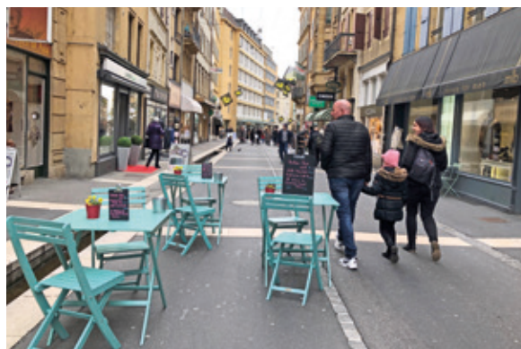
Les commerces et les passant-e-s s'approprient progressivement la rue du Seyon.

La phase pilote est donc maintenant étendue à l'ensemble de l'année : à fin 2019, l'expérience sera analysée avec pour objectif de la pérenni-