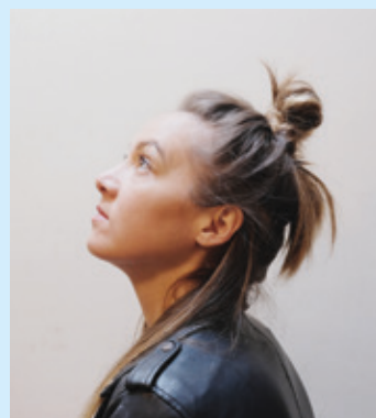
Sophie Hunger reviendra à Neuchâtel en juin. (Marikel Lahana)

La billetterie du festival est ouverte avec des prix abordables et progressifs. Le premier palier tarifaire est appliqué jusqu'au 31 mars.