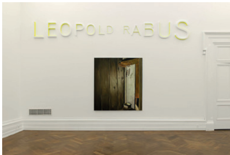
Plusieurs activités sont prévues autour de l'expo Léopold Rabus.

Deux conférences termineront le mois au Muséum: mercredi 30 octobre, à 20h, dans le cadre des conférences de la Société neuchâteloise des sciences naturelles, seront évoqués les micropolluants et les outils du chimiste pour les combattre. Et jeudi 31 octobre, à 20h aussi, sera racontée la tentative d'expédition de trois aventuriers romands en plein cœur de l'Amazonie bolivienne.