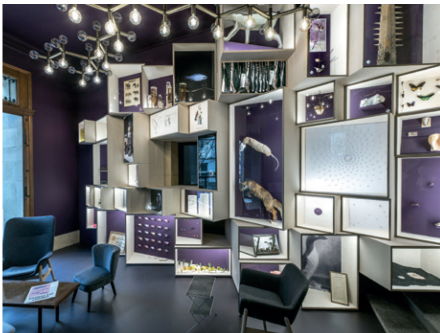
Au Muséum, dedans ou dehors, les animations ne manquent pas.