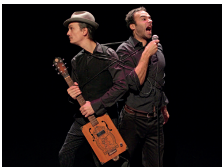
Parmi les temps forts à ne pas manquer, «Ulysse nuit gravement à la santé». (Maxime Flipo)

A l'exception de «Souricette Blues», qui emmènera les enfants