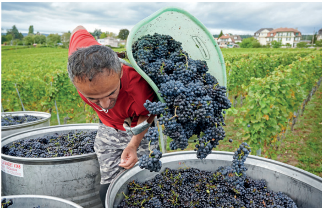
C'est par cette vigne de pinot noir des hauts de Serrières que les Caves de la Ville ont commencé les vendanges.