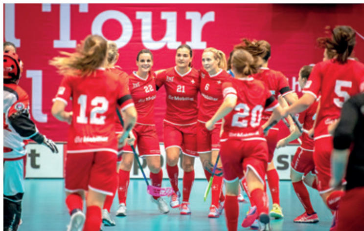
Hop Suisse! Venez tous soutenir l'équipe nationale féminine de unihockey à Neuchâtel! (Fabrice Duc)

continue après la Coupe du monde. Les clubs de unihockey du canton profiteront certainement d'une plus grande visibilité auprès de la population neuchâteloise», explique Reto Gyger. Une telle manifestation suscitera à coup sûr des vocations chez les plus jeunes, plus particulièrement chez les filles, où la participation commence à connaître un nouvel engouement en Suisse romande. C'est aussi une des raisons qui a poussé le club de unihockey de Corcelles-Cormondrèche à déposer sa candidature pour l'événement. (ak)