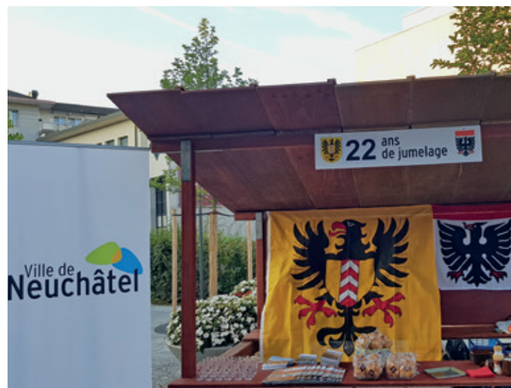
Les aigles des armoiries des deux communes ont pu faire plus ample connaissance!