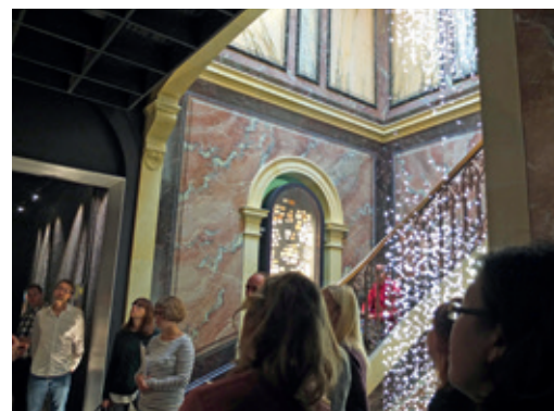
Le Musée d'ethnographie organise plusieurs projections.

Le même jour à 11h et 14h, puis le vendredi 25, participez à une visite guidée géologique du cimetière de Beaugard: un nouveau rendez-vous du Muséum qui propose de découvrir l'étonnante diversité des pierres tombales et de la vie de quelques géologues de Neuchâtel, dont l'éminent Emile