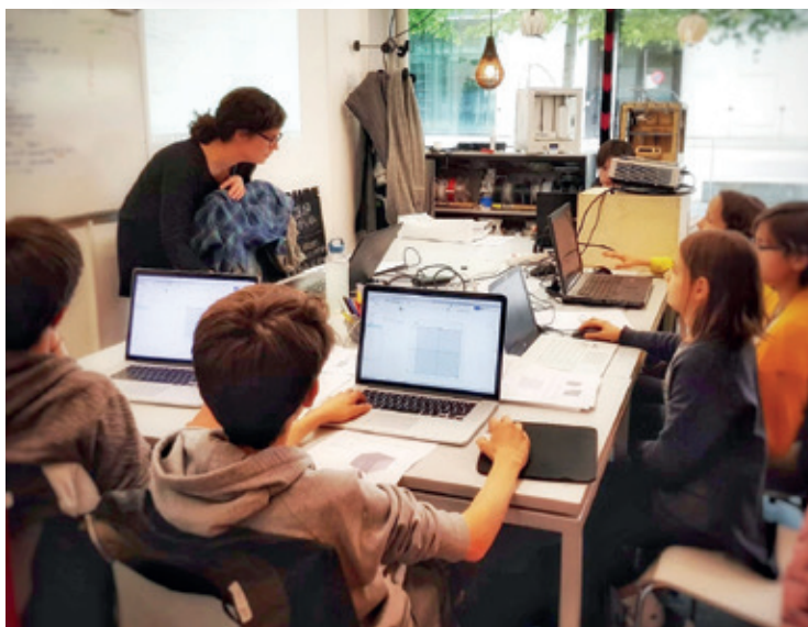
La plupart des ateliers démarrent en octobre.

Les Ateliers Le Labo proposent un concept d'ateliers de développement personnel pour les adolescents. Ces «workshops» ne sont pas du pur divertissement mais une véritable source de déploiement de compétences pour les jeunes gens et jeunes filles.