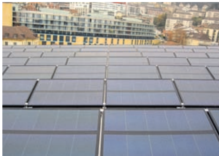
La Ville de Neuchâtel fait une promotion de l'énergie solaire photovoltaïque en réalisant des installations sur ses propres bâtiments, comme ici sur le stade de la Maladière avec un champ de cellules d'une surface de 750 m 2 .

Prenons l'exemple d'un petit propriétaire qui souhaite investir 10'000 francs dans une installation solaire. En portant son choix sur le thermique, il posera 4 m 2 de capteurs sur son toit. Chaque année, il économisera 160 litres de mazout, ce qui correspond, au prix actuel du combustible, à un gain financier annuel de 144 francs. S'il choisit le photovoltaïque, il installera, pour le même prix, 5 m 2 de cellules en toiture. Bon an mal an, il économisera