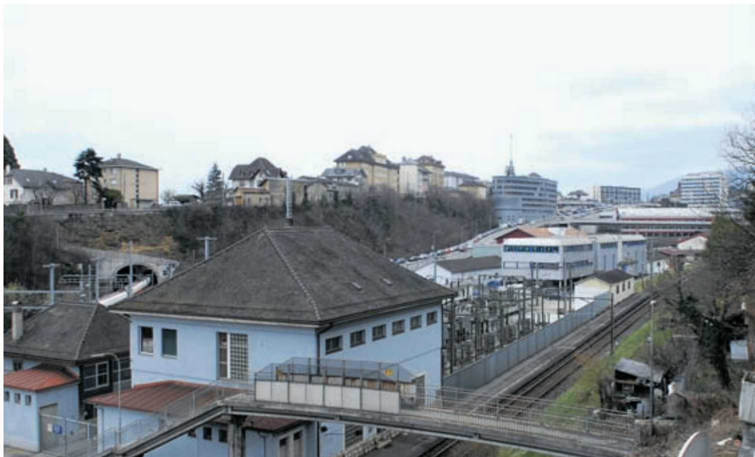
La reprise du droit de superficie rue des Tunnels compte parmi les principaux investissements bruts (1,2 million de francs).

les morales ont diminué de vingt millions depuis 2007