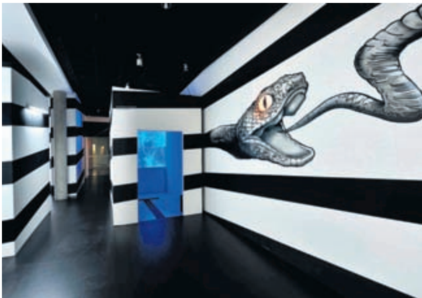
L'exposition se termine sur une note imaginaire avec la représentation artistique de différentes chimères à queue

Pour ces êtres terrestres, la queue est utilisée comme un outil (chasse-mouche, point d'appui, parasol), comme un moyen de communication