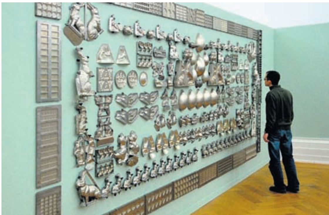
La salle dite des machines avec une multitude de moules servant à confectionner des lapins de Pâques notamment.