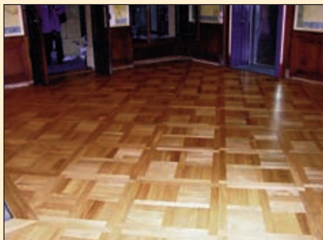
Rénovation de parquets anciens, hall des guichets, Banque de Dépôts et Gestion, Neuchâtel.

L'entreprise s'est adaptée au fur et à mesure aux situations qui évoluent rapidement, adoptant ainsi une politique qui tend à anticiper les événements plutôt que de les subir. www.falkfreres.com