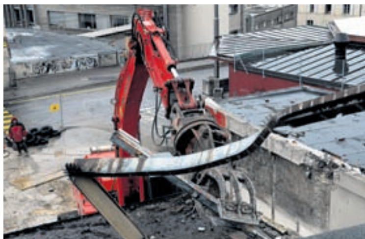
... destruction de la fabrique 9 Suchard, première Case à chocs.