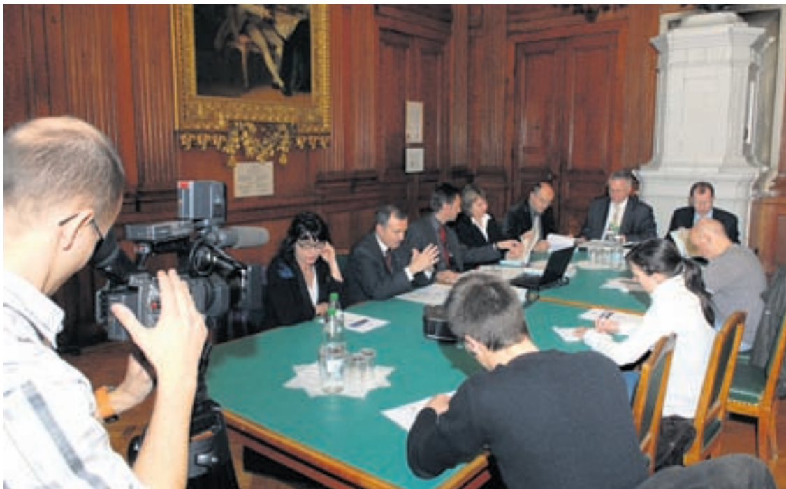
Le Conseil communal constate avec inquiétude la fragilité financière de la Ville.