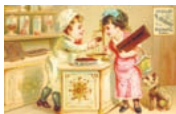
Carte-réclame Suchard datant de 1890, tirée du Fonds Suchard déposé au Musée d'art et d'histoire.

Ce sera la fête au chocolat durant les mois qui viennent à Neuchâtel! Le Musée d'art et d'histoire invite le public à découvrir le monde fascinant de Suchard. Fruit d'une étroite collaboration entre le Musée, l'Université et diverses institutions de conservation, l'exposition intitulée «Le monde selon Suchard» offre un regard transdisciplinaire et novateur sur une aventure industrielle d'importance internationale.