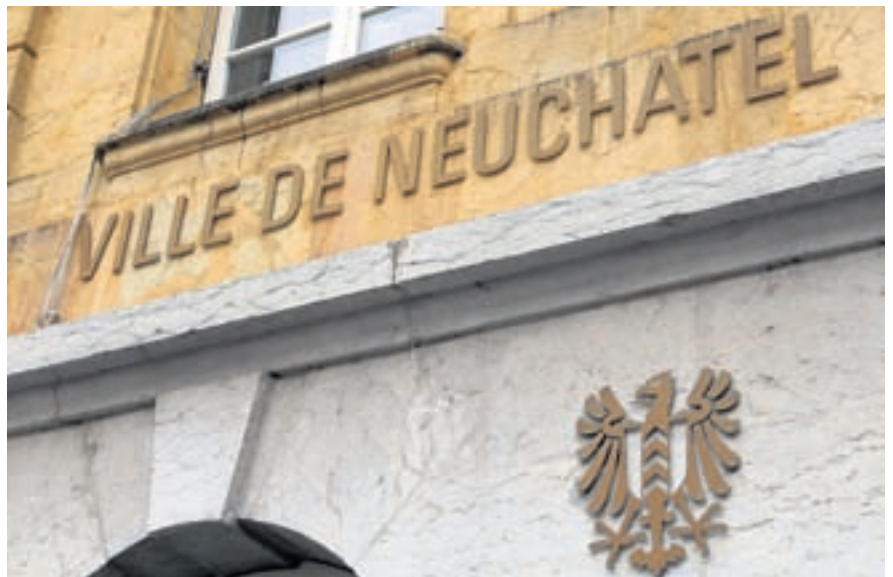
Le système actuel de rémunération des employés fait continuellement gonfler la masse salariale.

D'après les projections de l'étude, la masse salariale de la Ville va augmenter en moyenne de 1,61% en dix ans. En 2006, la situation financière de la