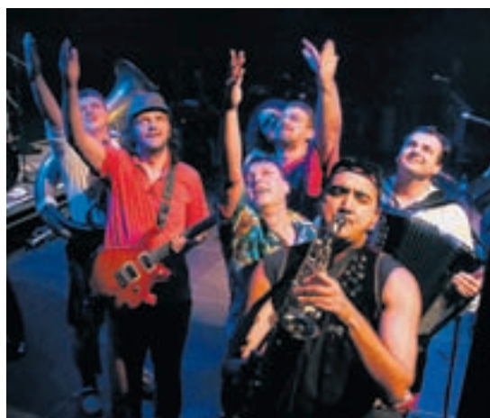
Après Goran Brégovic l'an passé, Emir Kusturica et son orchestre mettront le feu au chapiteau de Festi'neuch.