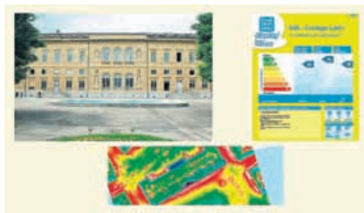
La thermographie aérienne réalisée sur le territoire de la Ville, complétée par l'étiquette énergétique Display®, constitue un outil d'information, de sensibilisation et de diagnostic particulièrement simple, compréhensible et efficace.

En participant activement au projet franco-suisse REVE Jura-Léman entre 2005 et 2008, notre Commune a contribué à développer l'étiquette Display® en Suisse. En complément avec la thermographie aérienne du territoire neuchâtelois, la Ville s'est dotée d'outils particulièrement efficaces au niveau de l'information et de la