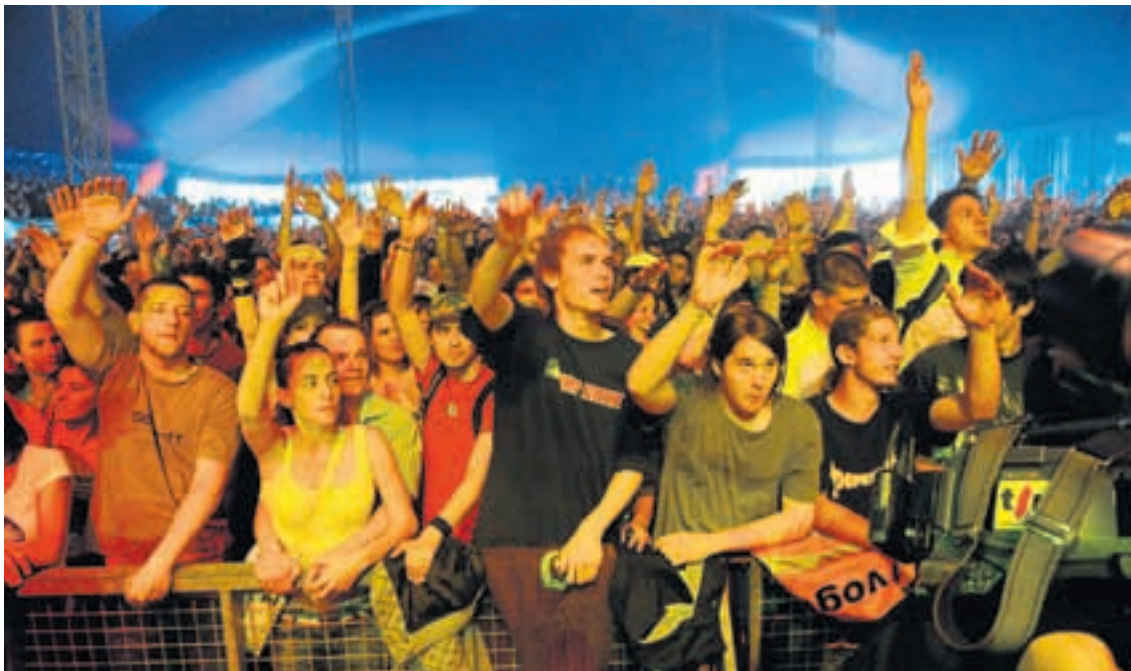
En début d'année, le Conseil général a accordé à Festi'neuch une subvention régulière de 20'000 francs non prévue au budget.