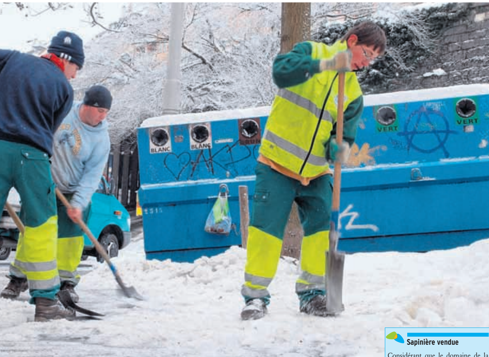
de la Ville et des entreprises privées fortement mis à contribution en début d'année pour déblayer la neige.

de francs pour réparer les routes endommagées par l'hiver