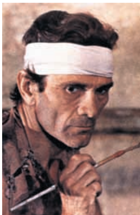
Le Centre Dürrenmatt tente de faire le tour de la personnalité multiple de Pasolini.

L'exposition plonge le visiteur dans l'esthétique pasolinienne et lui