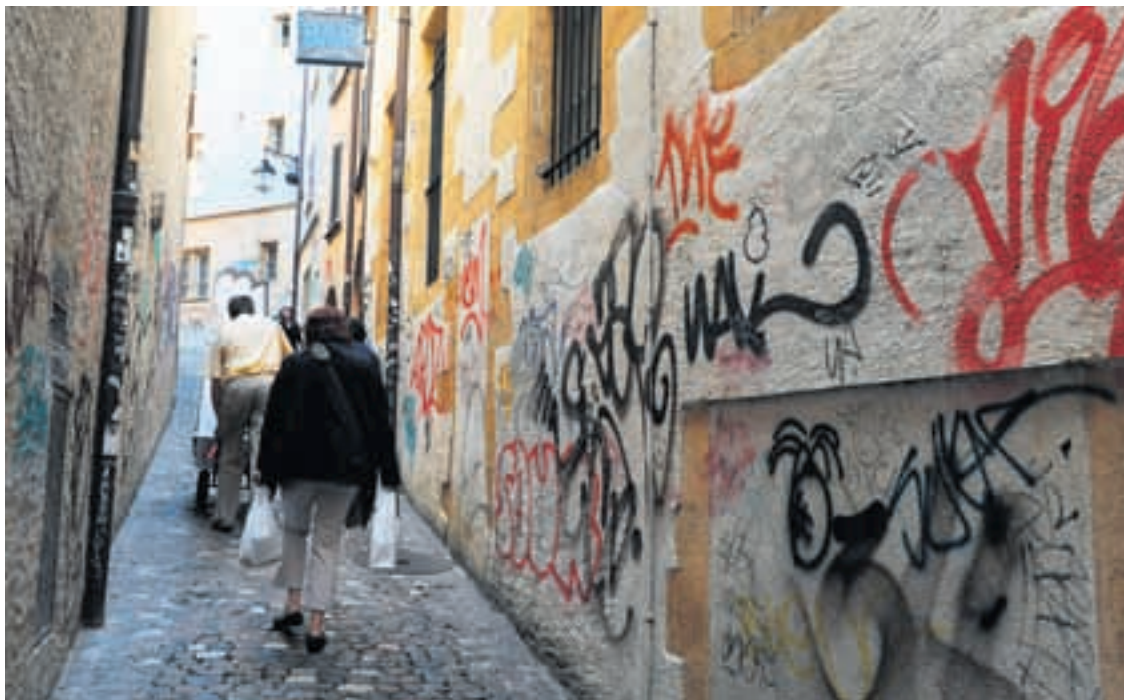
Le Conseil communal va devoir mettre au point une stratégie pour faire disparaître rapidement les tags des murs de la ville.