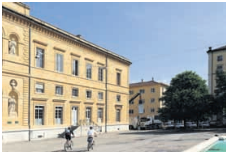
Edifié devant le Collège latin, ce pavillon accueillait les concerts des fanfares de Neuchâtel entre 1906 et 1927, année de sa démolition...