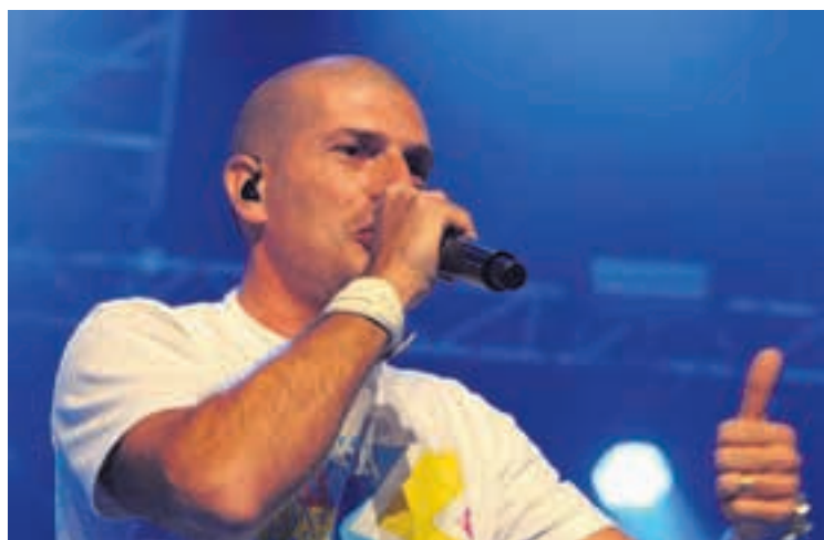
... Philippe Fragione alias Akhenaton à Festi'neuch